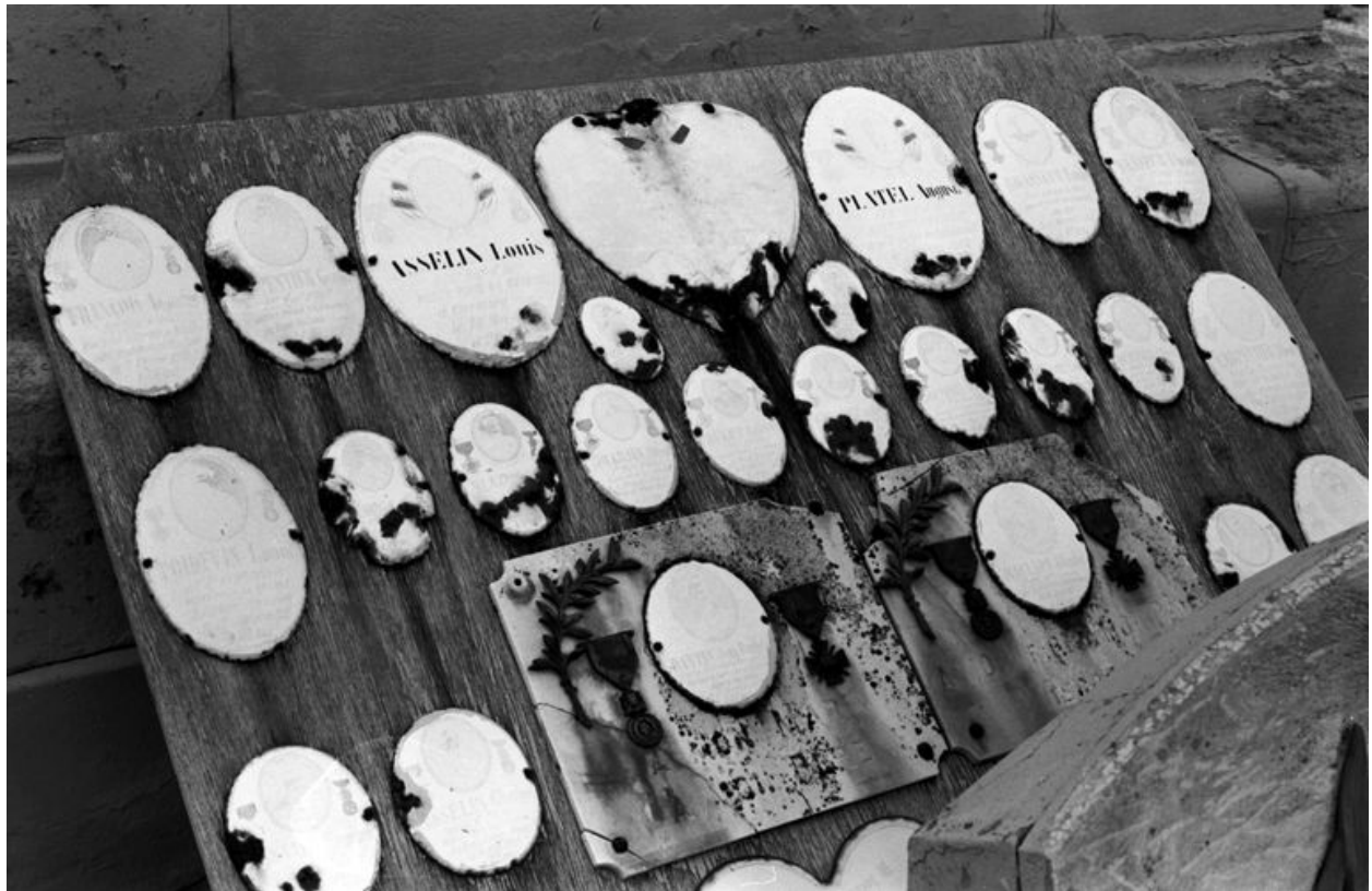
Plaque avec les médaillons des défunts.