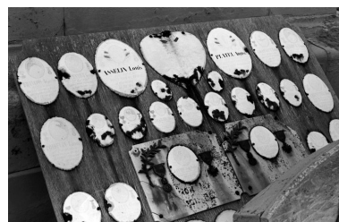
Plaque avec les médaillons des défunts.