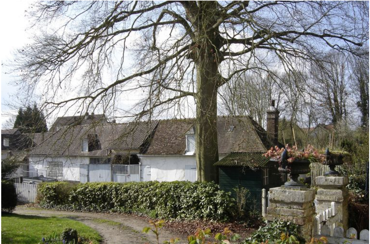
Vue des dépendances situées au sud.