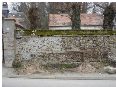
Vue partielle du mur de clôture.