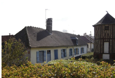
Vue des dépendances du nord depuis la cour.