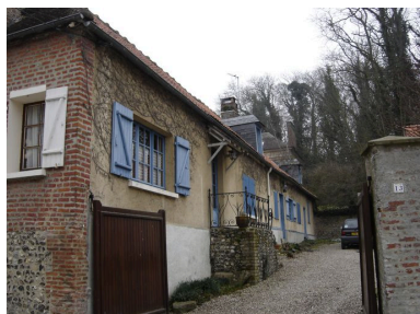
Vue générale de la dépendance située au nord.