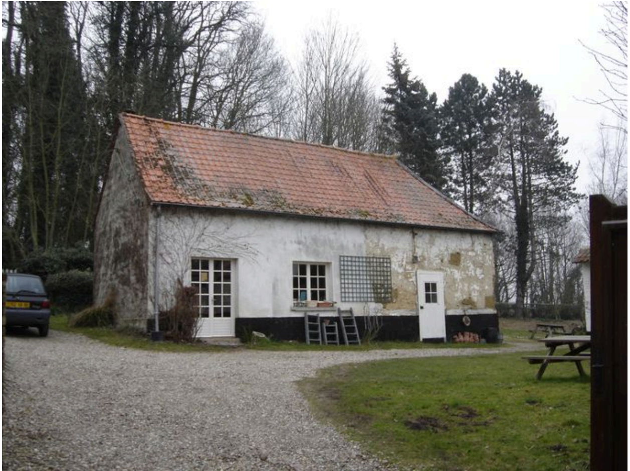
Vue de la petite dépendance .