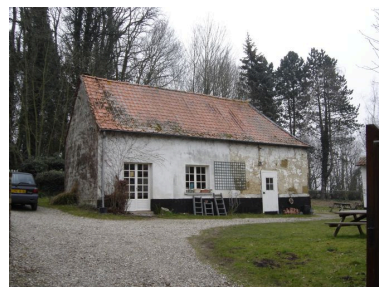
Vue de la petite dépendance .