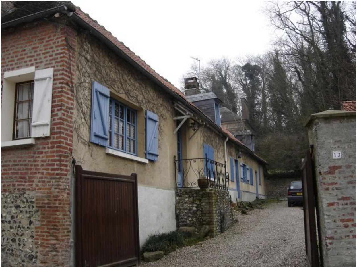
Vue générale de la dépendance située au nord.