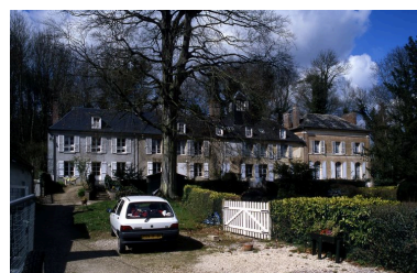
Vue générale. IVR22_20068000168XA