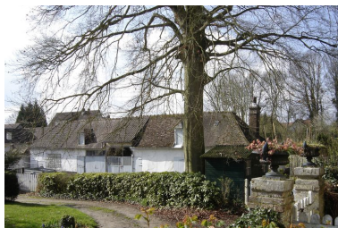
Vue des dépendances situées au sud.

IVR22_20068000167XA