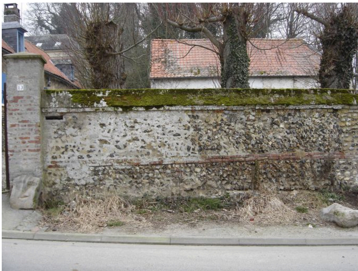
Vue partielle du mur de clôture.