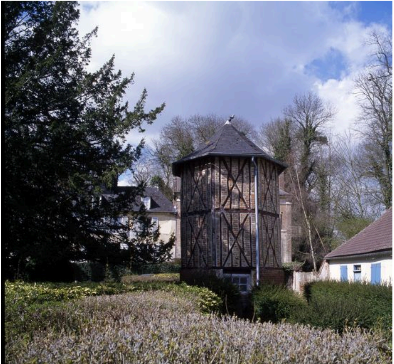
Vue du pigeonnier.