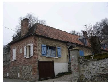
Vue des dépendances du nord depuis la rue.