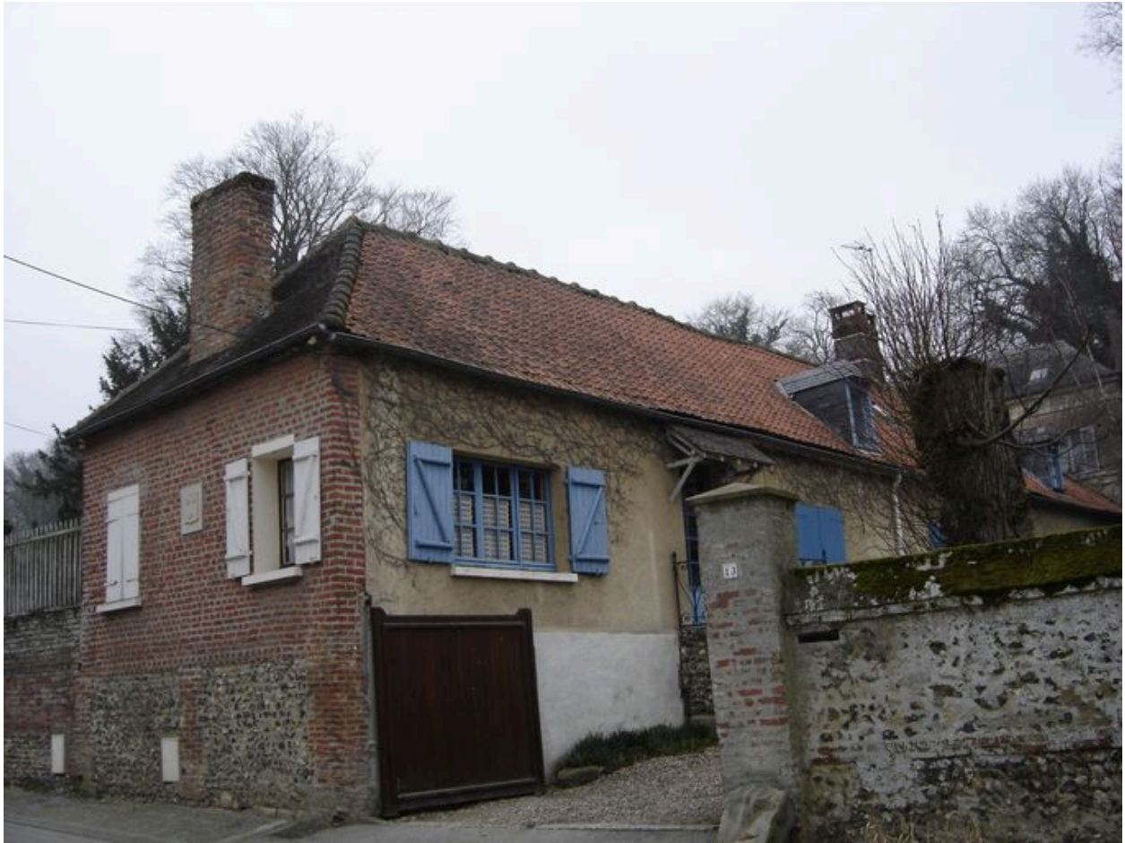
Vue des dépendances du nord depuis la rue.