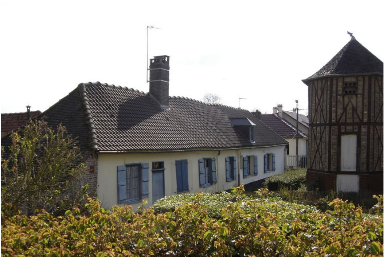
Vue des dépendances du nord depuis la cour.