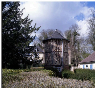
Vue du pigeonnier.

IVR22_20078005388XAB