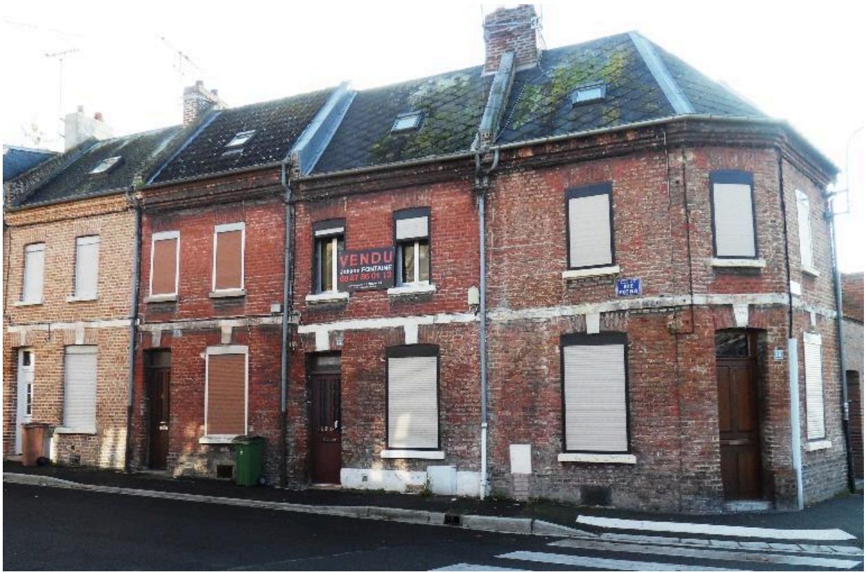
Maisons de la rive sud, à l'angle du quai de l'Ecluse.