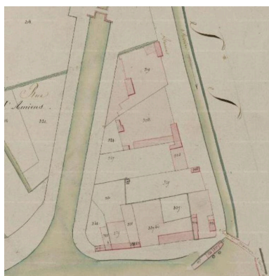
Extrait du cadastre napoléonien de 1813 (AD Somme ; 3 P 1162). IVR22_20158005039NUCA