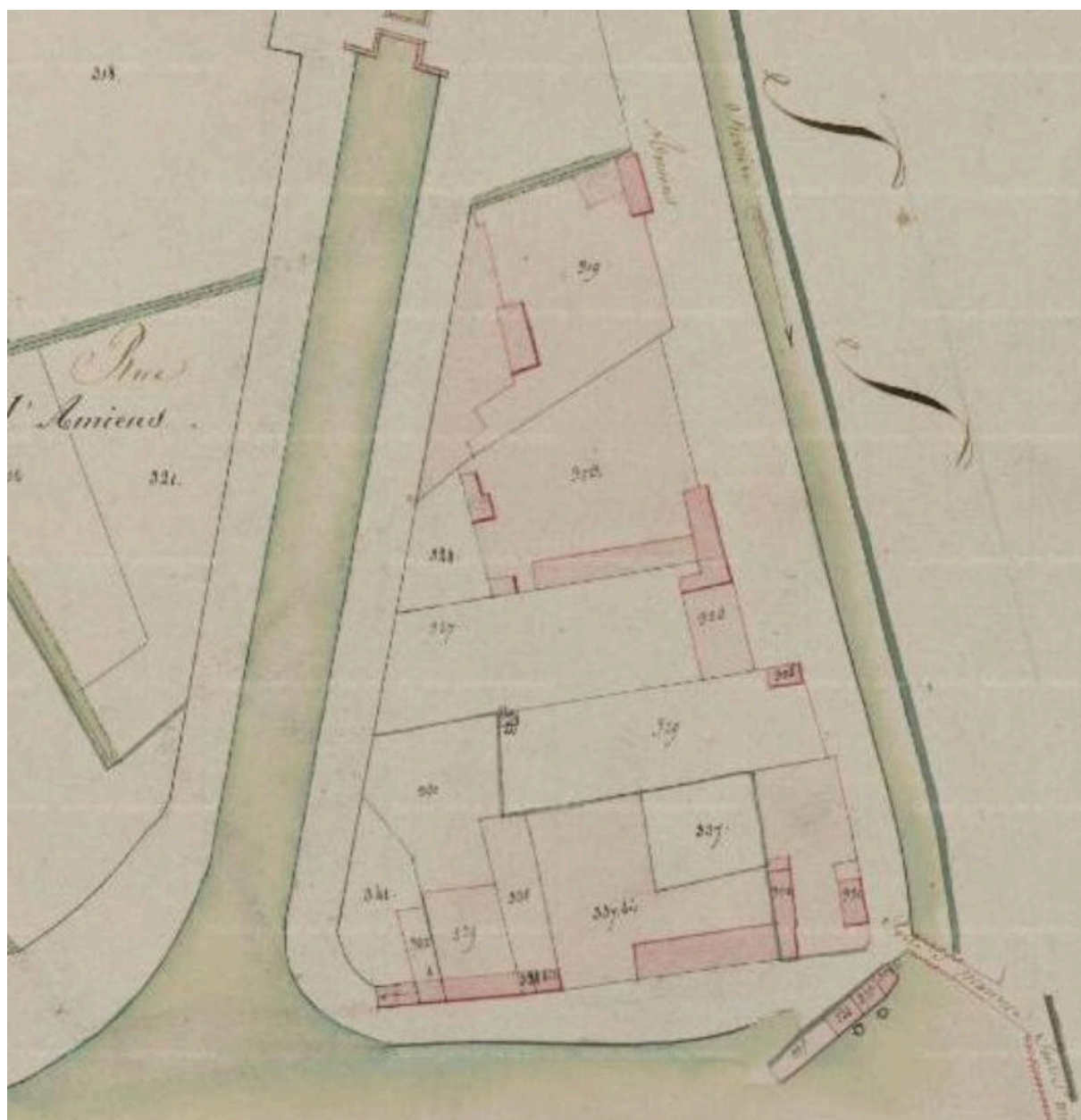
Extrait du cadastre napoléonien de 1813 (AD Somme ; 3 P 1162).