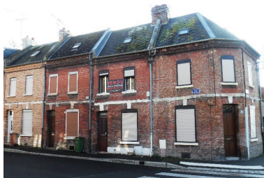
Maisons de la rive sud, à l'angle du quai de l'Ecluse. IVR22_20158005037NUCA