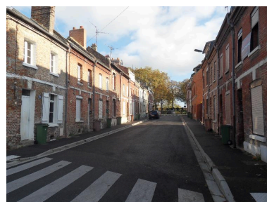
Vue depuis le quai de l'Ecluse. IVR22_20158005035NUCA