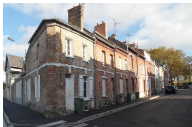
Maisons de la rive nord. IVR22_20158005036NUCA