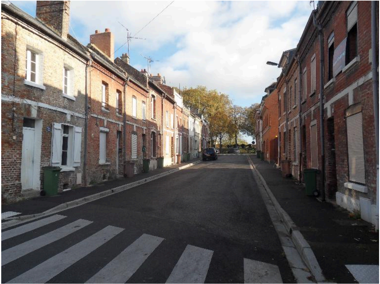
Vue depuis le quai de l'Ecluse.