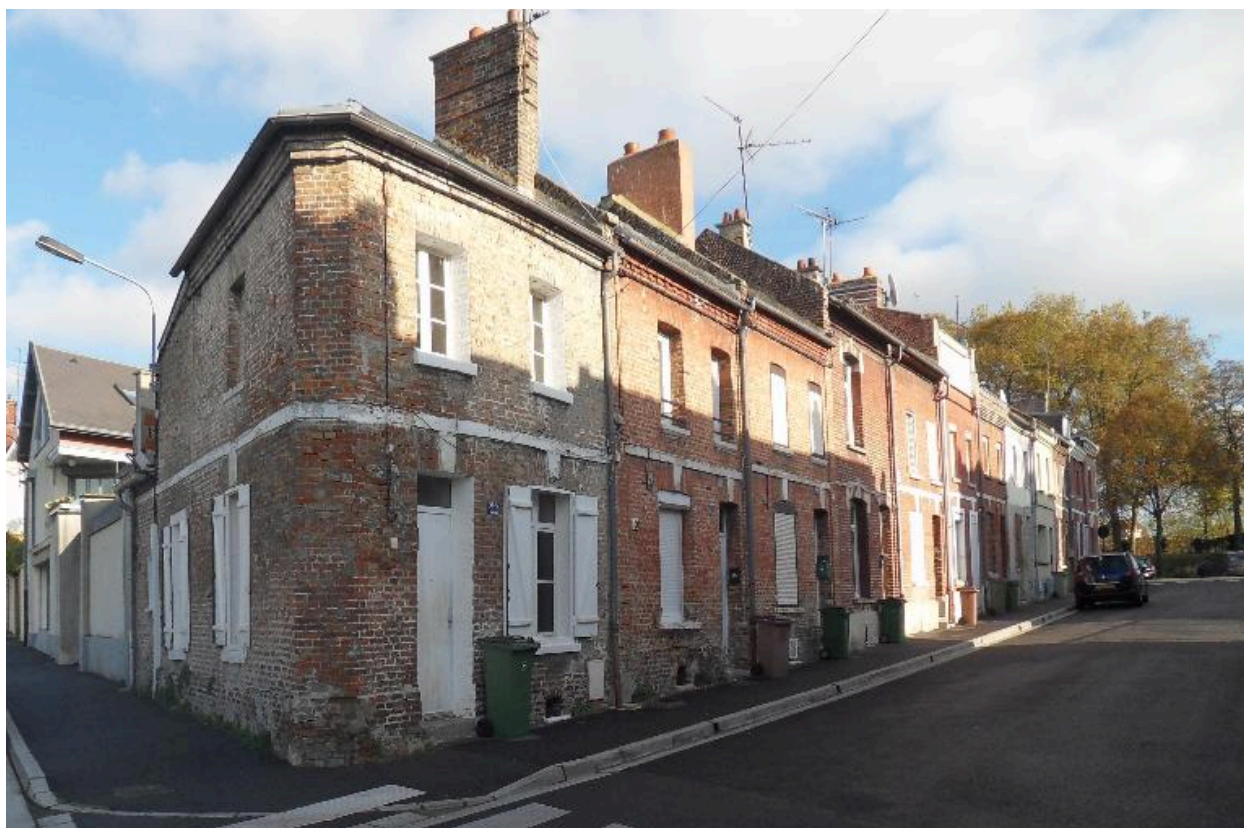
Maisons de la rive nord.