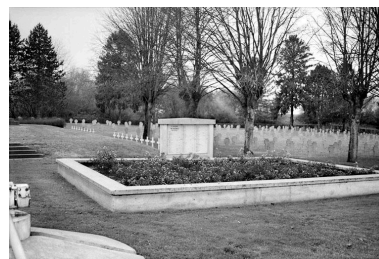
Vue d'une stèle, marquant le carré des sépultures de soldats allemands, au sud de la plate-forme de l'obélisque. IVR22_20030200152Z