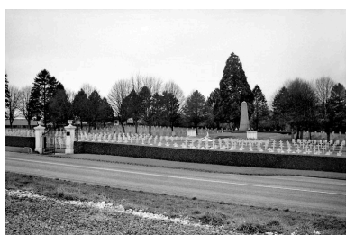
Vue générale du cimetière, depuis la route.