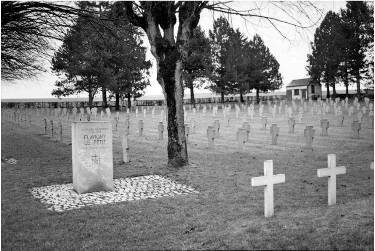
Vue de la sépulture commune des soldats allemands, située à droite devant la plate-forme de l'obélisque.