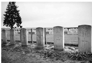
Vue d'une rangée de sépultures de soldats du Commonwealth dans un carré au nord de l'allée centrale.