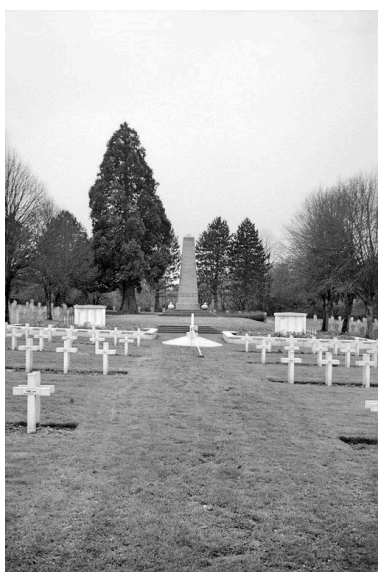
Vue de l'allée centrale et de l'obélisque. IVR22_20030200148Z