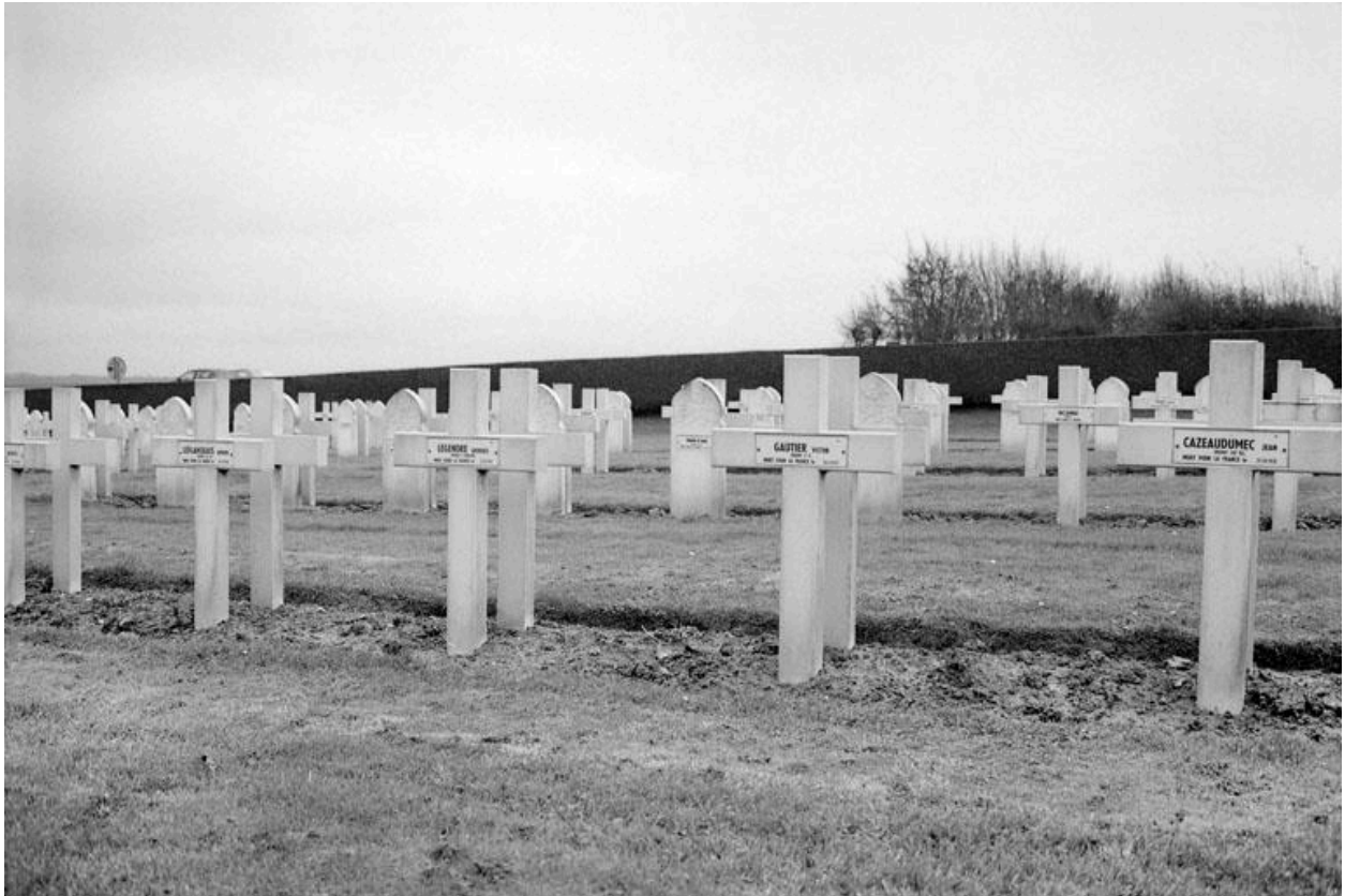
Vue du carré français au sud de l'allée centrale, montrant des sépultures de soldats chrétiens au premier plan, et musulmans au second plan.