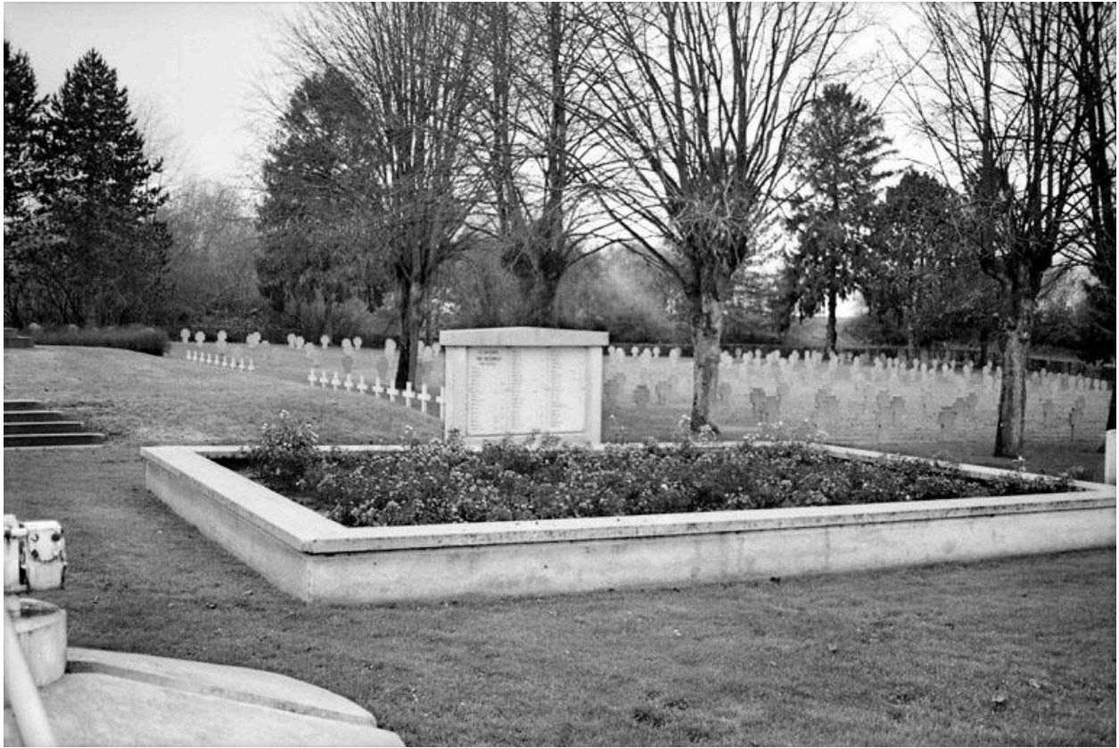
Vue d'une stèle, marquant le carré des sépultures de soldats allemands, au sud de la plate-forme de l'obélisque.