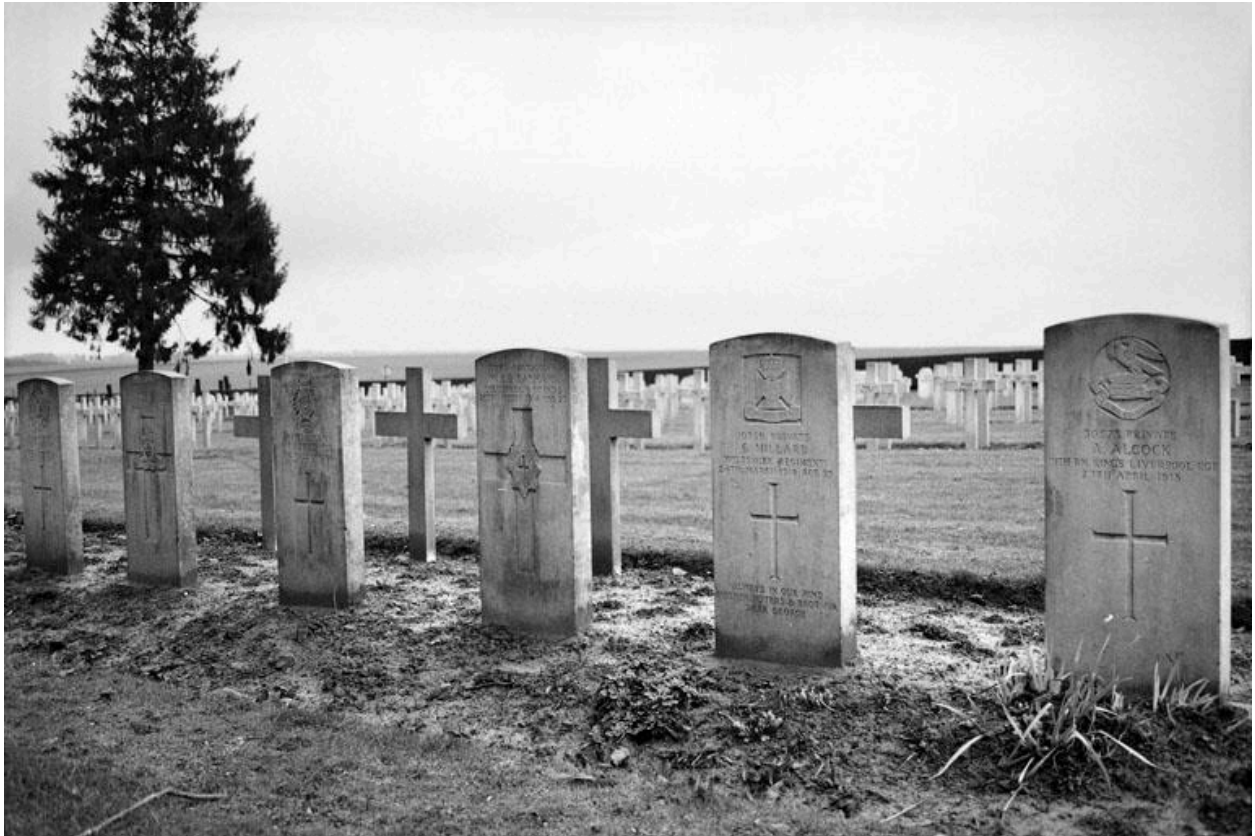
Vue d'une rangée de sépultures de soldats du Commonwealth dans un carré au nord de l'allée centrale.