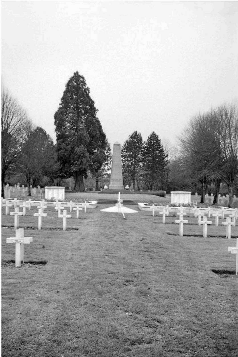
Vue de l'allée centrale et de l'obélisque.