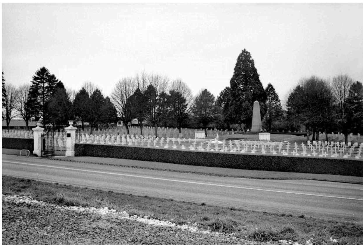
Vue générale du cimetière, depuis la route.