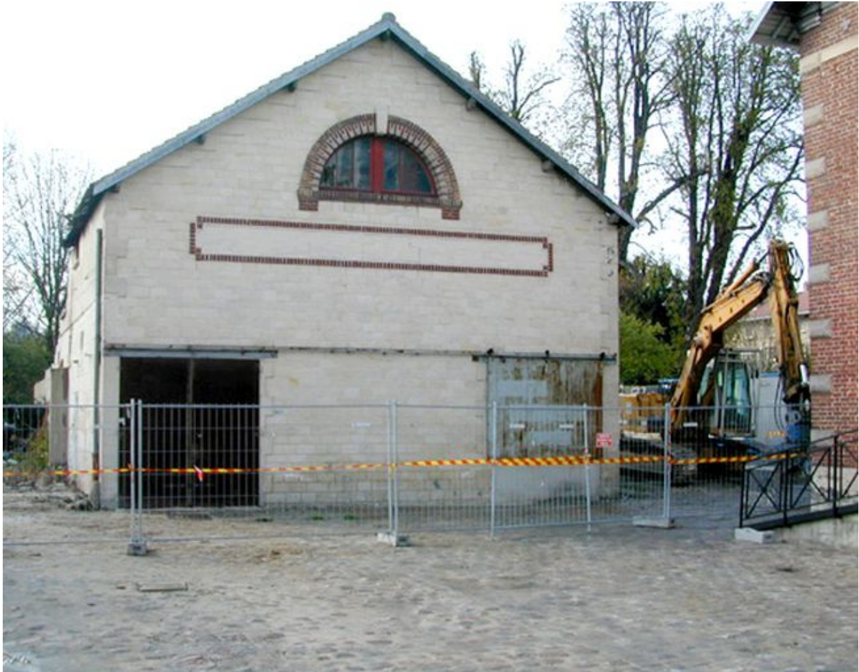
La halle aux vins en cours de démolition, avril 2003 (AC Nogent-sur-Oise).