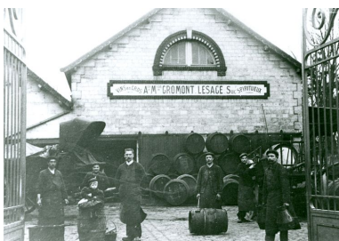
La halle aux vins au début du 20e siècle.