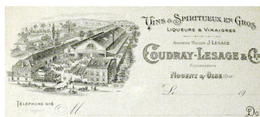
Papier à lettre à en-tête des entrepôts Coudray-Lesage, vers 1920 (AC Nogent). IVR22_20096005010NUCAB