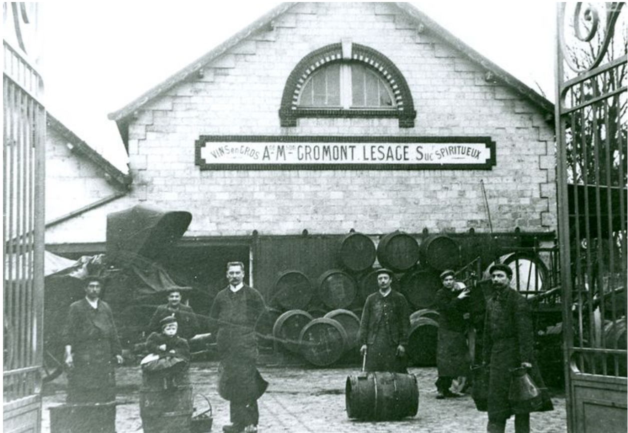
La halle aux vins au début du 20e siècle.