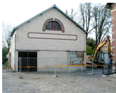
La halle aux vins en cours de démolition, avril 2003 (AC Nogent-sur-Oise). IVR22_20096005012NUCA