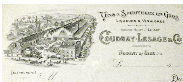
Papier à lettre à en-tête des entrepôts Coudray-Lesage, vers 1920 (AC Nogent).