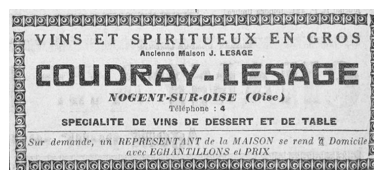
Publicité pour les entrepôts Coudray-Lesage, 1923.