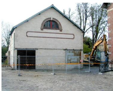
La halle aux vins en cours de démolition, avril 2003 (AC Nogent-sur-Oise).