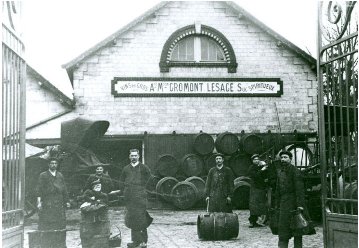
La halle aux vins au début du 20e siècle.