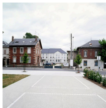
Vue générale des anciens entrepôts Coudray et Lesage.