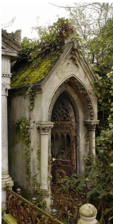
Vue de trois-quarts du tombeau-chapelle.