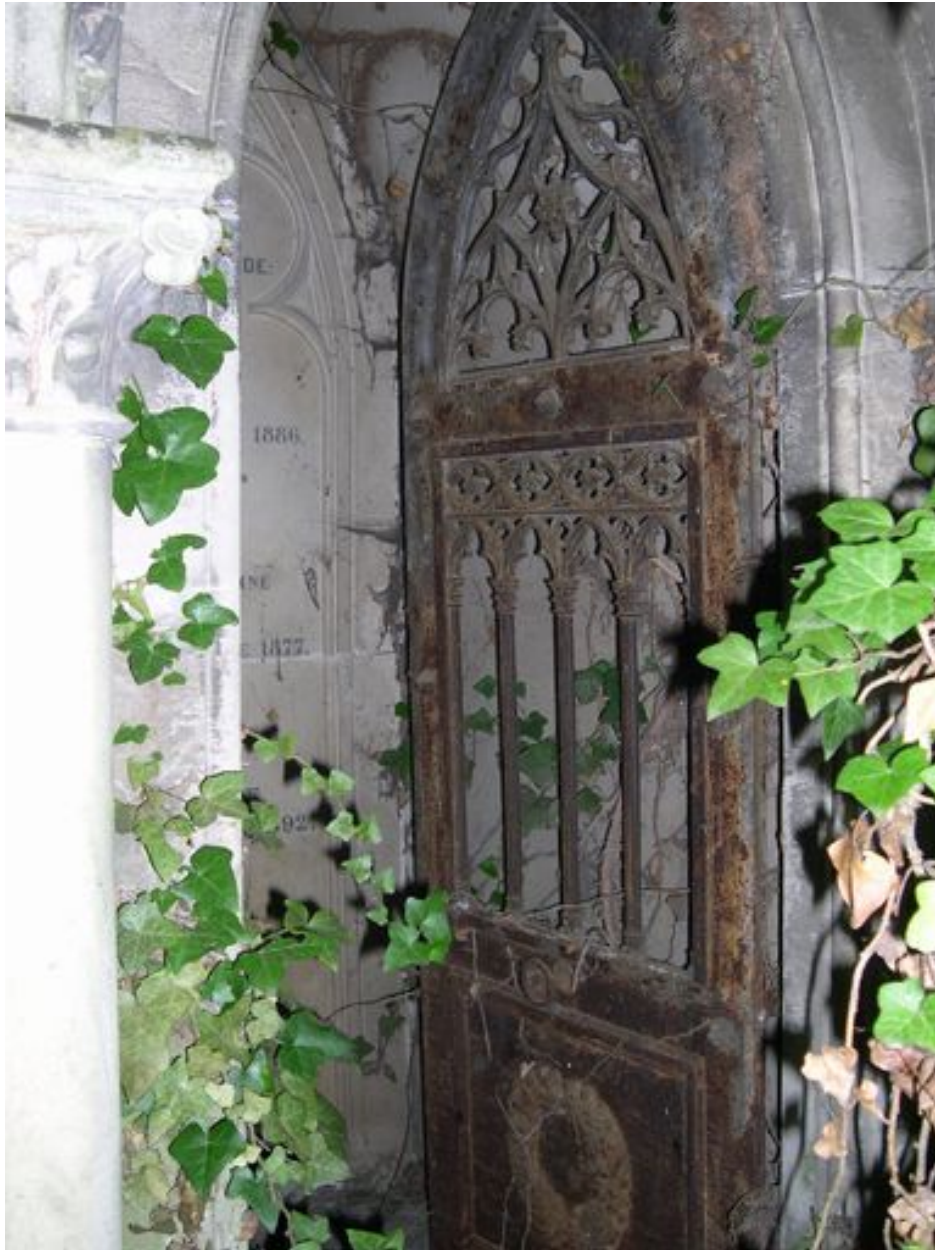
Détail de la porte.