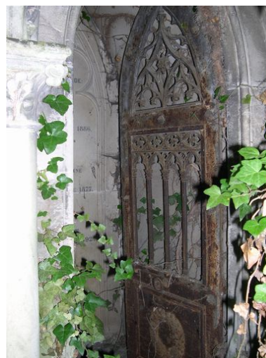
Détail de la porte.