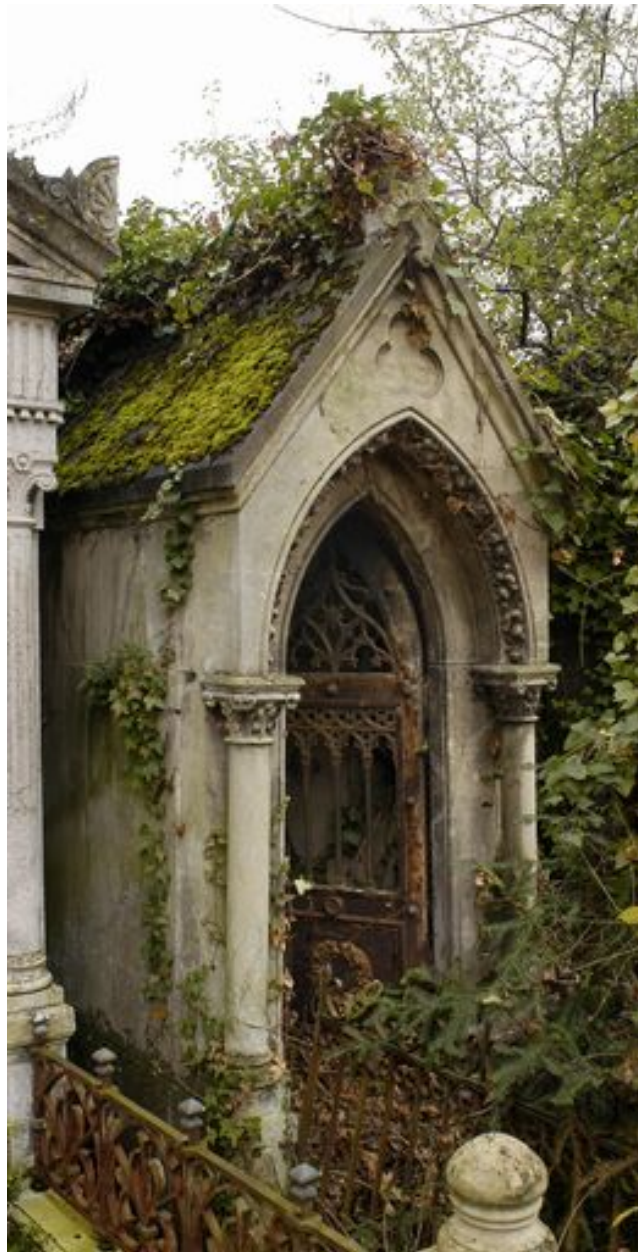
Vue de trois-quarts du tombeau-chapelle.