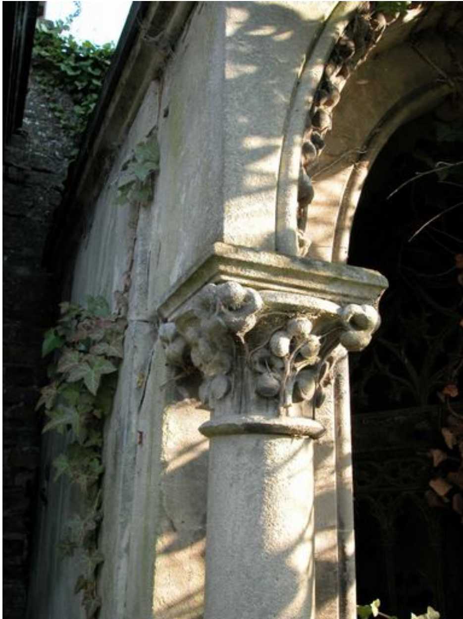
Détail d'un chapiteau.