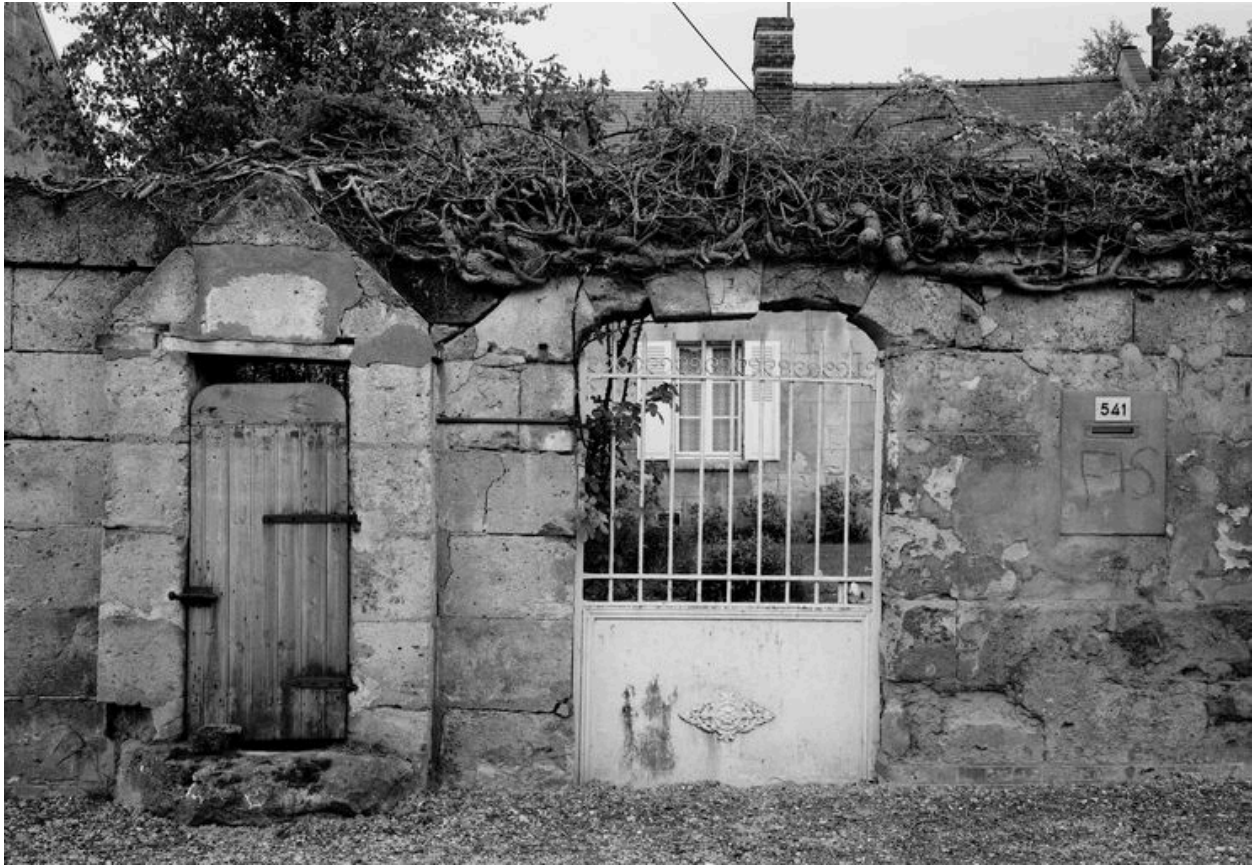
Portail et puits.