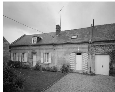
Elévation antérieure.