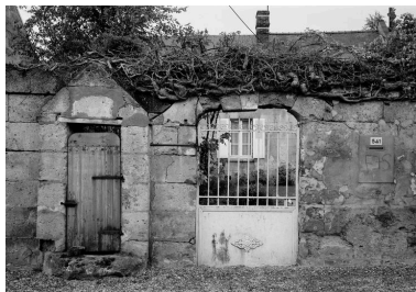
Portail et puits.