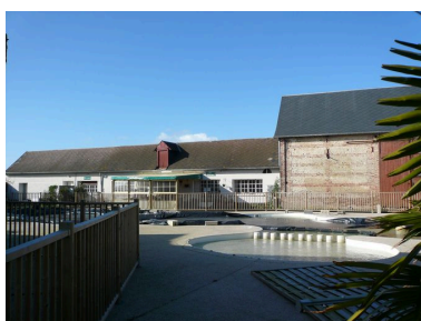
Vue des étables au nord.