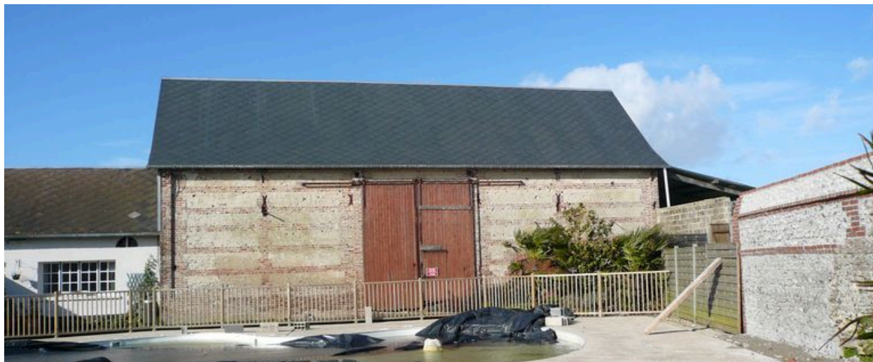
Vue de la grange au nord de la cour.