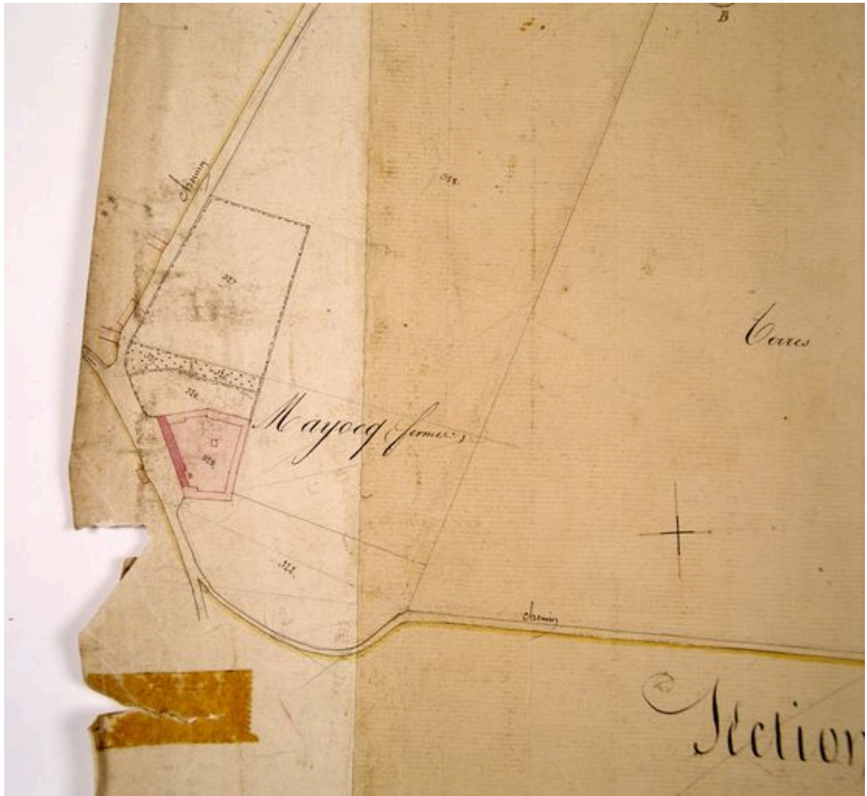
Extrait du cadastre napoléonien présentant le plan de la ferme en 1828.