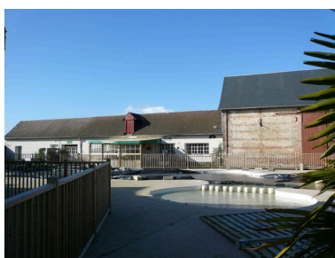
Vue des étables au nord. IVR22_20078005421NUCA