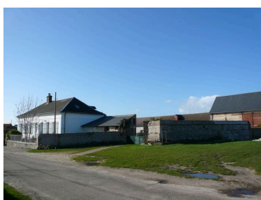
Vue d'ensemble depuis le sud-est. IVR22_20078005422NUCA

IVR22_20078005418XAB