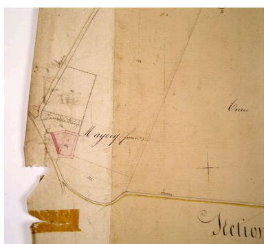
Extrait du cadastre napoléonien présentant le plan de la ferme en 1828.

IVR22_20078005418XAB