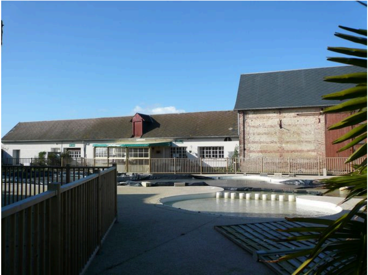
Vue des étables au nord.