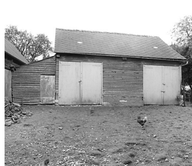
Vue de la remise agricole, fin 19e siècle. IVR22_19980201005X