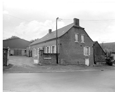
Vue du logis depuis la rue.