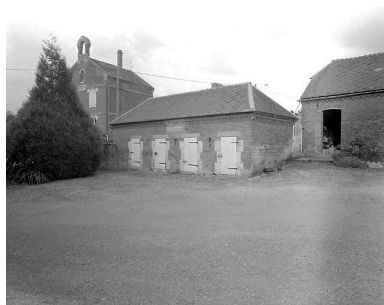
Vue de la porcherie. IVR22_19980201003X