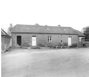
Vue de la remise agricole, 2e moitié 19e siècle. IVR22_19980201004X