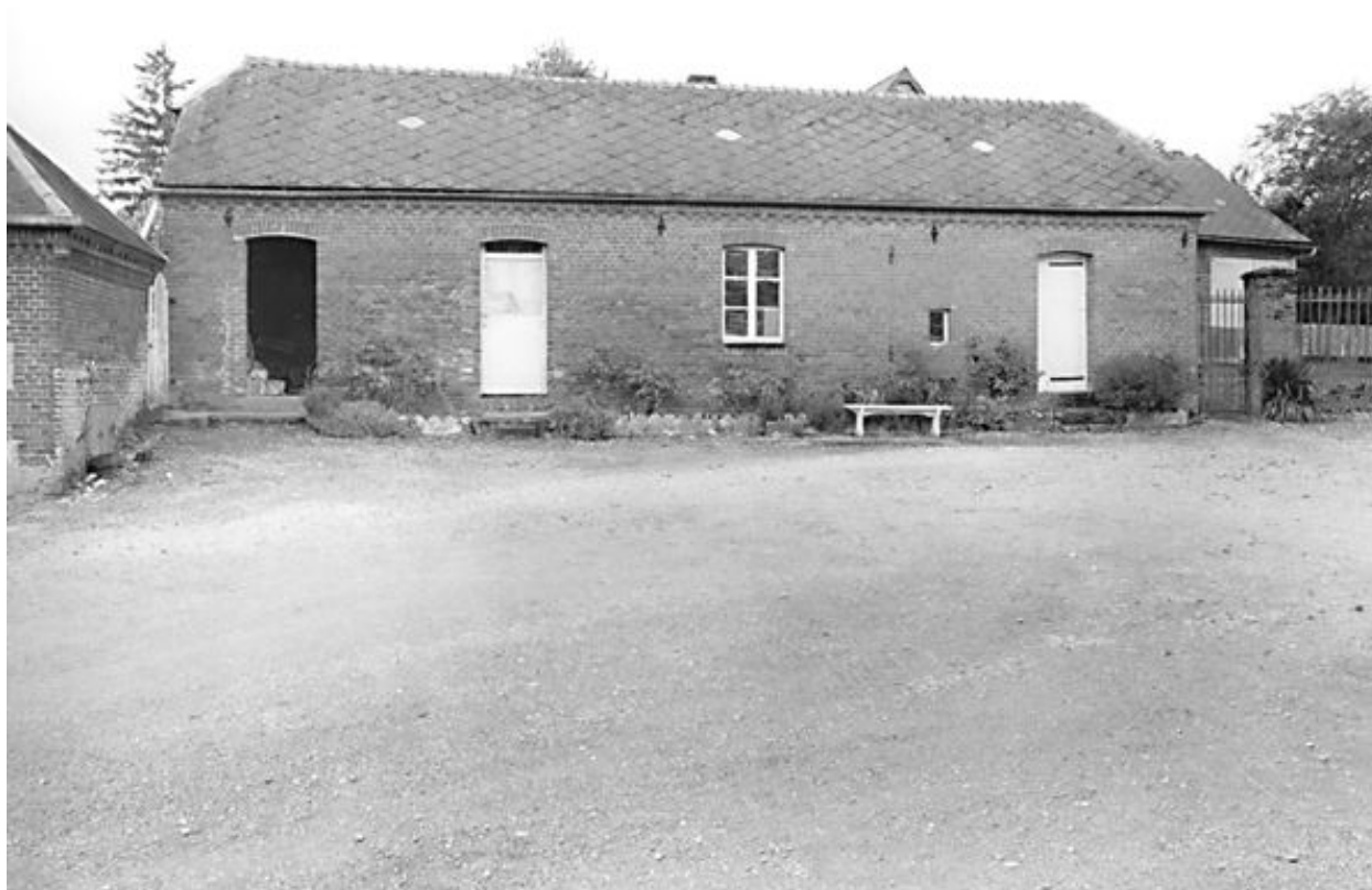
Vue de la remise agricole, 2e moitié 19e siècle.