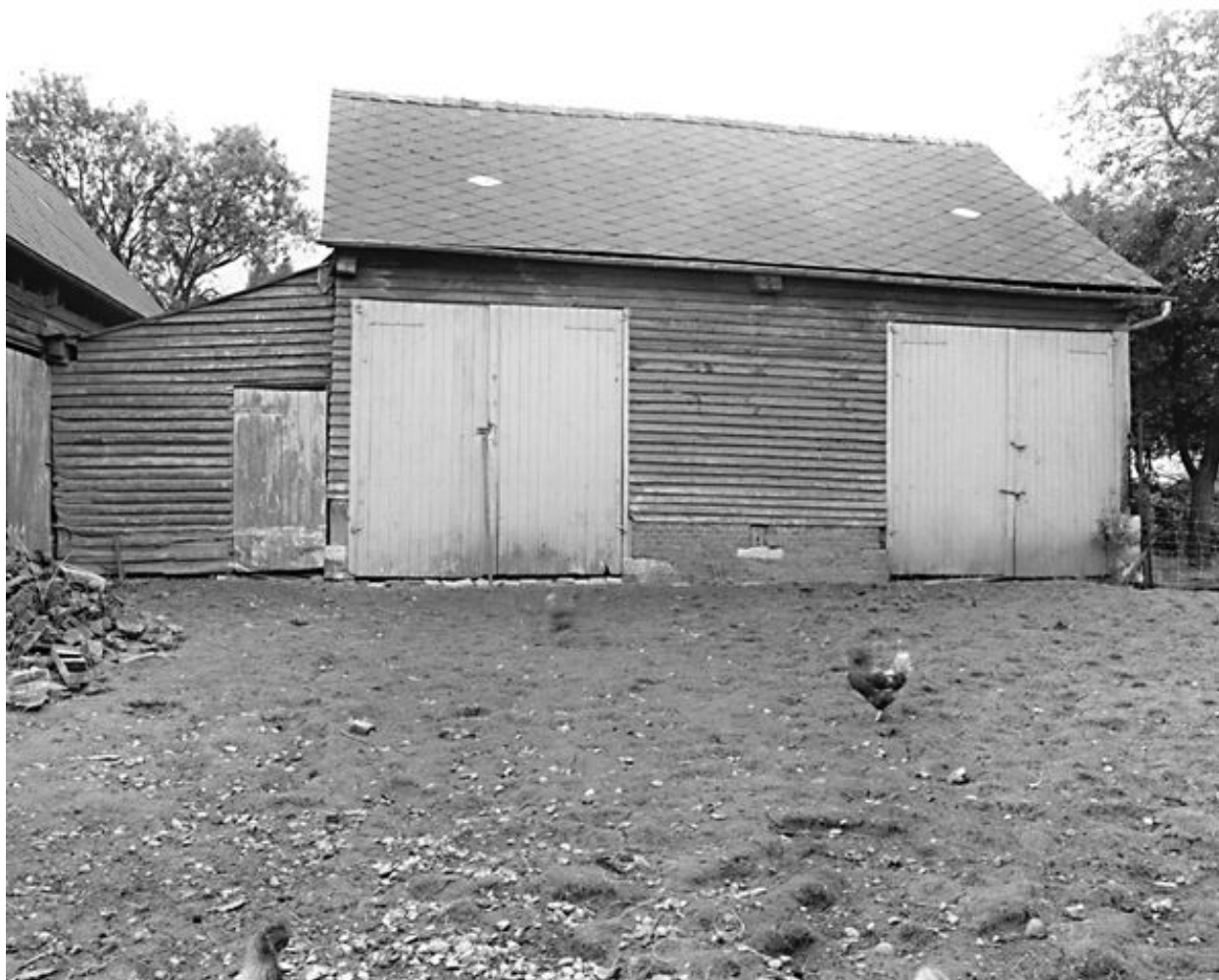
Vue de la remise agricole, fin 19e siècle.