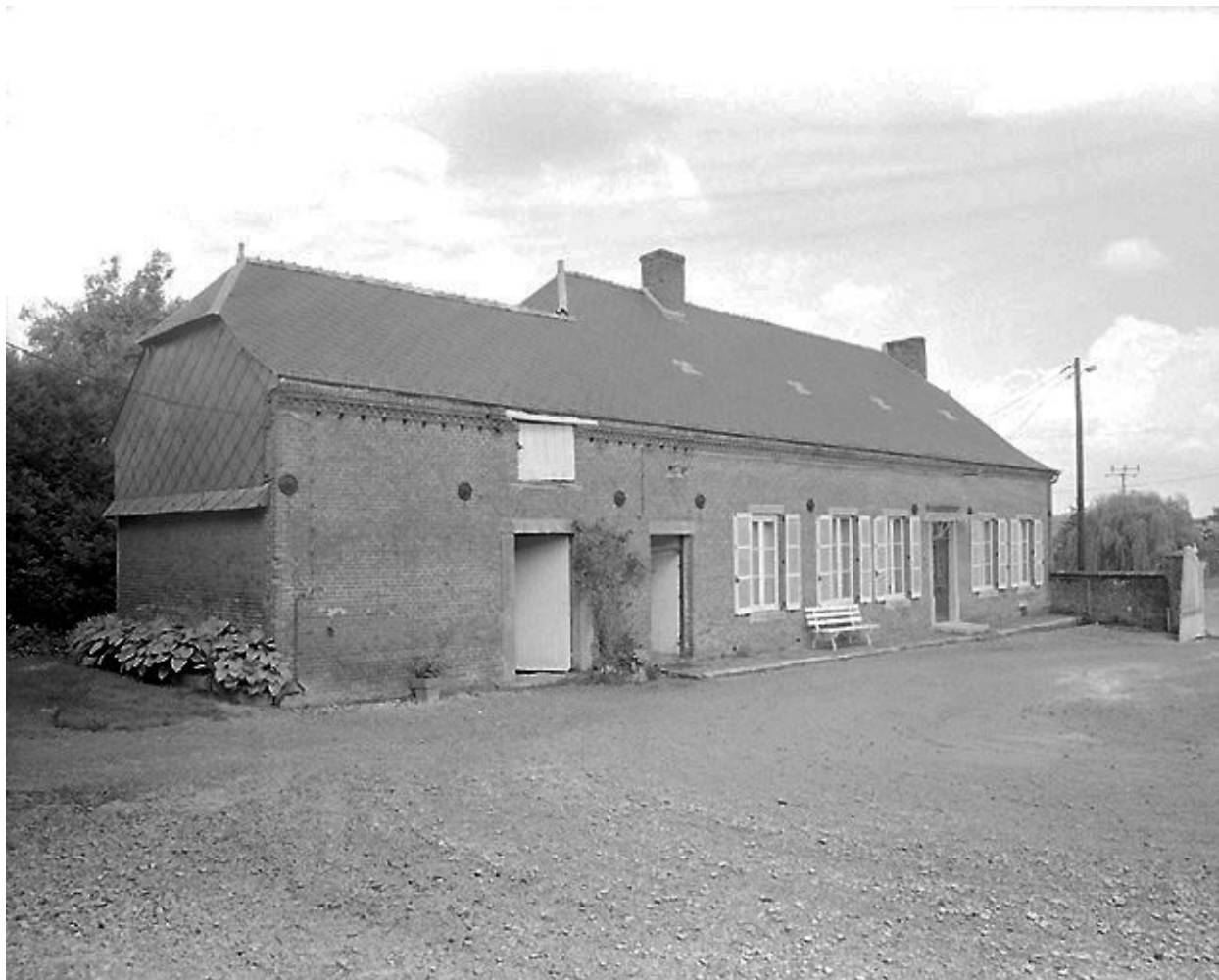
Vue depuis le sud-ouest du logis et de l'étable attenante.