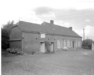
Vue depuis le sud-ouest du logis et de l'étable attenante. IVR22_19980201001X