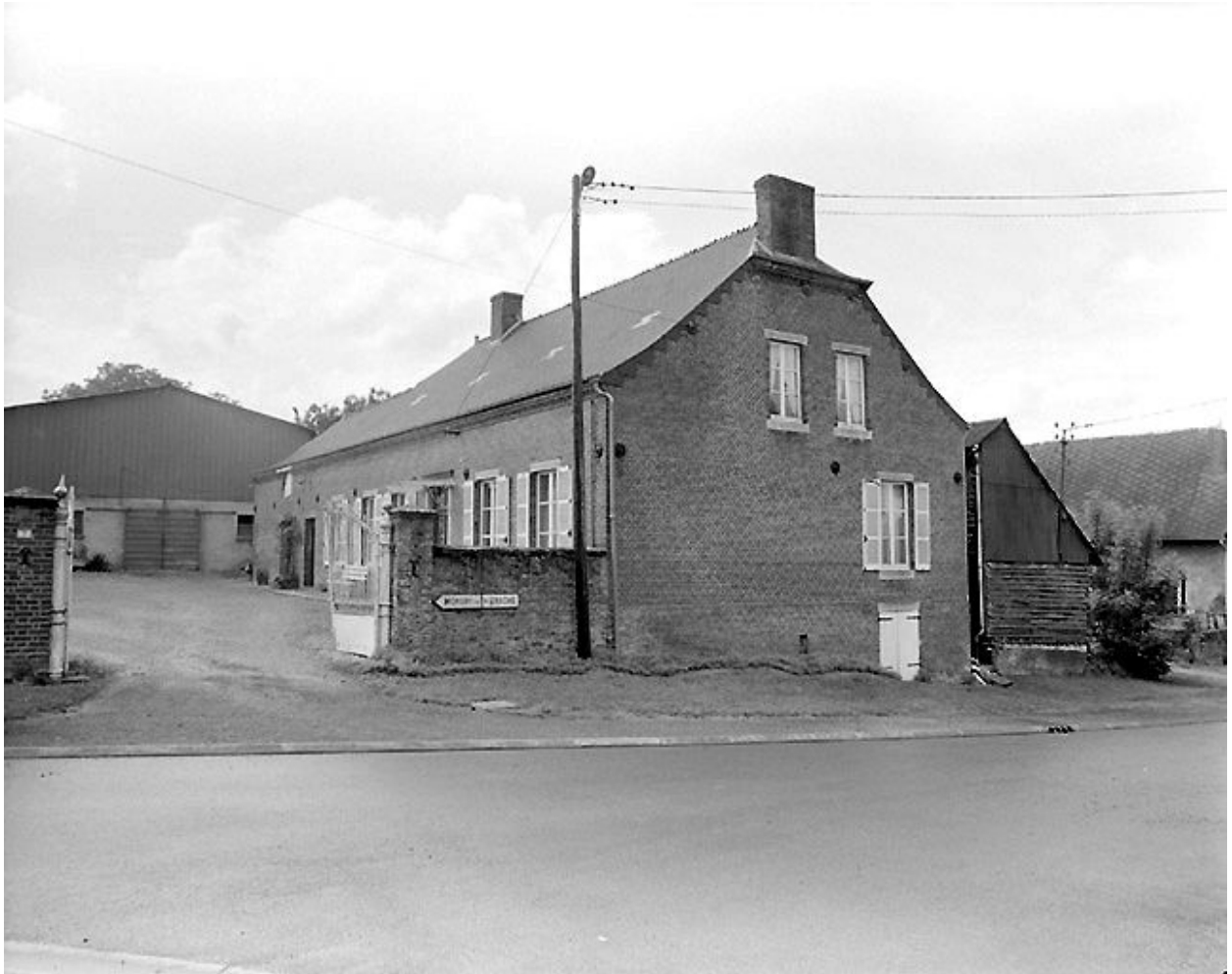
Vue du logis depuis la rue.