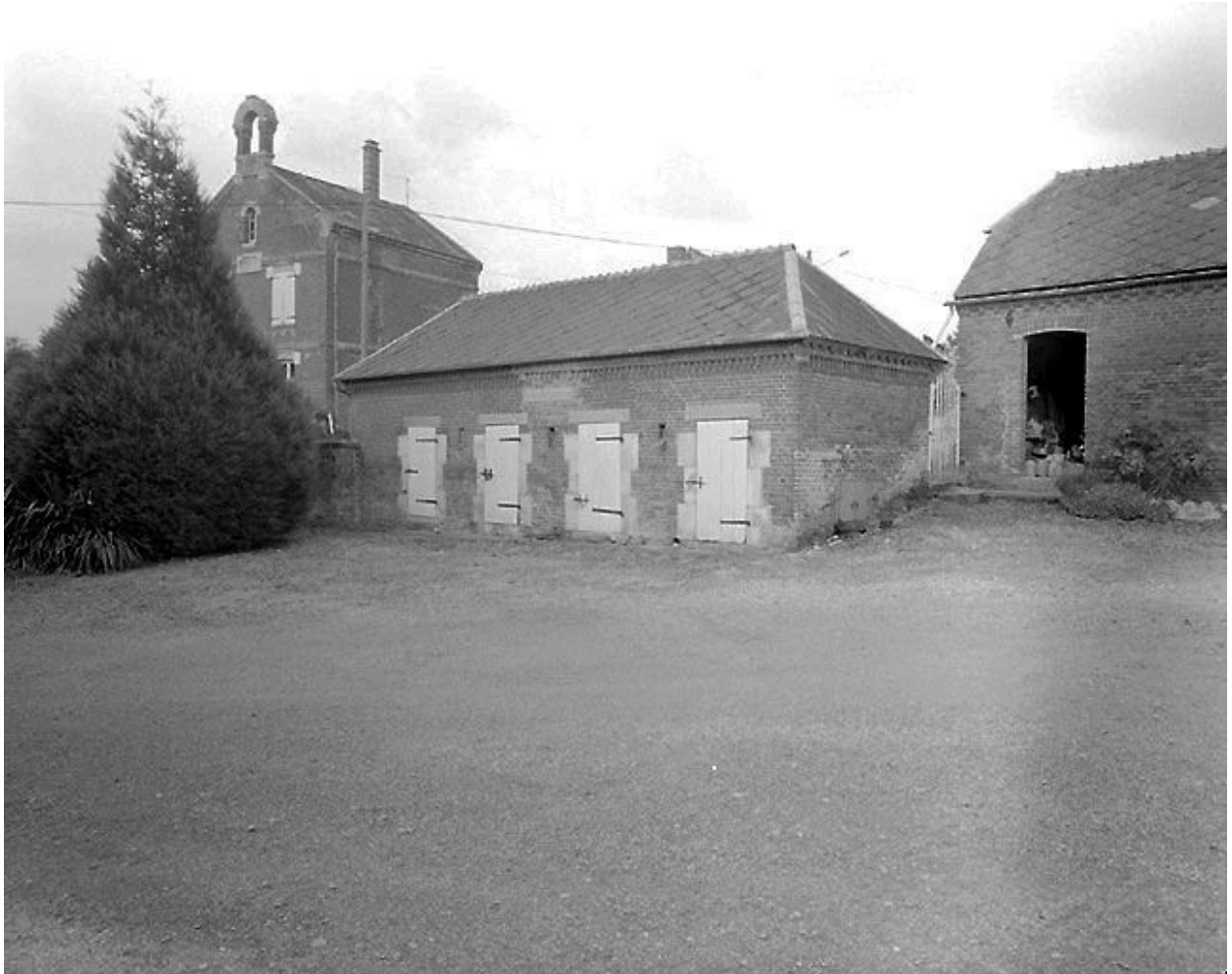
Vue de la porcherie.