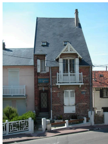
Vue d'ensemble, élévation sur rue. IVR22_20058003010NUCA