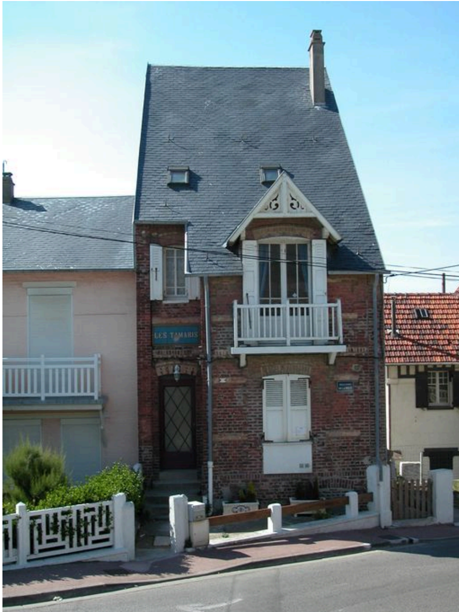
Vue d'ensemble, élévation sur rue.