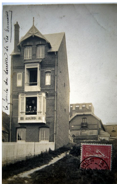
La façade sur mer, carte photo, 1er quart 20e siècle (coll. part.) IVR22_20058000619XAB