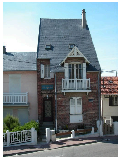
Vue d'ensemble, élévation sur rue.