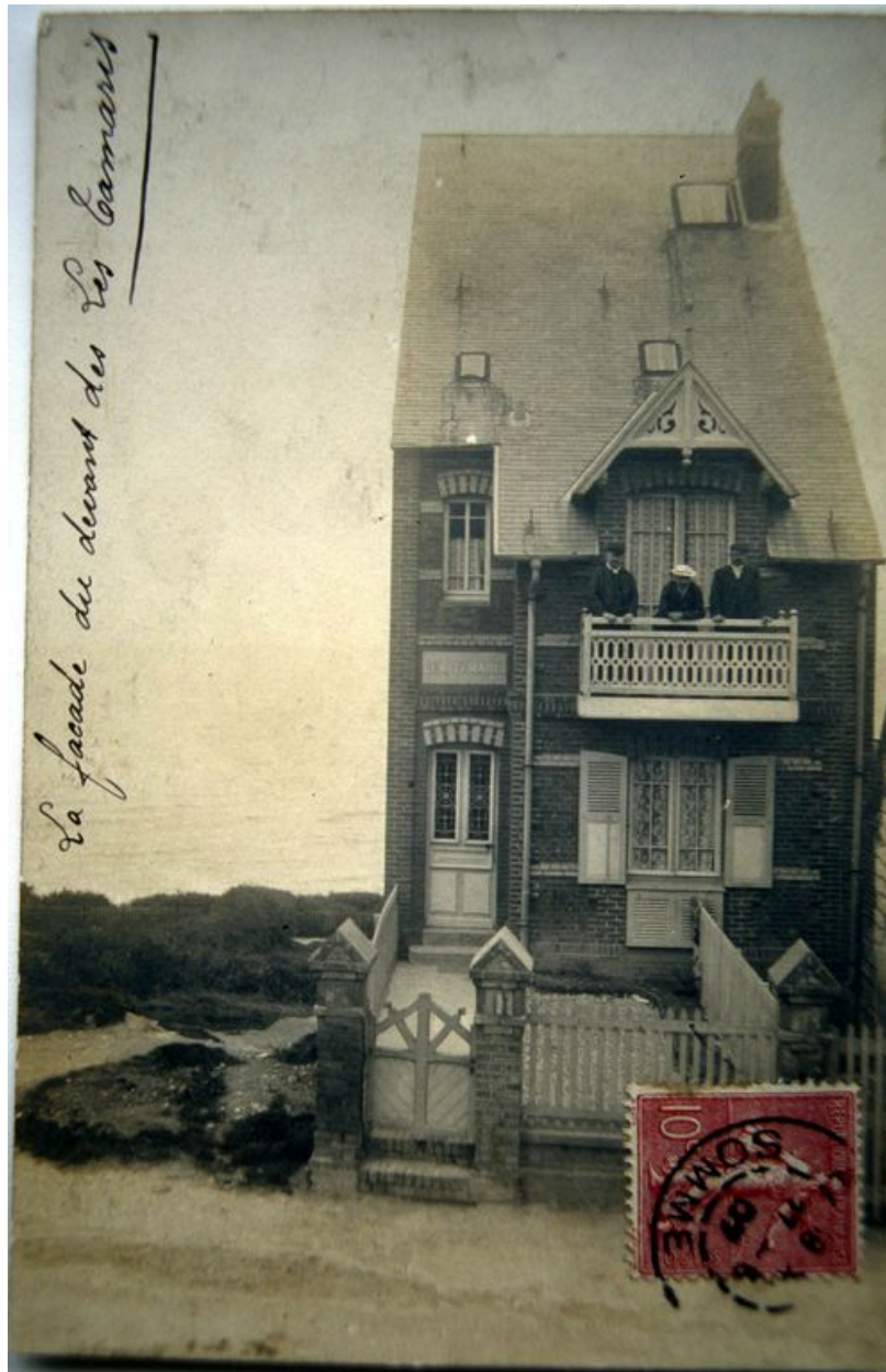
La façade sur rue, carte photo, 1er quart 20e siècle (coll. part.).