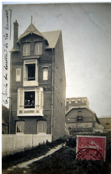
La façade sur mer, carte photo, 1er quart 20e siècle (coll. part.) IVR22_20058000619XAB