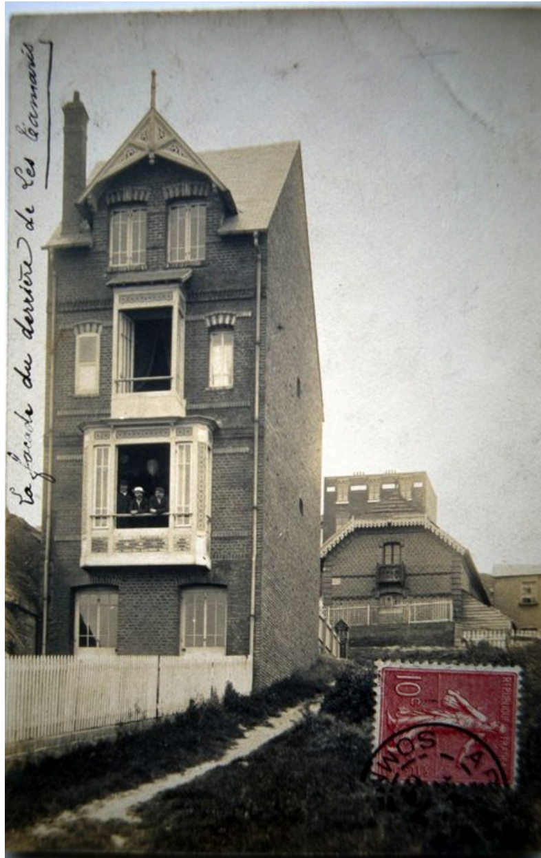
La façade sur mer, carte photo, 1er quart 20e siècle