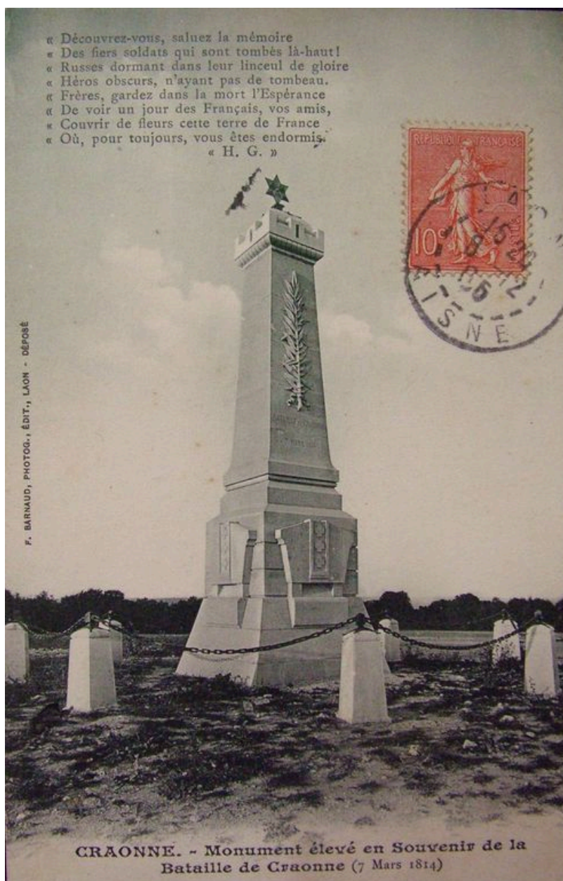
Vue du monument de la bataille de Craonne avant sa destruction.