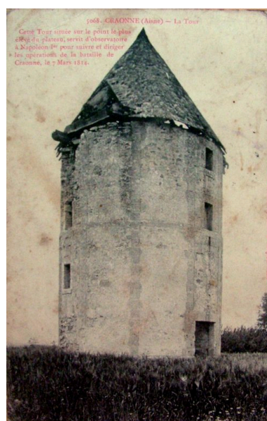
Vue de la tour de Craonne.