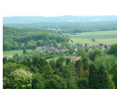
Vue actuelle de Craonne depuis le plateau de Californie. IVR22_20030202548NUCA