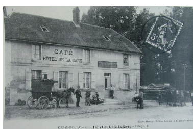
Vue ancienne de l'hôtel de la gare (coll. part). IVR22_20050200689NUCAB