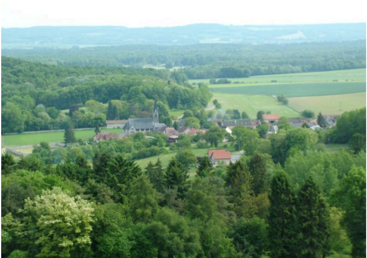
Vue actuelle de Craonne depuis le plateau de Californie.