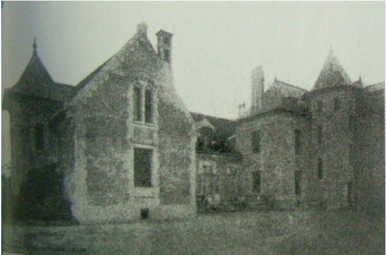
Vue du château avant la guerre (ECK, Francis, p. 121).