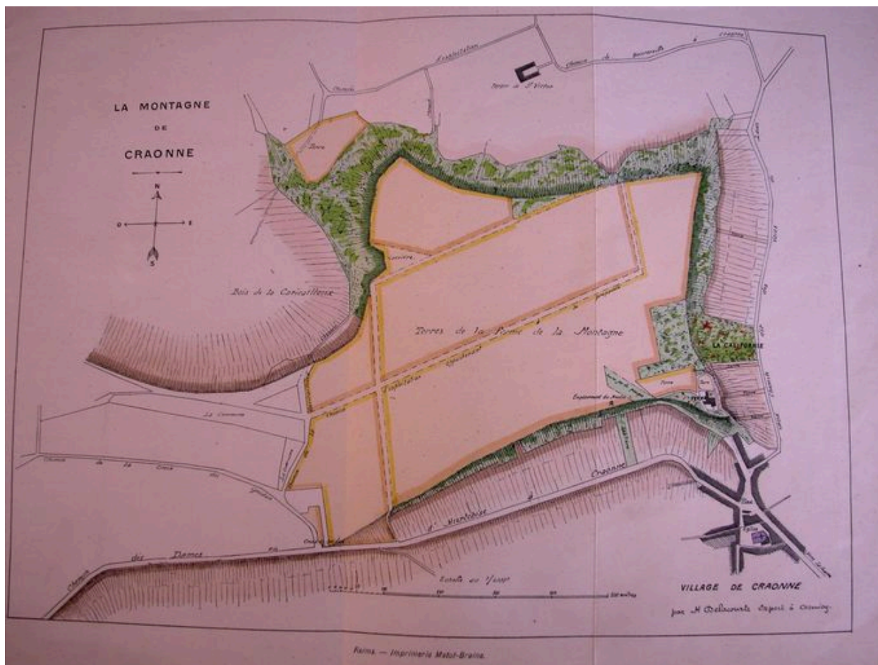
Plan de la ferme de la Montagne à Craonne (AD Aisne : 4° Br 51).