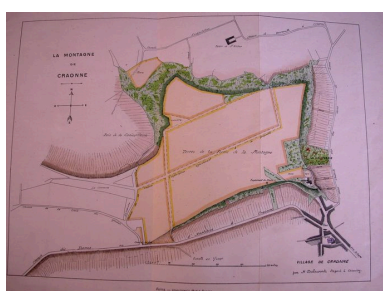
Plan de la ferme de la Montagne à Craonne (AD Aisne : 4° Br 51). IVR22_20030202574NUCAB