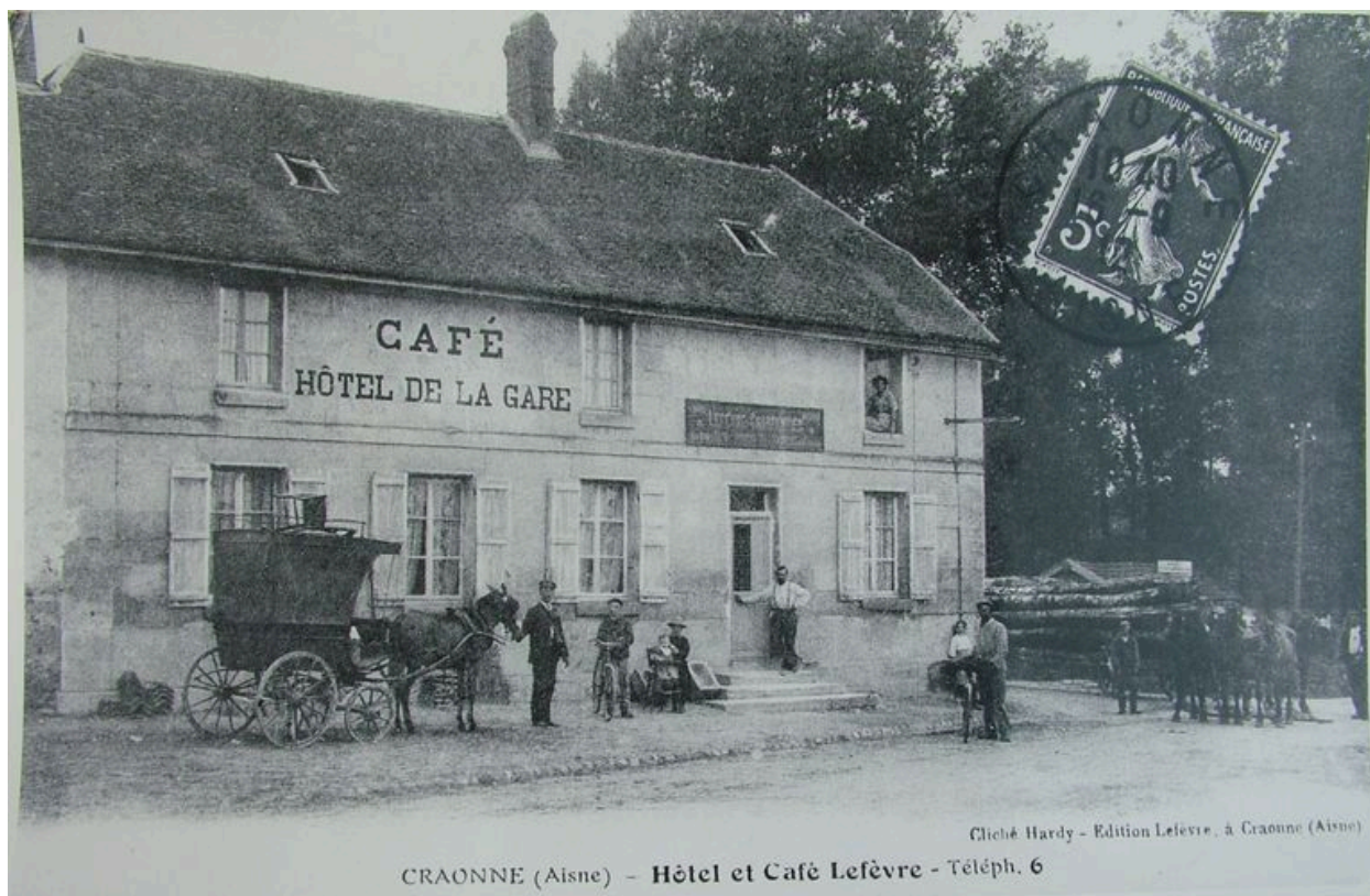
Vue ancienne de l'hôtel de la gare (coll. part).