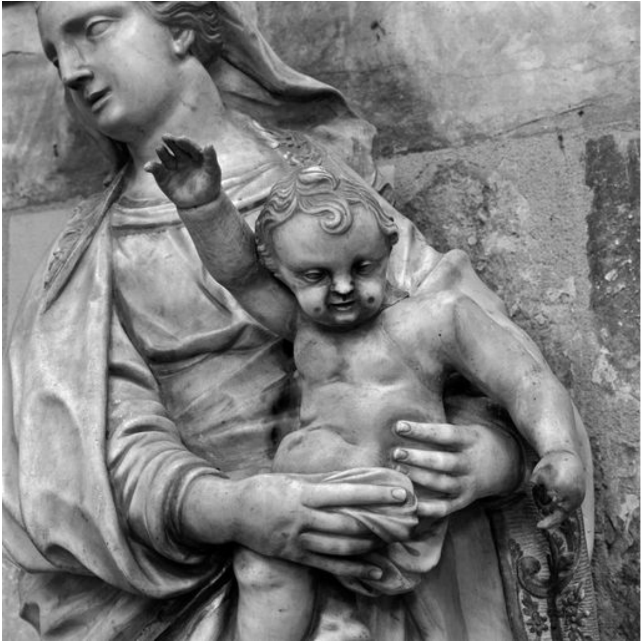
Vierge à l'Enfant : détail de l'Enfant.