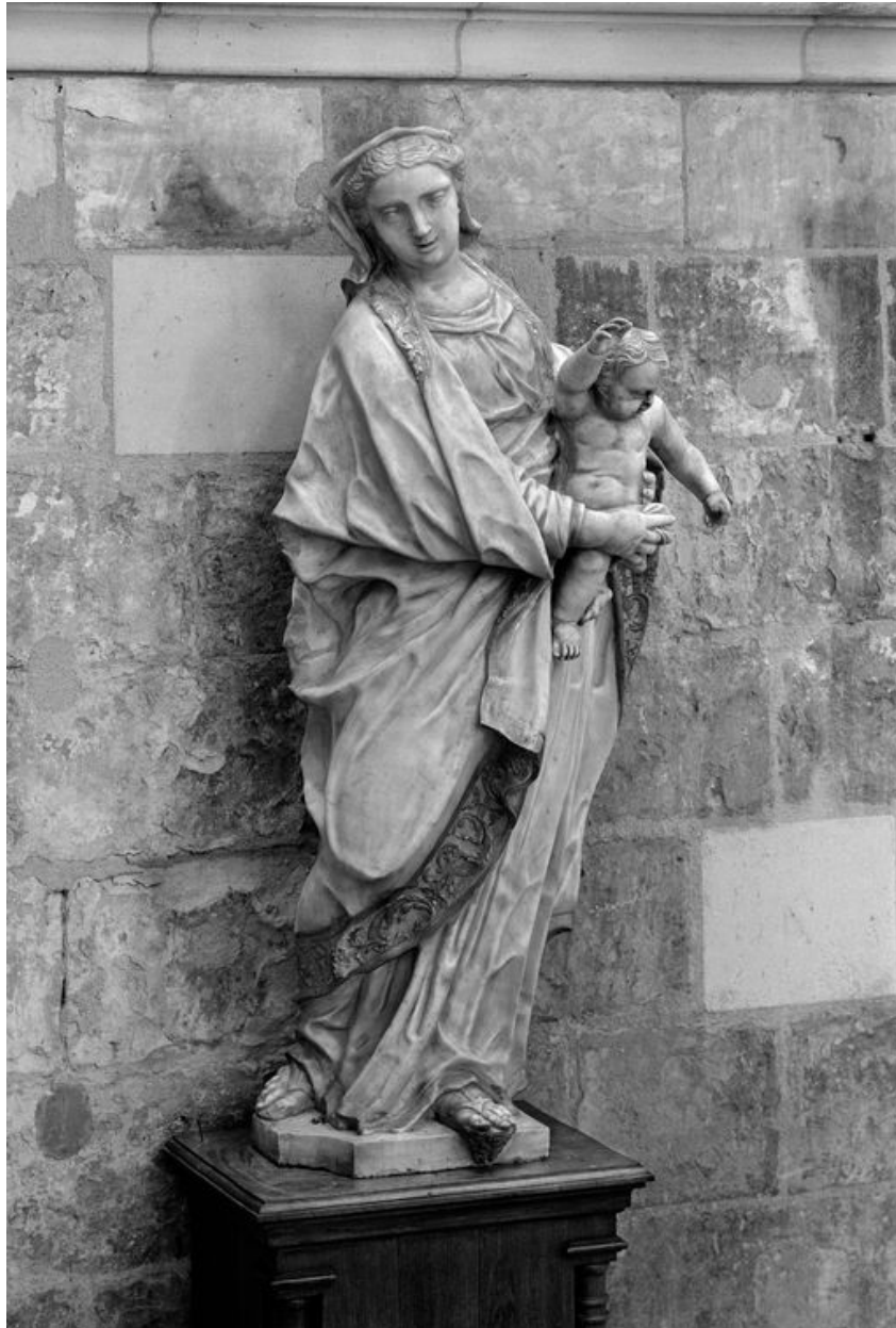
Vierge à l'Enfant : vue générale, de trois-quarts gauche.