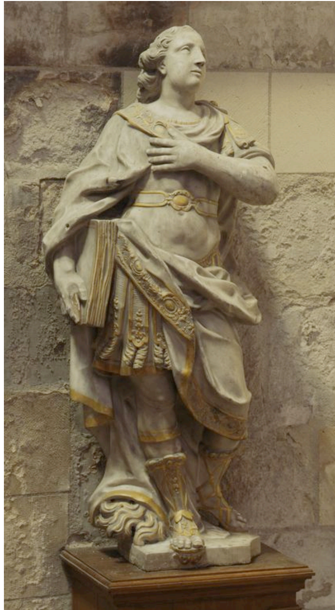
Saint Quentin : vue générale, de trois-quarts gauche.