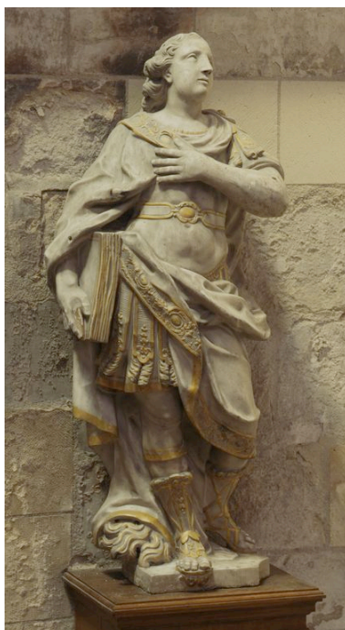
Saint-Quentin : vue générale, de trois-quarts gauche. IVR22_20010202046XA