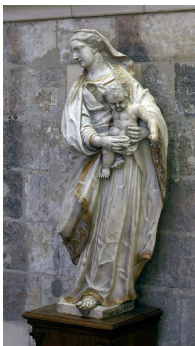
Vierge à l'Enfant : vue générale de trois-quarts droit. IVR22_20010202047XA