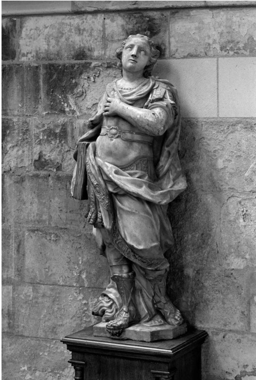
Saint Quentin : vue générale, de trois-quarts droit.