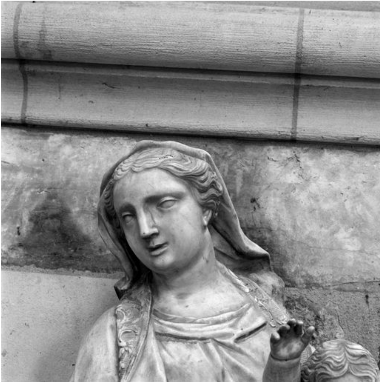
Vierge à l'Enfant : détail du visage de la Vierge.