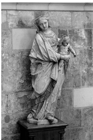
Vierge à l'Enfant : vue générale, de trois-quarts gauche. IVR22_20010201994X