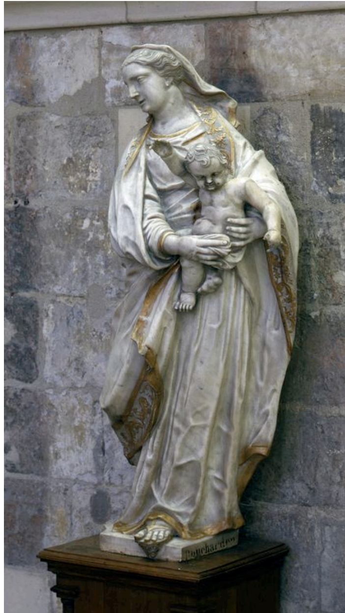
Vierge à l'Enfant : vue générale de trois-quarts droit.