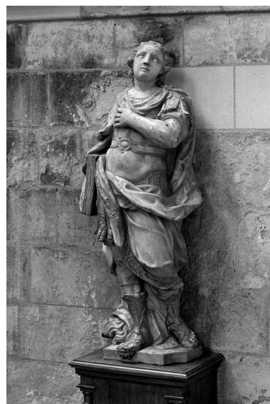
Saint-Quentin : vue générale, de trois-quarts droit. IVR22_20010201993X