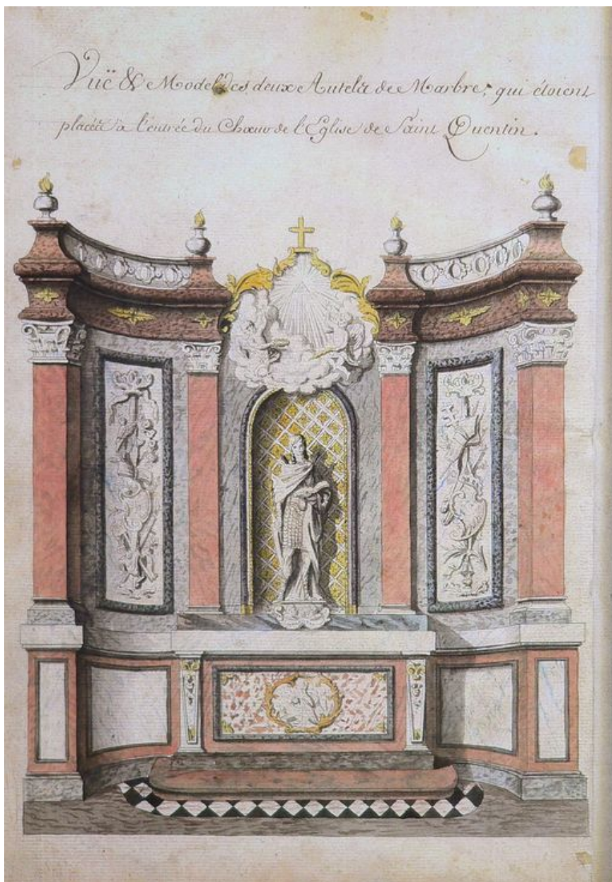
Dessin de l'autel de Saint-Quentin, avant la Révolution, par E. Pingret, 1804 (In : Vuës Extérieures et intérieures de l'Eglise de Saint Quentin [...], folio 34 verso).