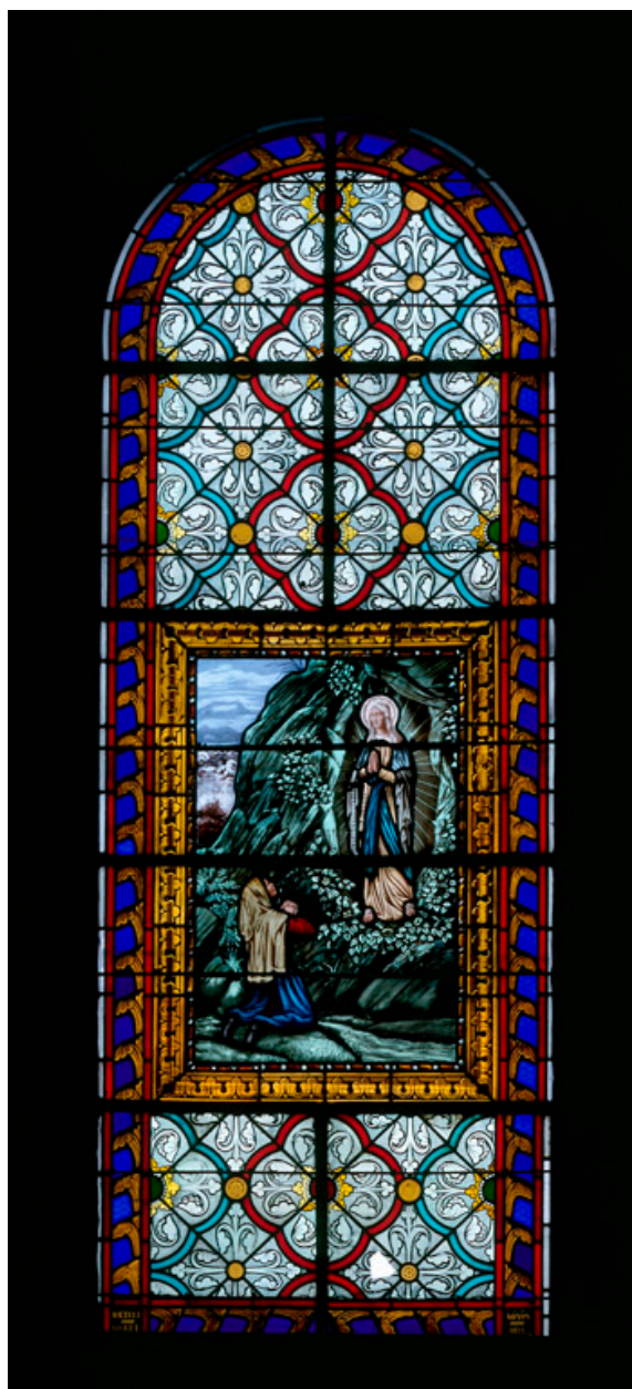
Baie 7 : Apparition de la Vierge à sainte Bernadette.