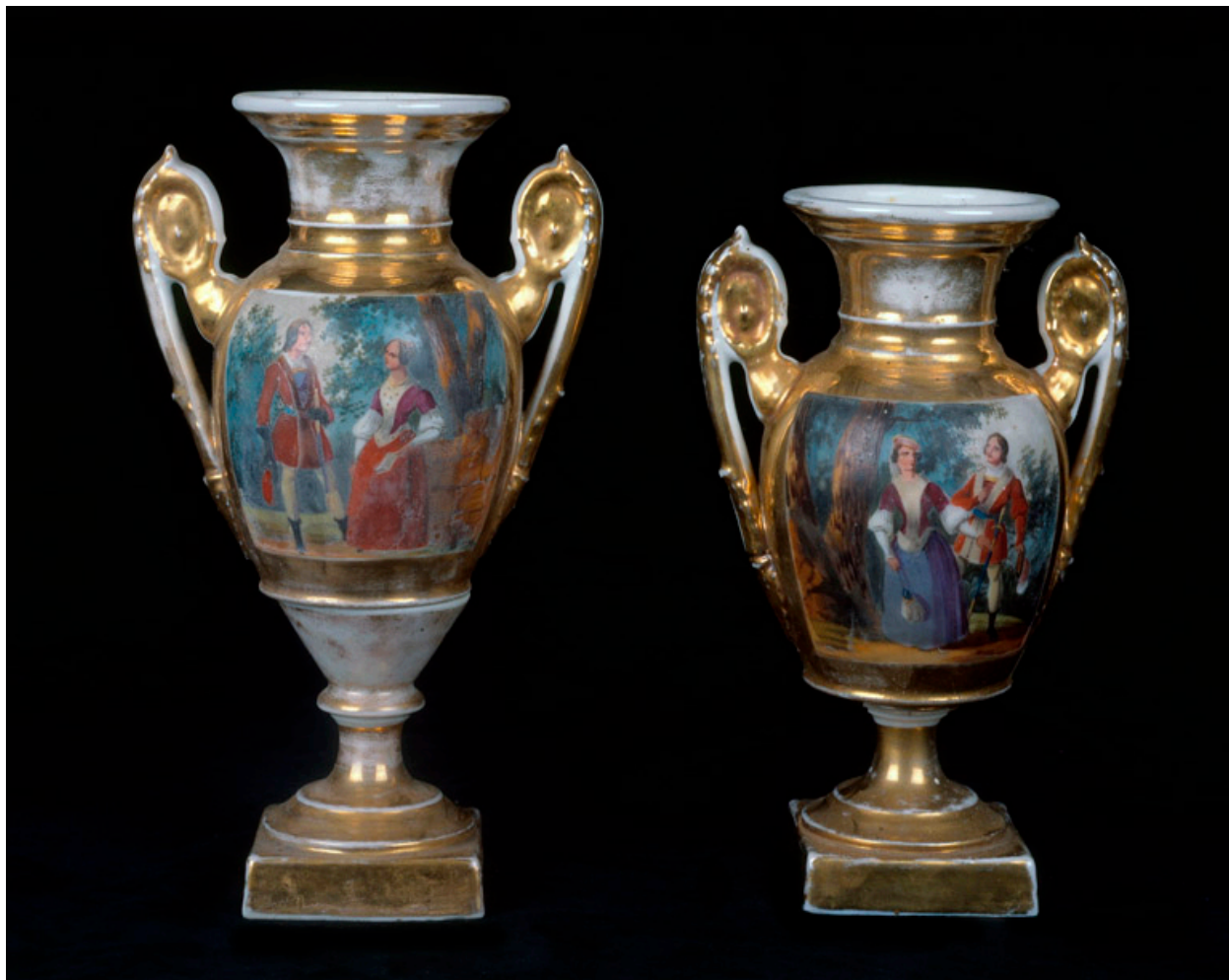
Paire de vases imitant la porcelaine de Sèvres.