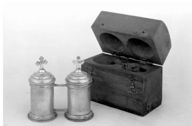
Ampoules aux saintes huiles, Berger-Nesme.