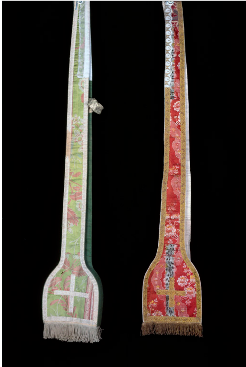
Deux étoles pastorales à motifs de fleurs brochés.