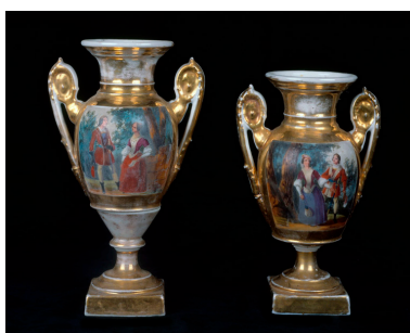
Paire de vases imitant la porcelaine de Sèvres. IVR22_19998000764XA