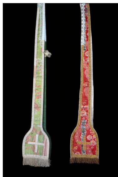
Deux étoles pastorales à motifs de fleurs brochés.