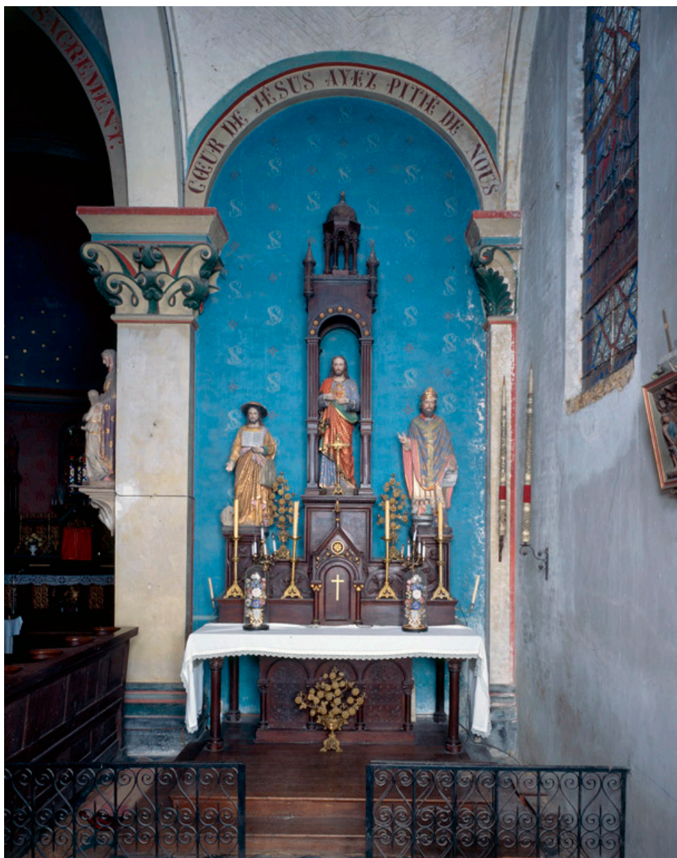
Autel secondaire de la chapelle sud.