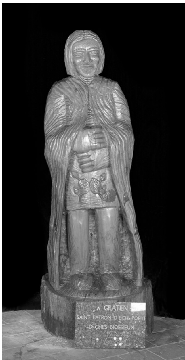
Statue de saint Gratien, par Jean-Pierre Facquier, 1993.