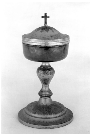
Ciboire. IVR22_19998000717X