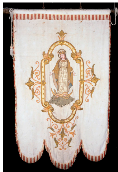
Bannière de procession : Immaculée Conception. IVR22_19998000867XA