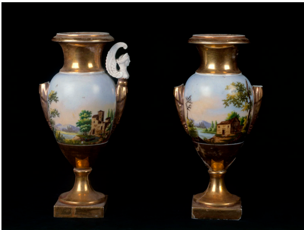
Paire de vases imitant la porcelaine de Sèvres.