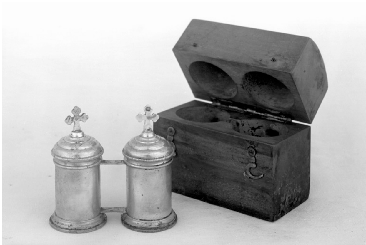
Ampoules aux saintes huiles, Berger-Nesme.