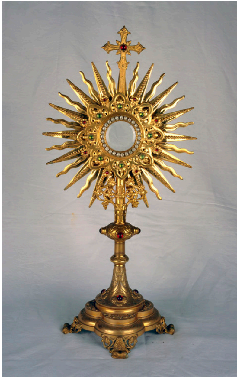
Grand ostensorio, par Jean-Marie Pernolet.