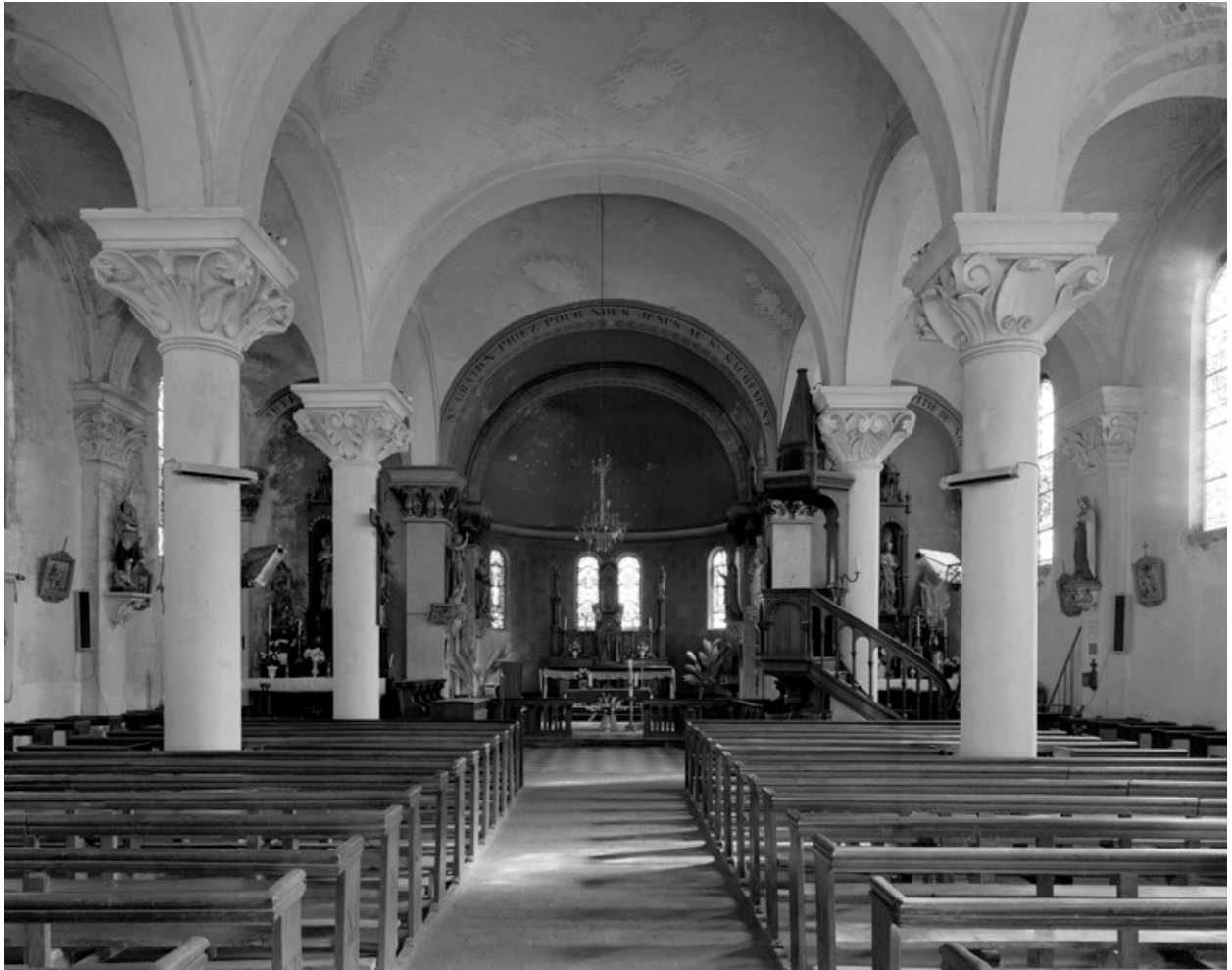
Vue intérieure, vers le chœur.