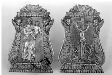
Paire de baisers de paix en cuivre argenté représentant la Vierge et le Christ en croix. IVR22_19998000716X