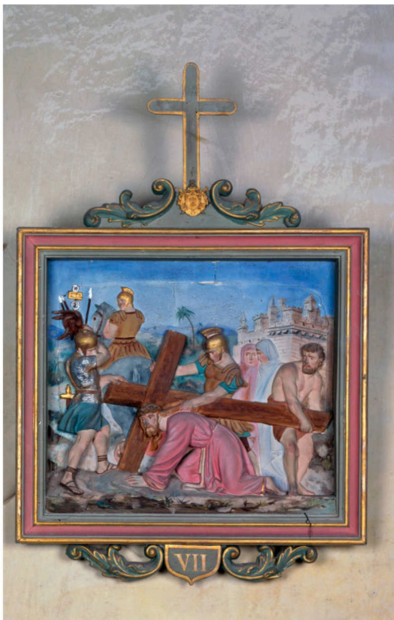
Station VII du chemin de croix.