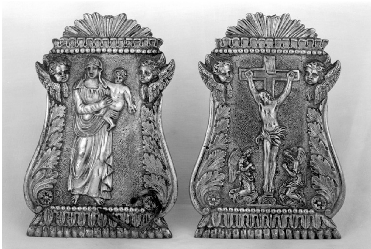
Paire de baisers de paix en cuivre argenté représentant la Vierge et le Christ en croix.