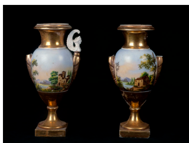
Paire de vases imitant la porcelaine de Sèvres. IVR22_19998000765XA