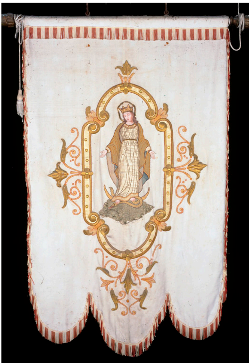
Bannière de procession : Immaculée Conception.