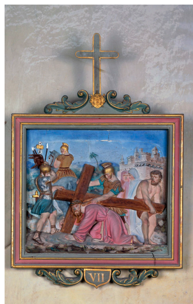
Station VII du chemin de croix.