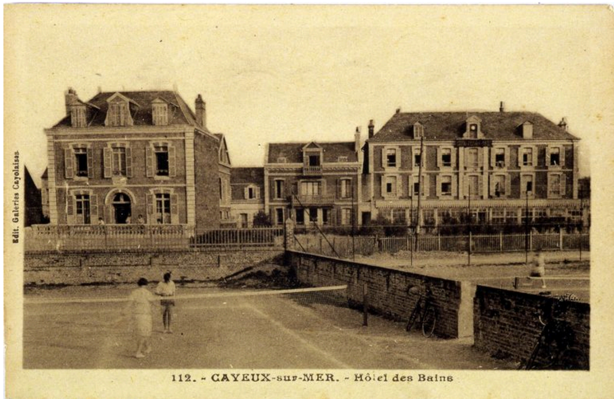
Villa Boyard, à gauche, carte postale, 1er quart 20e siècle (coll. part.).