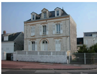
Vue d'ensemble. IVR22_20058003106NUCA