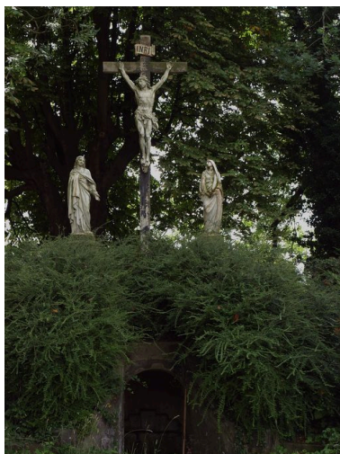
Le calvaire et l'entrée de l'oratoire.