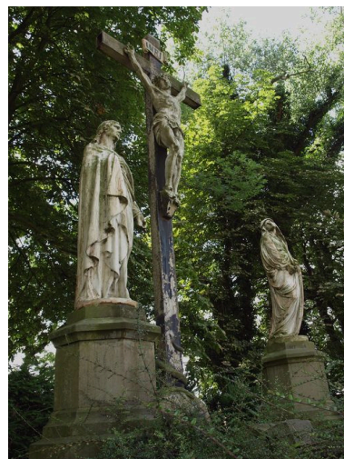
Vue du calvaire.