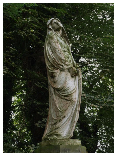
Statue représentant la Vierge. IVR31_20106204025NUCA