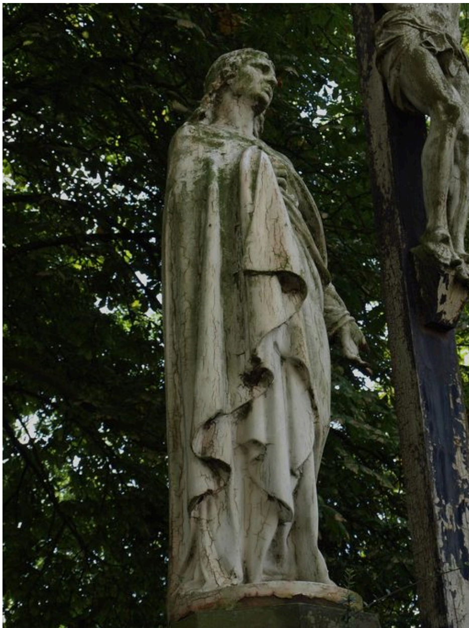
Statue représentant saint Jean.