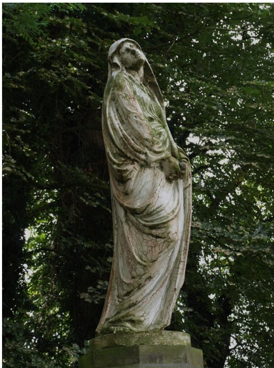
Statue représentant la Vierge.