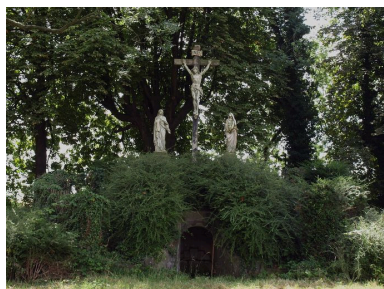
Vue générale. IVR31_20106204020NUCA