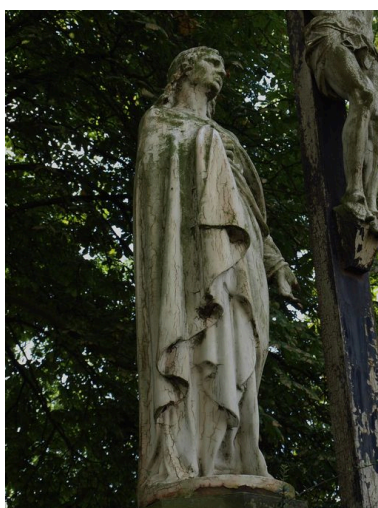
Statue représentant saint Jean.