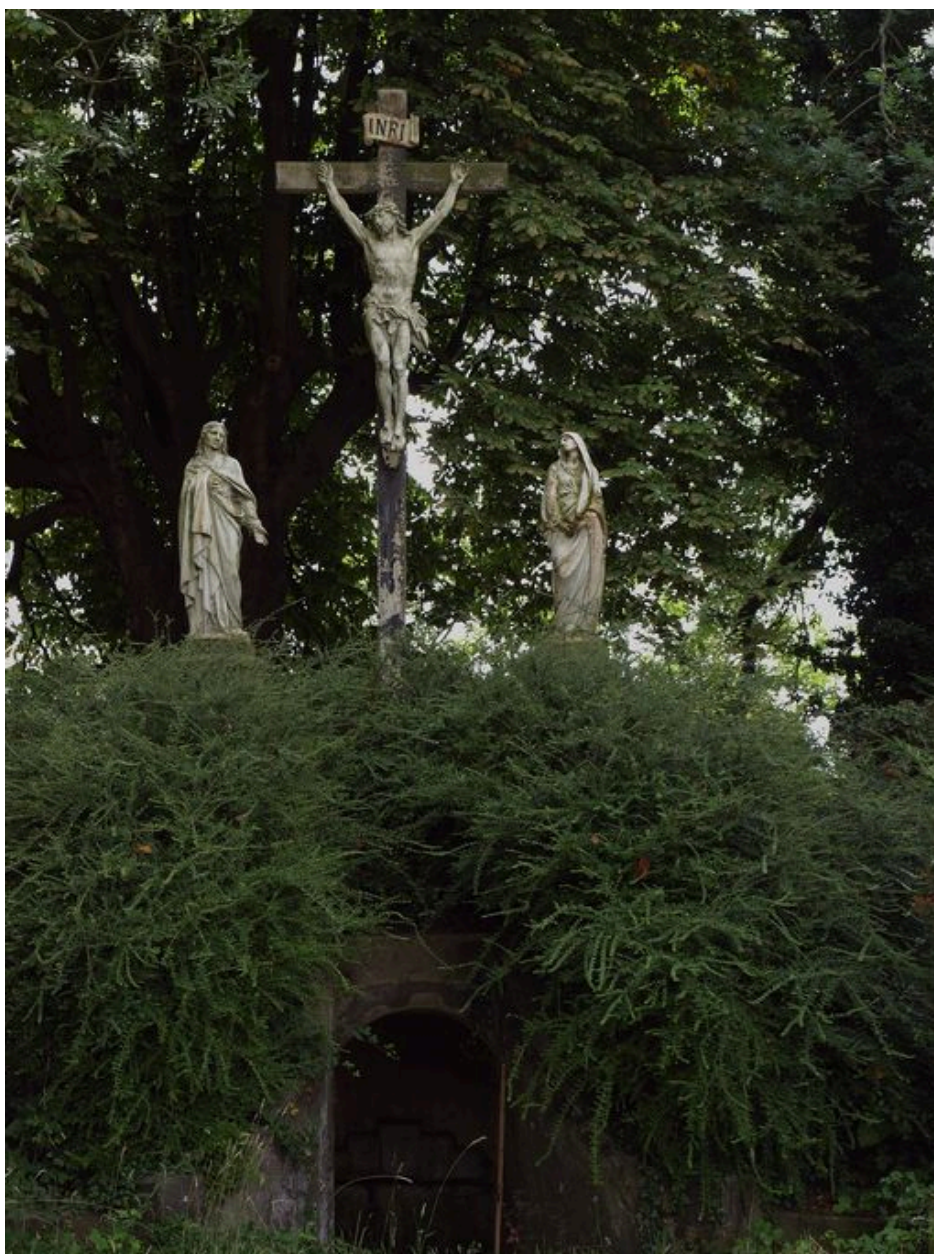
Le calvaire et l'entrée de l'oratoire.