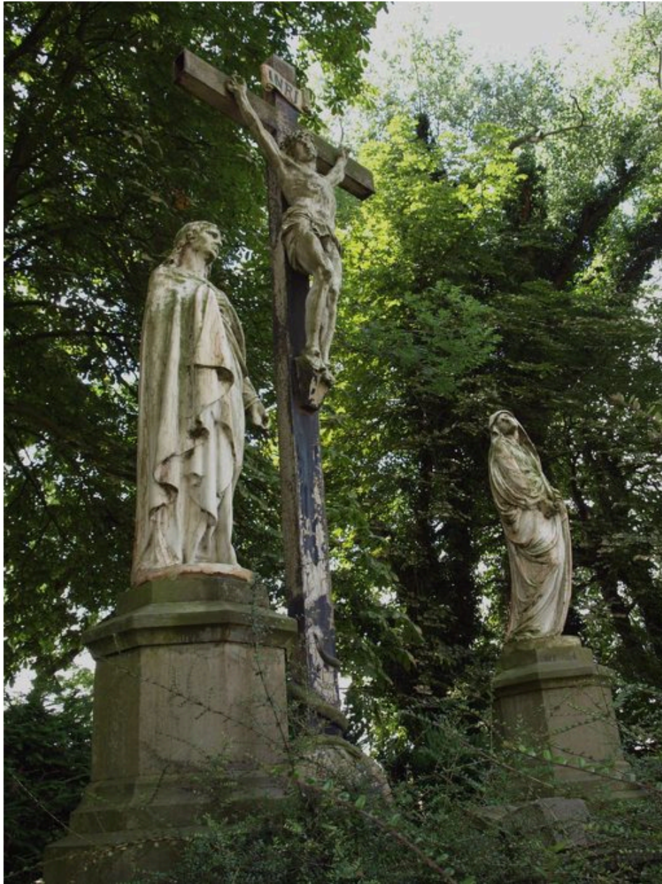
Vue du calvaire.