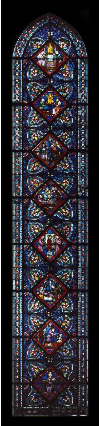
Vue générale de la verrière. IVR22_20010202917XA