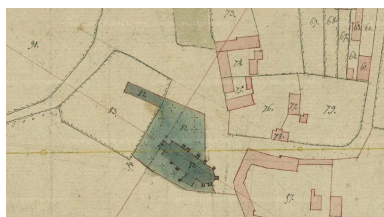
Extrait du cadastre napoléonien (AD Somme ; 3P 1512/3).

Phot. Archives départementales de la Somme IVR22_20158006614NUCA