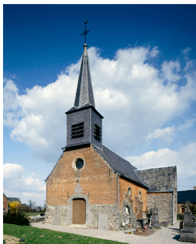
Vue générale depuis le sud-ouest. IVR22_19930200400VA