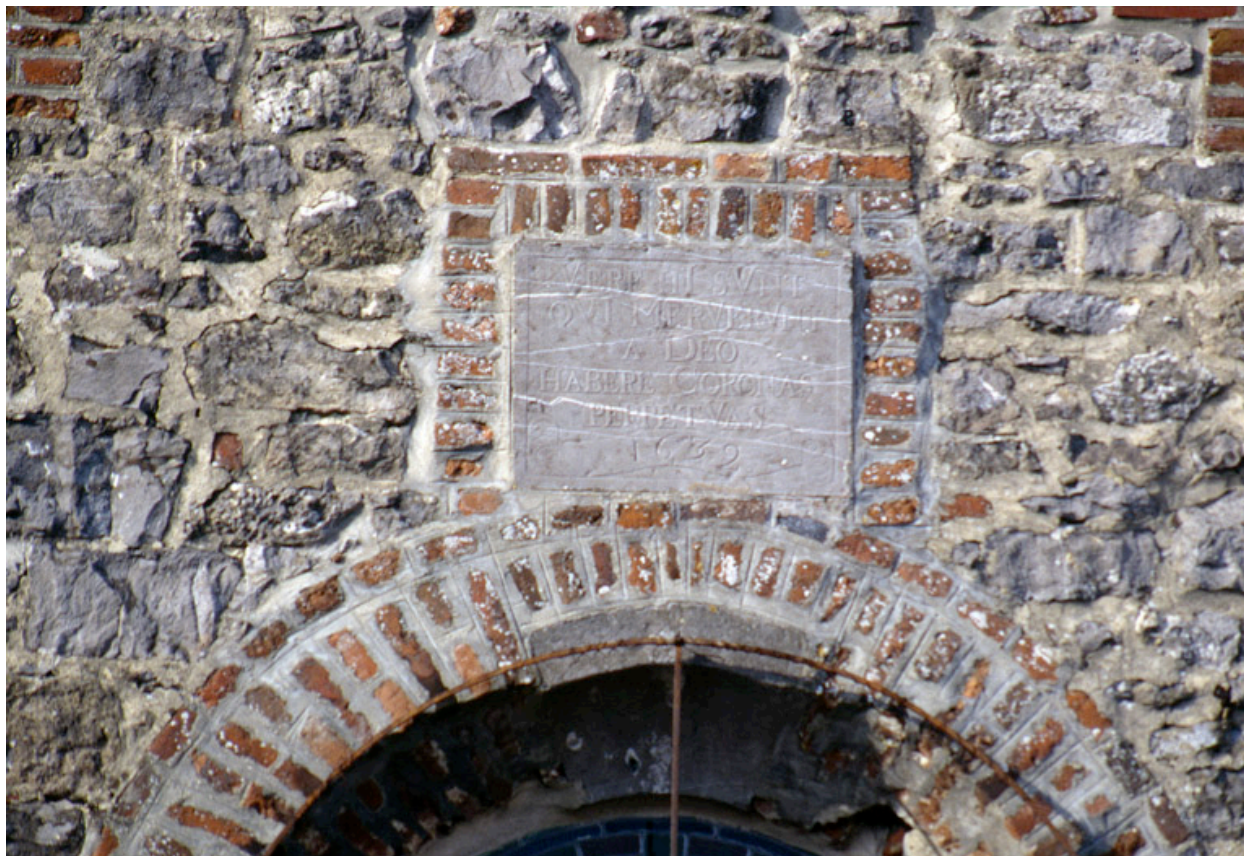
Pierre insérée dans l'élévation sud du bras sud du transept portant un chronogramme de 1632.