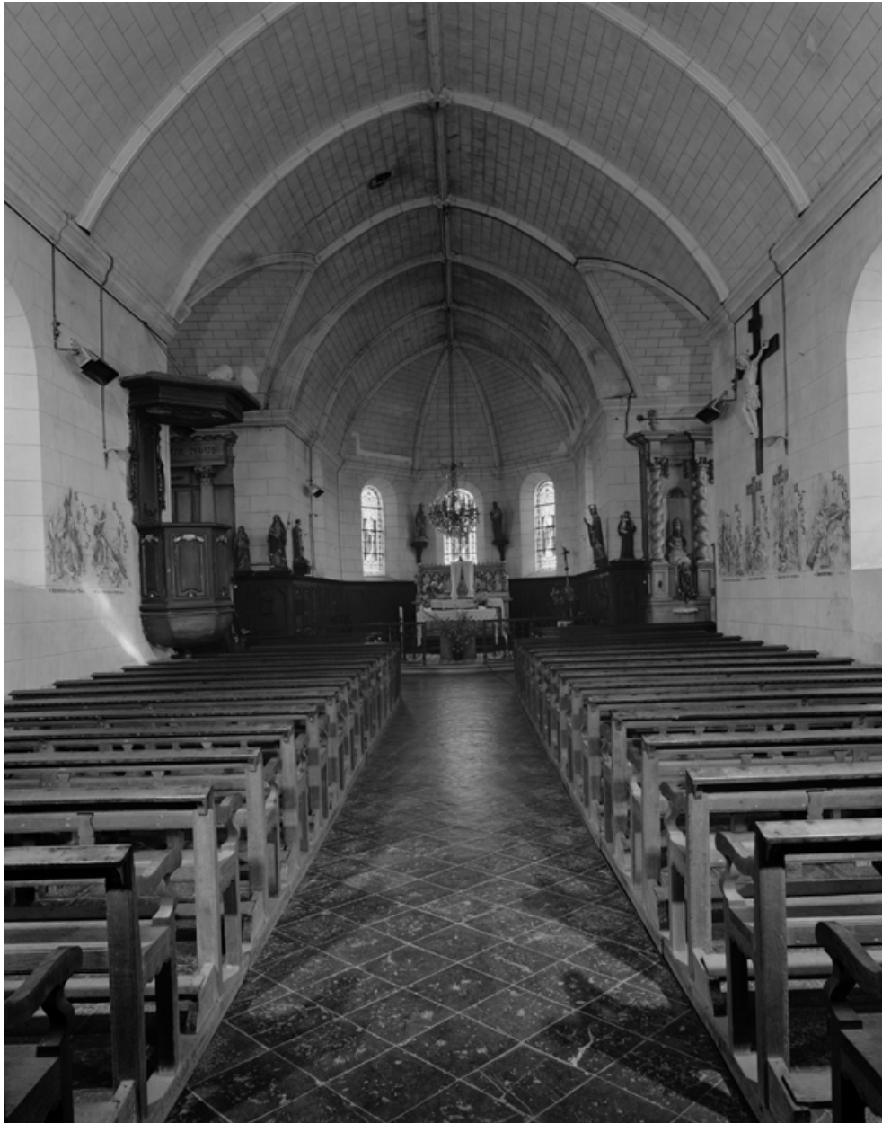
Vue intérieure, vers le chœur.