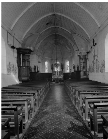
Vue intérieure, vers le chœur. IVR22_19930200303V