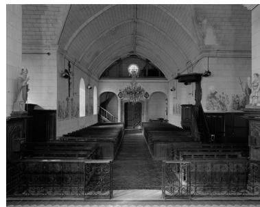
Vue intérieure, vers l'entrée. IVR22_19930200302V