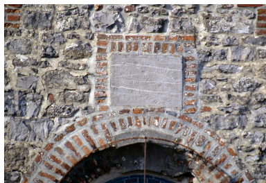
Pierre insérée dans l'élévation sud du bras sud du transept portant un chronogramme de 1632.