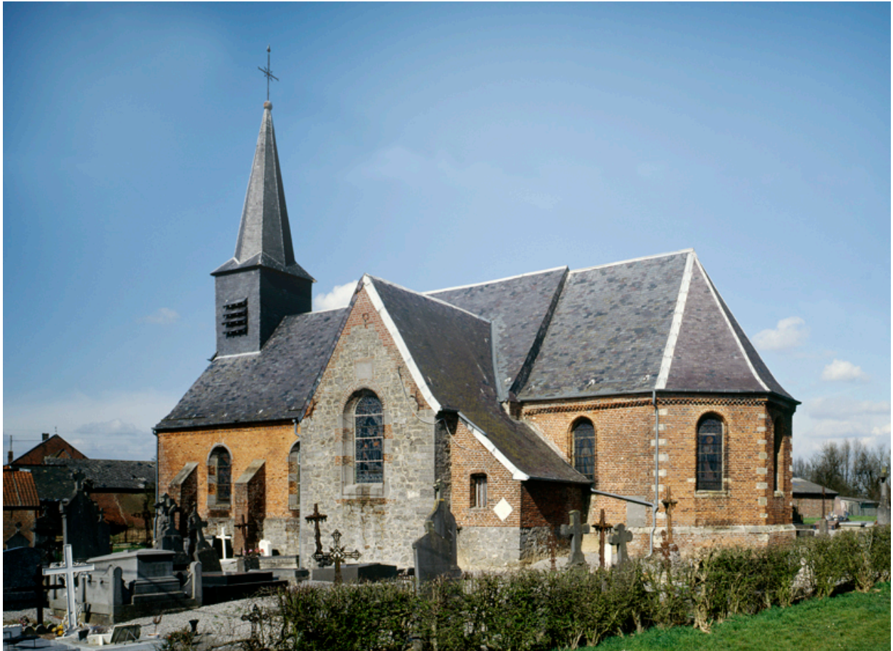
Vue générale, depuis le sud-est.