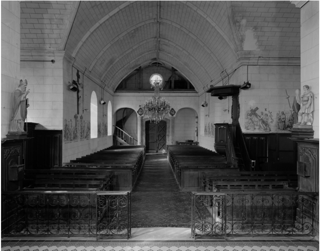
Vue intérieure, vers l'entrée.