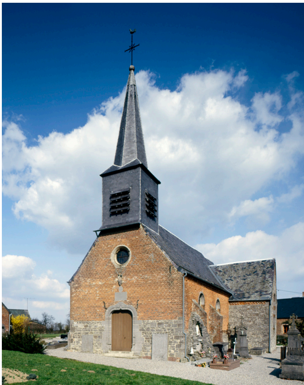
Vue générale depuis le sud-ouest.