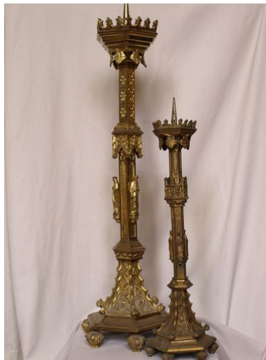
Le grand chandelier vient du maître-autel, le plus petit de la sacristie