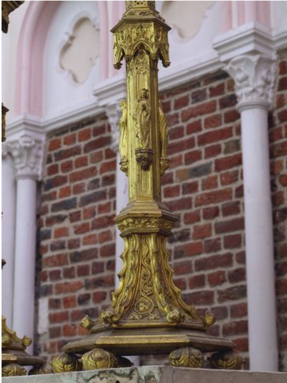
Détail d'un pied