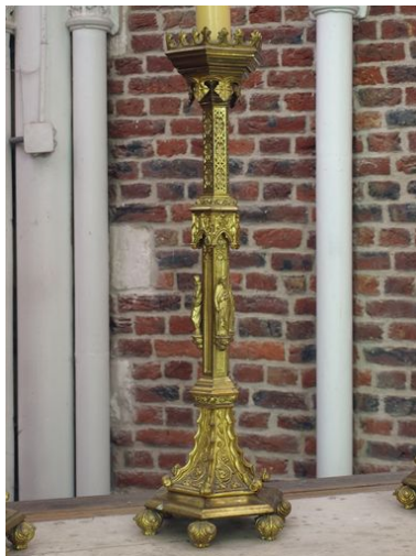
Vue générale d'un des chandeliers IVR31_20106202669NUCA