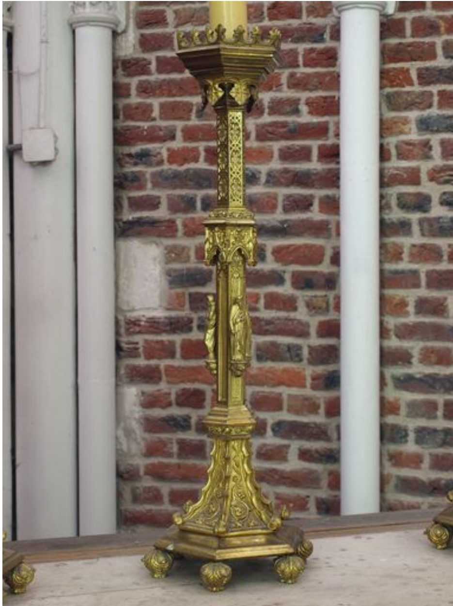
Vue générale d'un des chandeliers