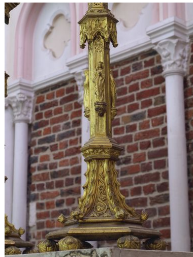
Détail d'un pied