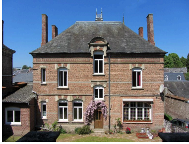
Façade postérieure sur cour, vue d'ensemble. IVR22_20138015648NUC2A