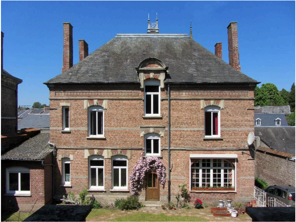
Façade postérieure sur cour, vue d'ensemble.