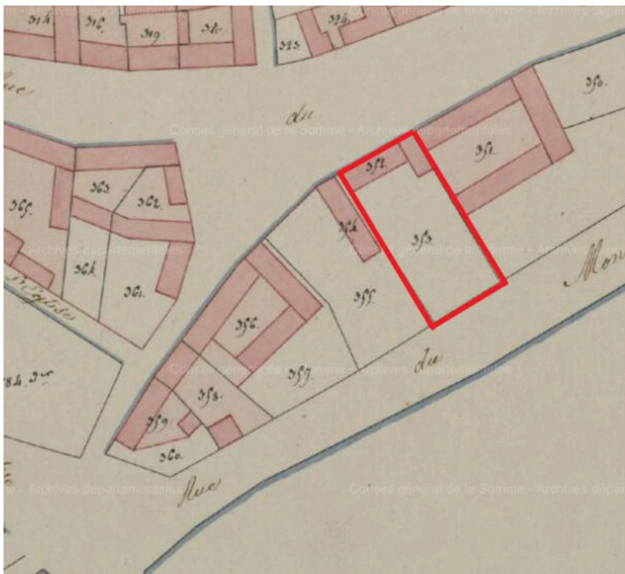
Détail du plan cadastral de la commune de Beauval, dit plan napoléonien. Sections II et A2. 1811 (AD Somme ; 3 P 1177)