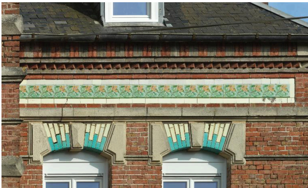
Détail de la frise à motifs floraux en carreaux vernissés au sommet de la façade sur cour.