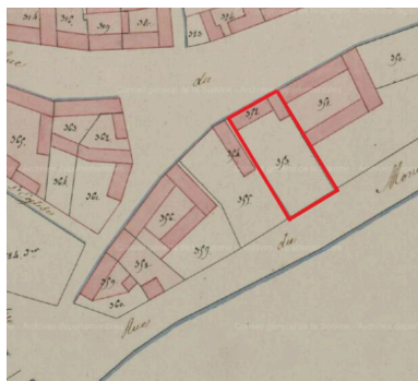
Détail du plan cadastral de la commune de Beauval, dit plan napoléonien. Sections II et A2. 1811 (AD Somme ; 3 P 1177)

Phot. Archives départementales de la Somme IVR22_20148005084NUCA