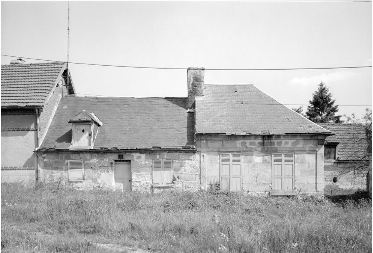
Logis. Elévation antérieure.