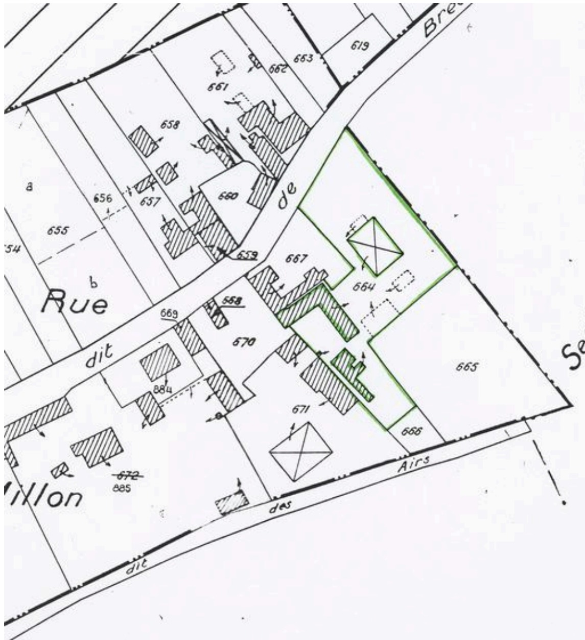
Plan de situation. Extrait du plan cadastral de 1970, section A2 664.