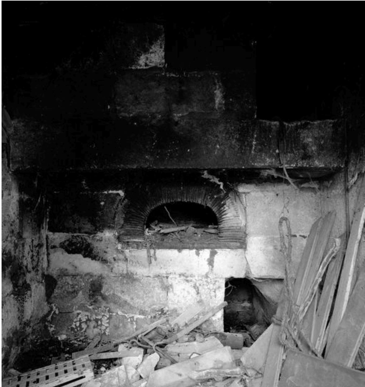
Four à pain.