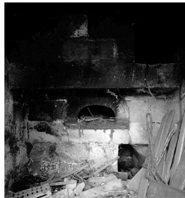
Four à pain. IVR22_19856000840V