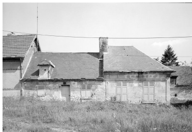
Logis. Elévation antérieure. IVR22_19856000895X