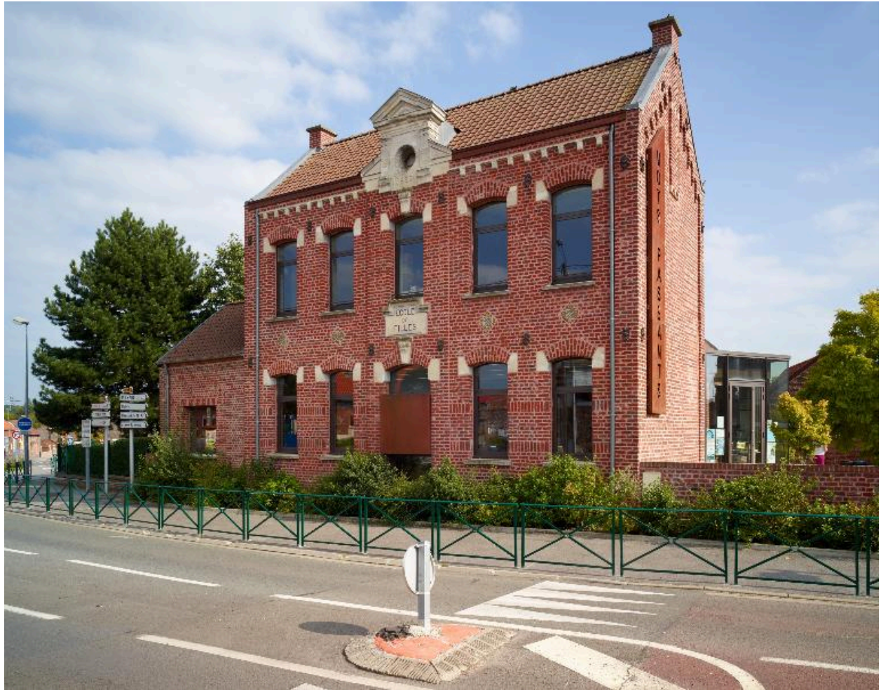
Vue générale de trois quarts.