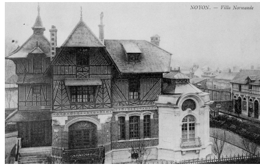
Elévation antérieure, avant 1914 (AP). IVR22_19856000542XB