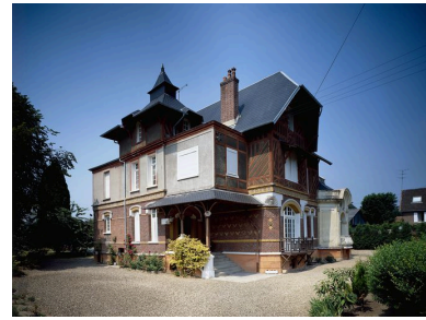
Elévation antérieure.