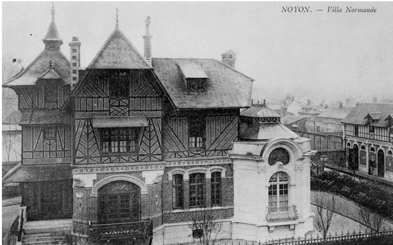
Elévation antérieure, avant 1914.