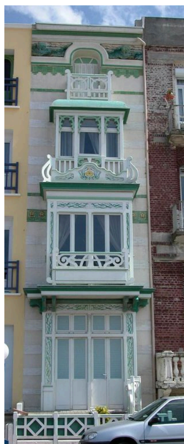
Maison dite Opaline, vue depuis l'esplanade. IVR22_20038005280NUCA