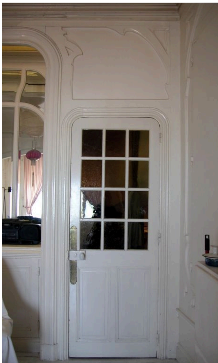
Détail du décor intérieur de la villa Opaline. Porte menant des pièces de réception aux étages.