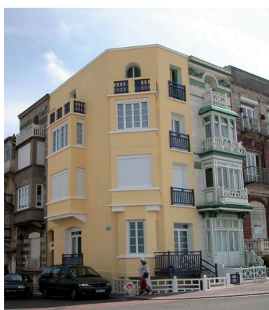
Vue d'ensemble depuis l'esplanade.