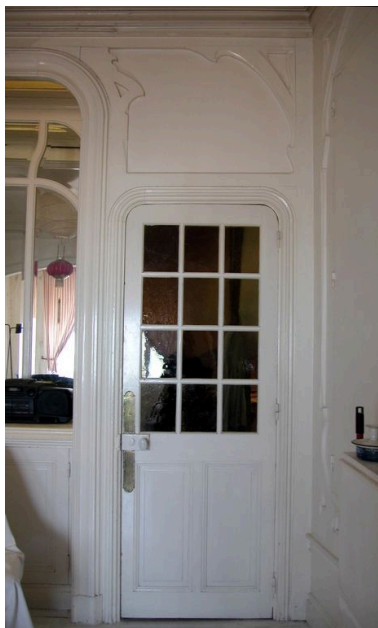
Détail du décor intérieur de la villa Opaline. Porte menant des pièces de réception aux étages. IVR22_20048001433NUCA