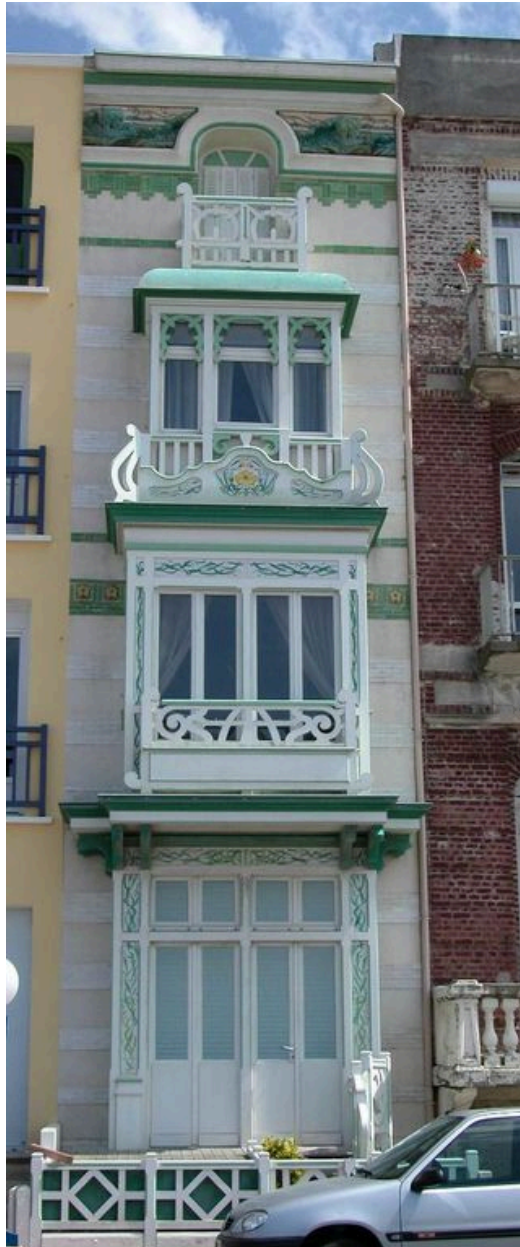
Maison dite Opaline, vue depuis l'esplanade.