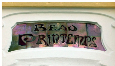
Détail de la plaque de céramique portant appellation. IVR22_20038005270NUCA