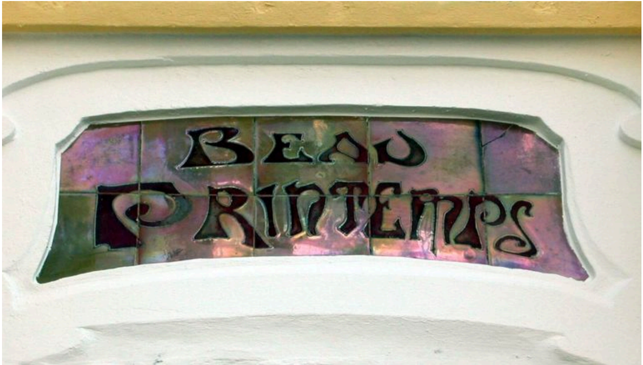
Détail de la plaque de céramique portant appellation.