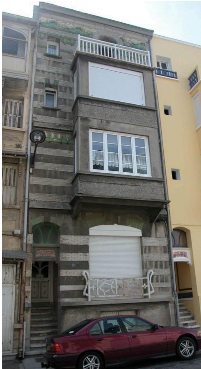
Vue de la maison Automne Dorée, depuis la rue Duquesne.