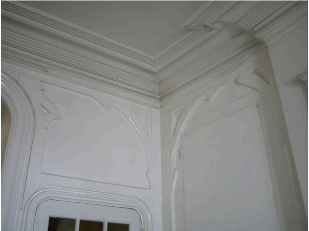
Détail du décor intérieur de la pièce de réception de la maison dite Opaline.