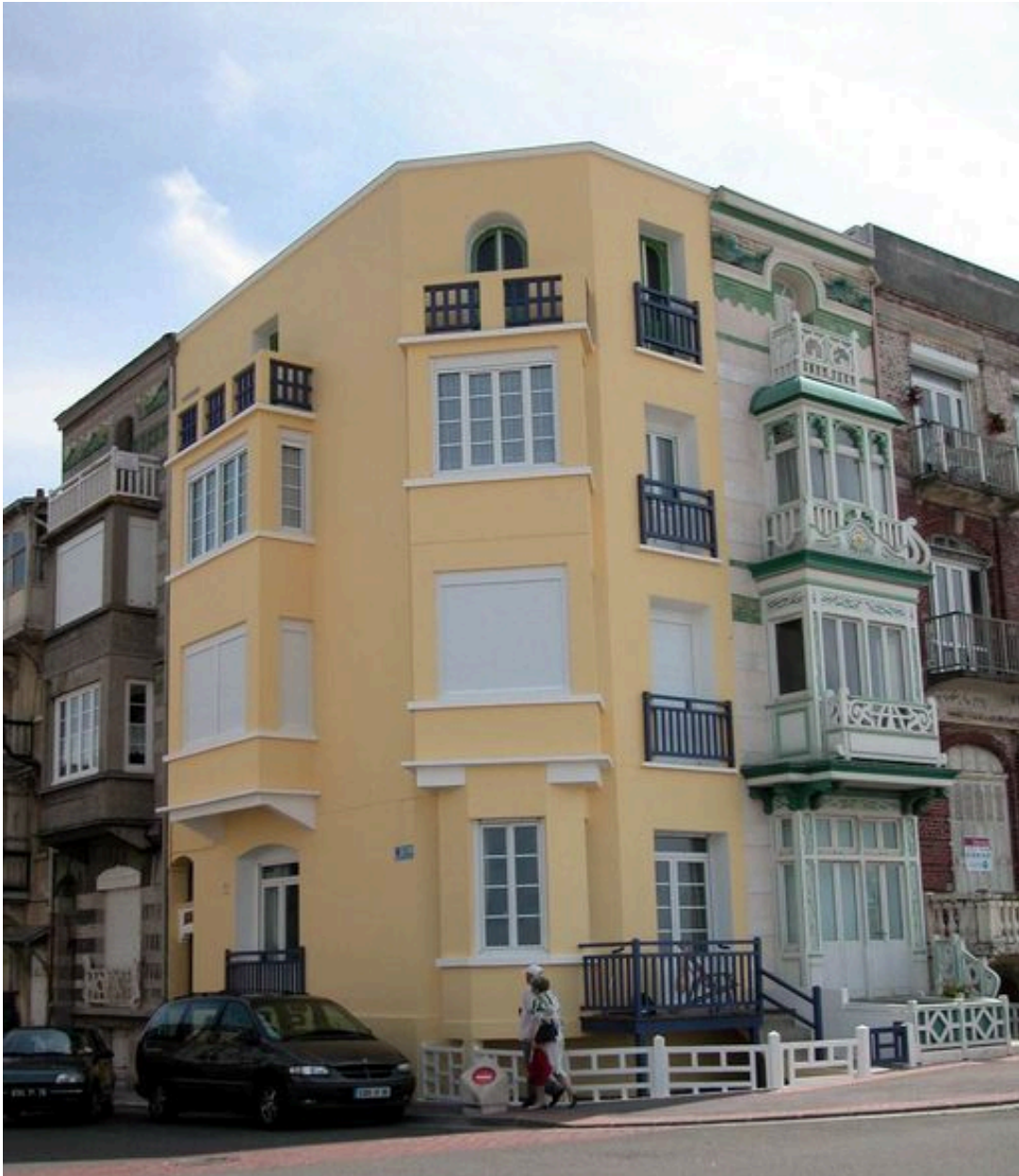
Vue d'ensemble depuis l'esplanade.