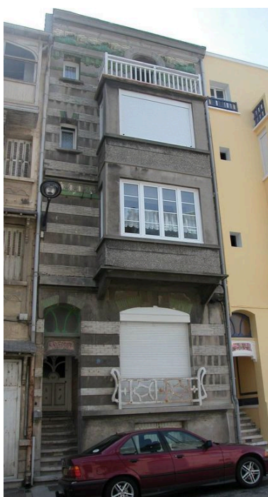
Vue de la maison Automne Dorée, depuis la rue Duquesne.