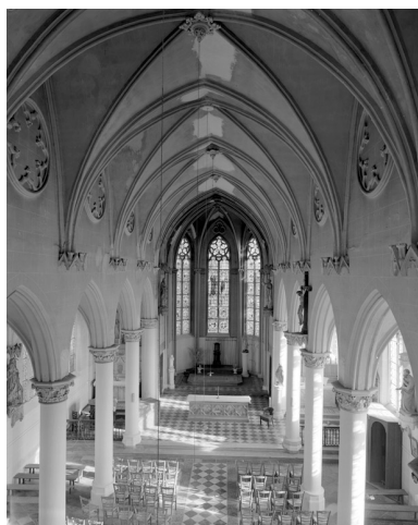
Vue intérieure, depuis la tribune. IVR22_19978000921V