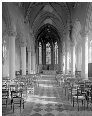
Vue intérieure, vers le chœur. IVR22_19978000922V