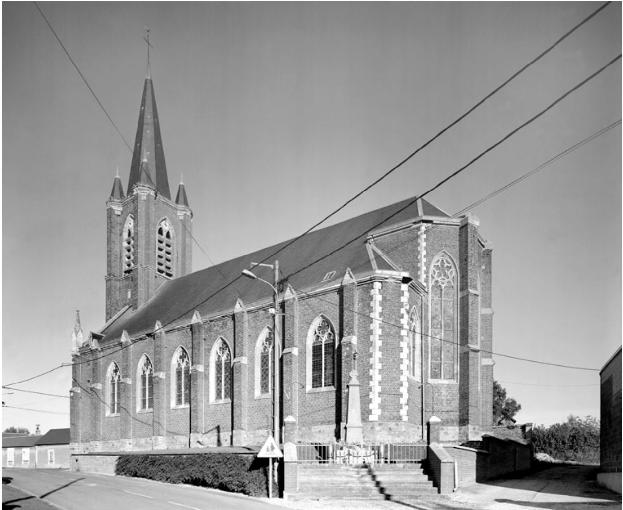
Vue depuis le sud-est.