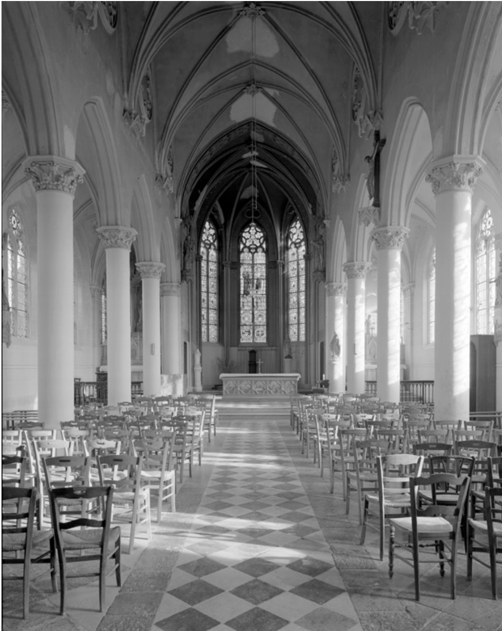
Vue intérieure, vers le chœur.