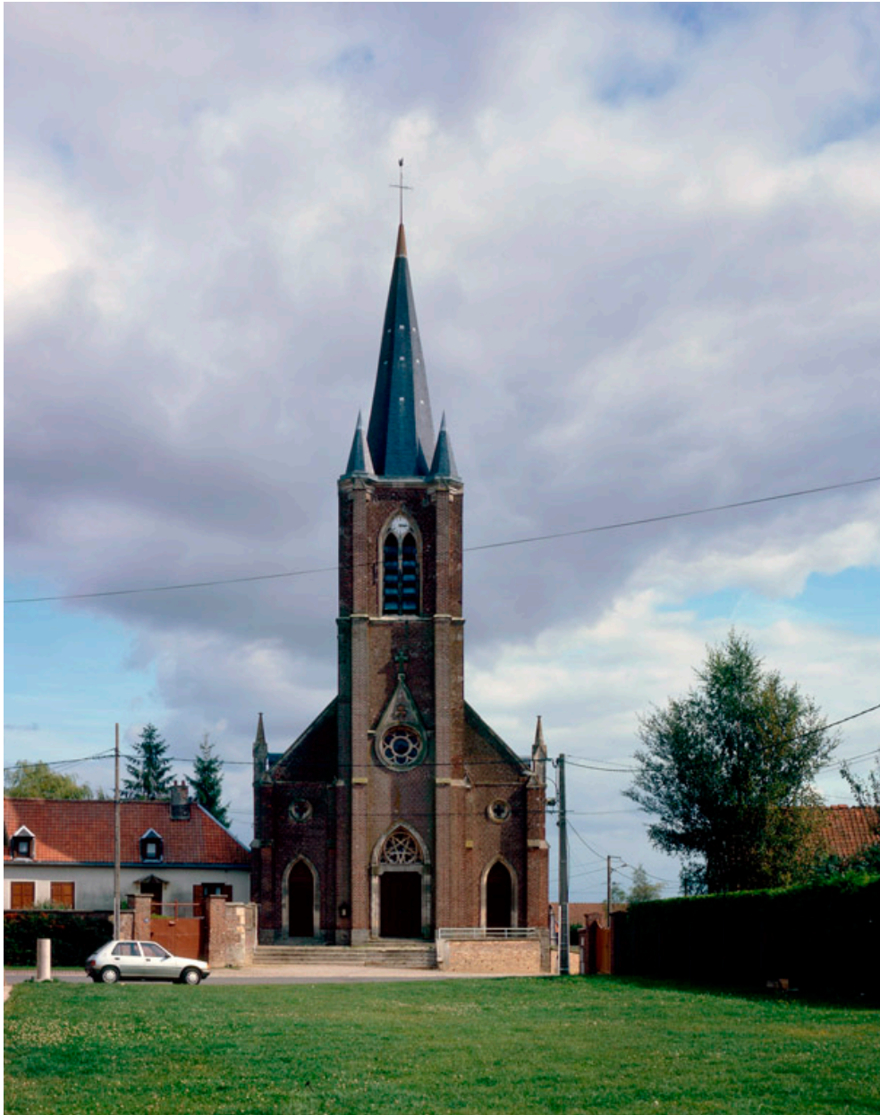
Vue de la façade occidentale.