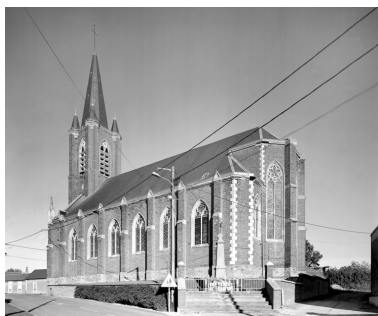
Vue depuis le sud-est. IVR22_19978000919V