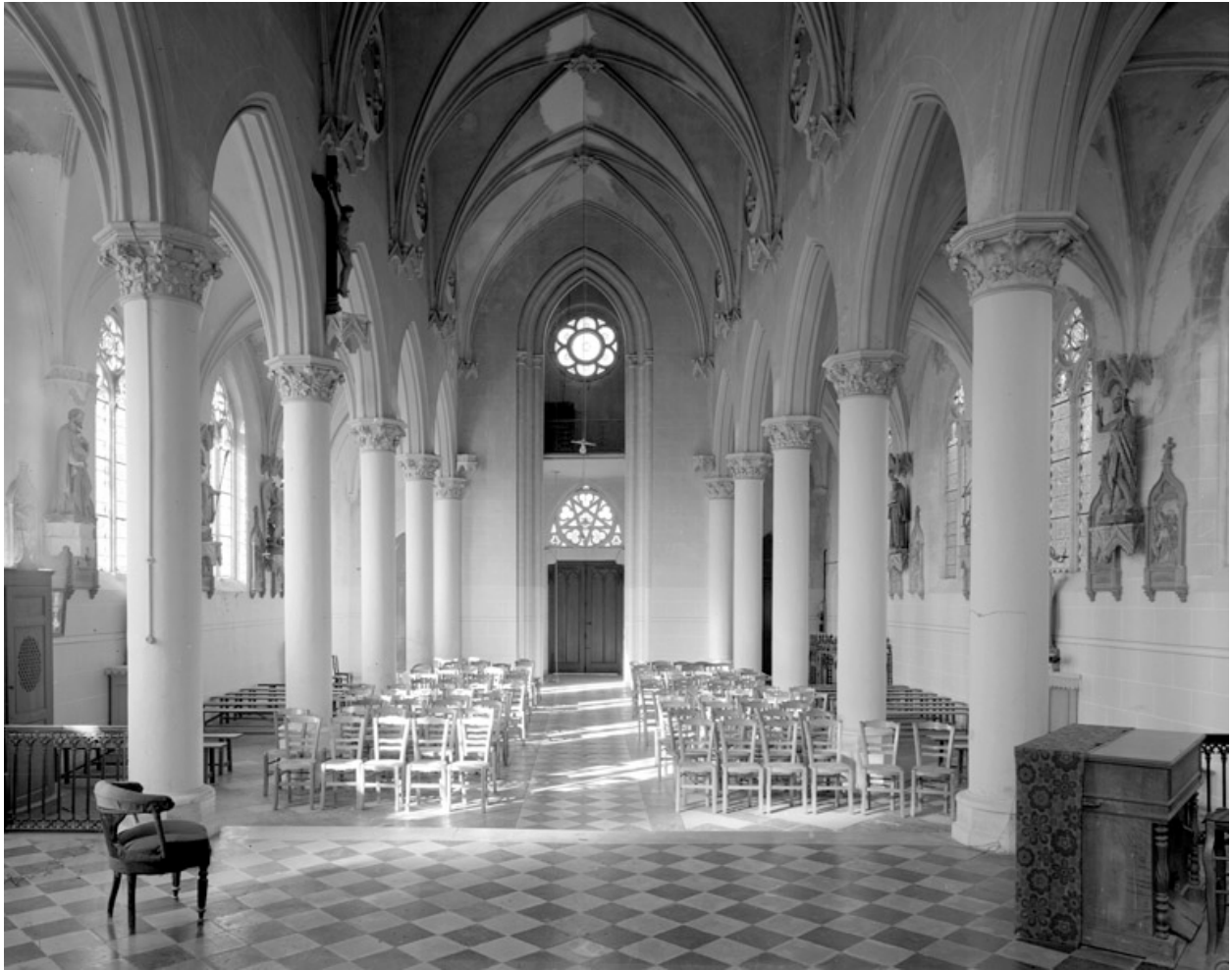
Vue intérieure, depuis le chœur.