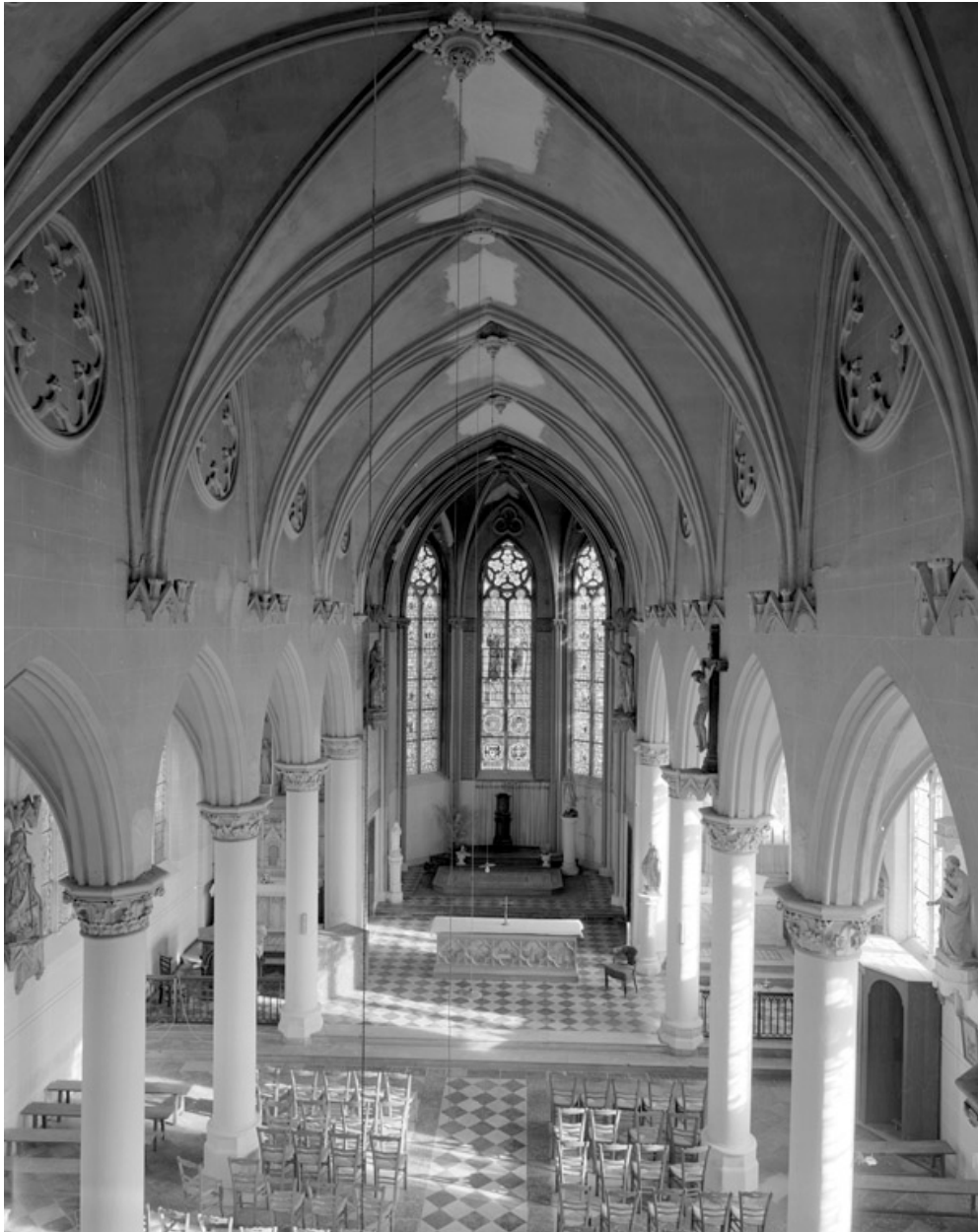
Vue intérieure, depuis la tribune.