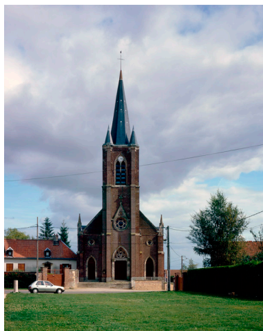
Vue de la façade occidentale. IVR22_20008000652VA