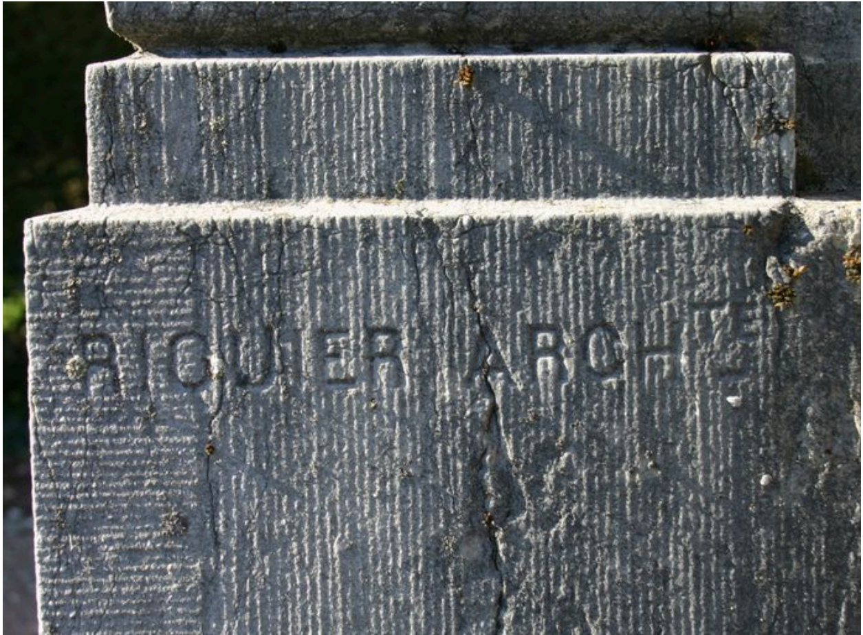
Monument au mort : vue de détail sur la signature de l'architecte Emile Riquier.