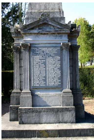
Monument aux morts : vue d'une des faces de la base.