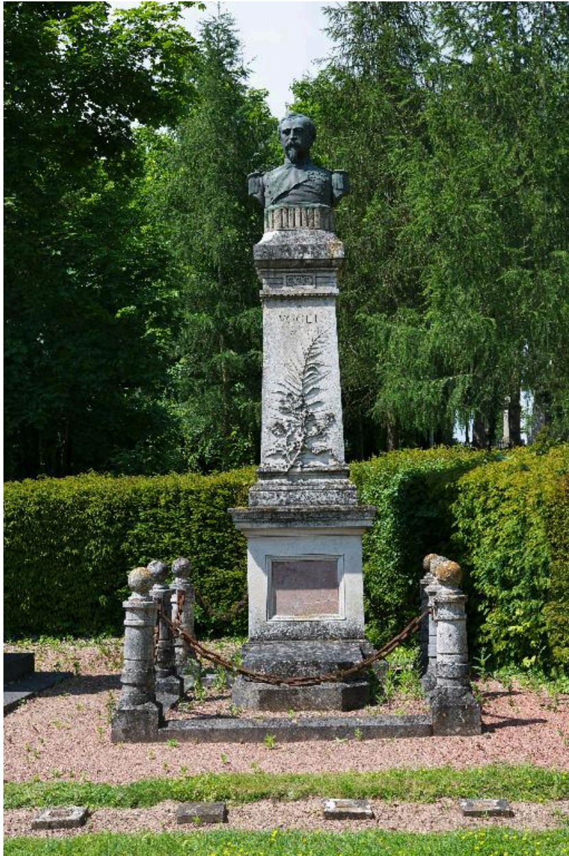
Le monument sépulcral du commandant Vogel. Vue de face.