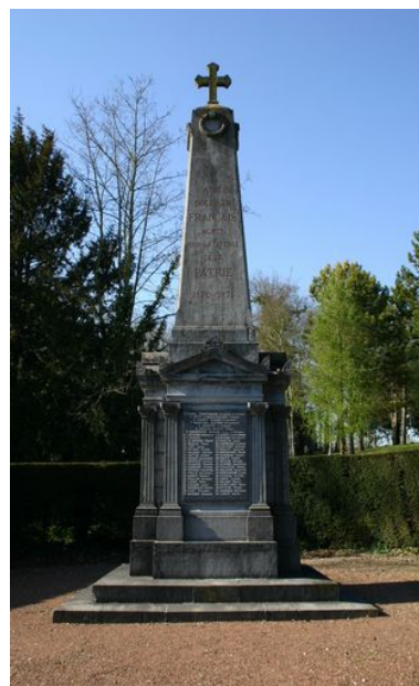
Le monument aux morts.