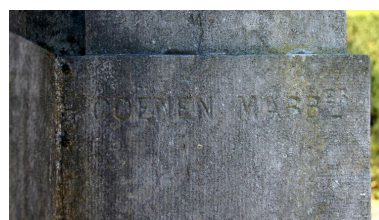
Monument aux morts : vue de détail sur le signature du marbrier Bernard Coënen.