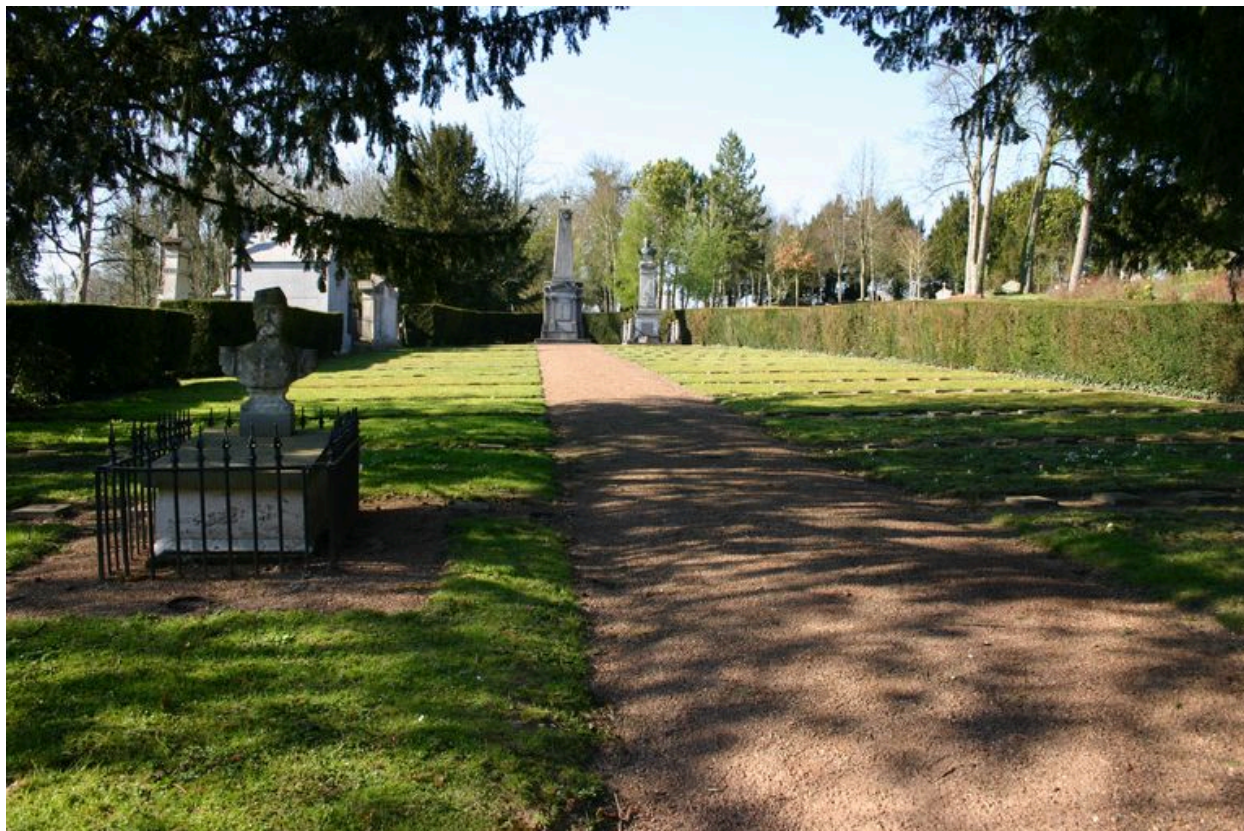
Vue générale du Carré militaire des soldats de 1870-1871, depuis le côté.