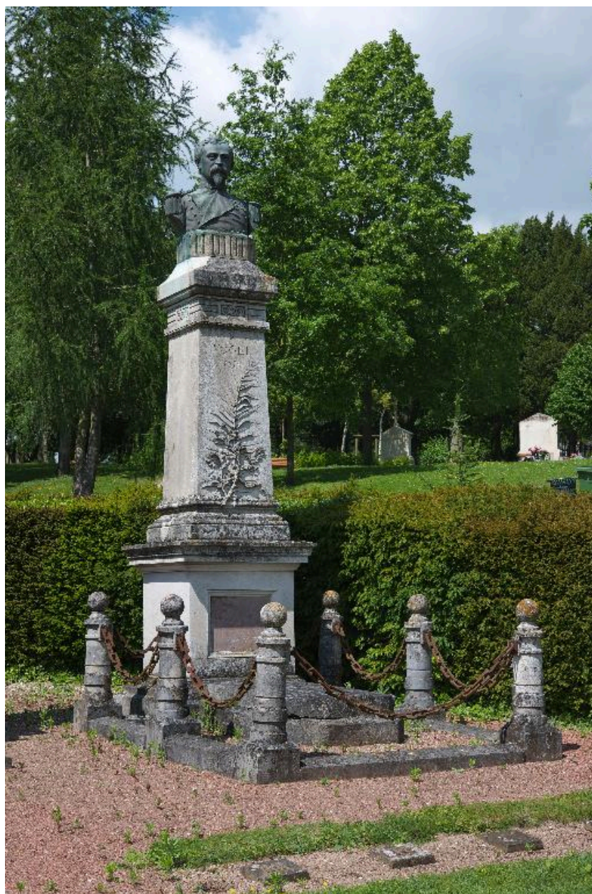
Le monument sépulcral du commandant Vogel. Vue depuis le côté.