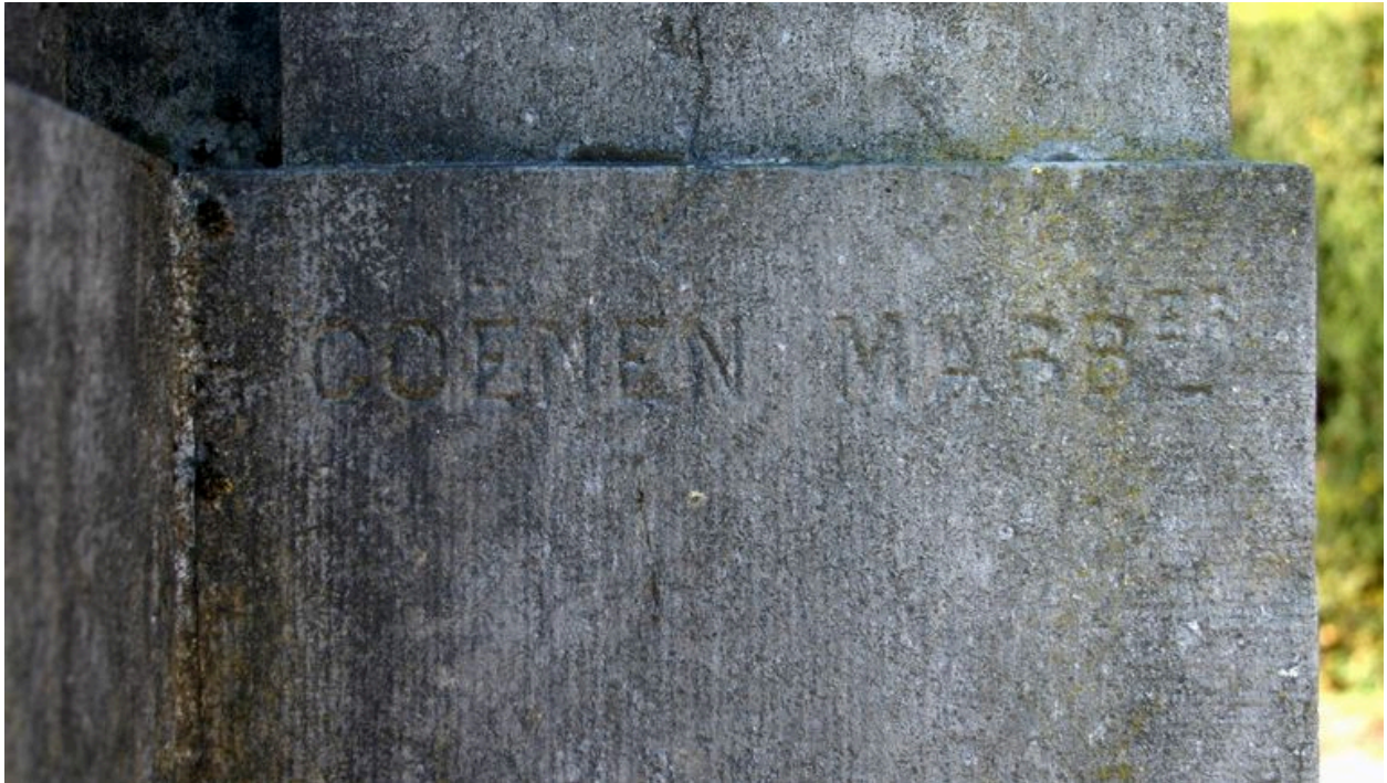
Monument aux morts : vue de détail sur le signature du marbrier Bernard Coënen.