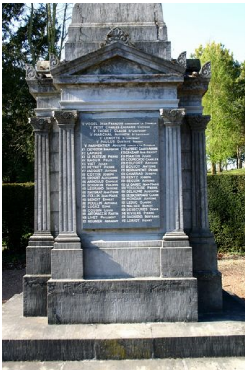
Monument aux morts : vue d'une des faces de la base.