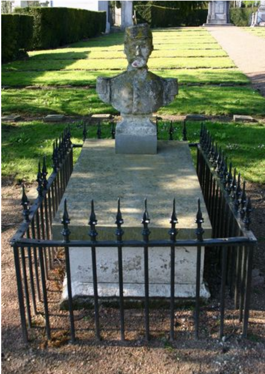
Tombeau en forme de sarcophage, A. Sallé (entrepreneur).