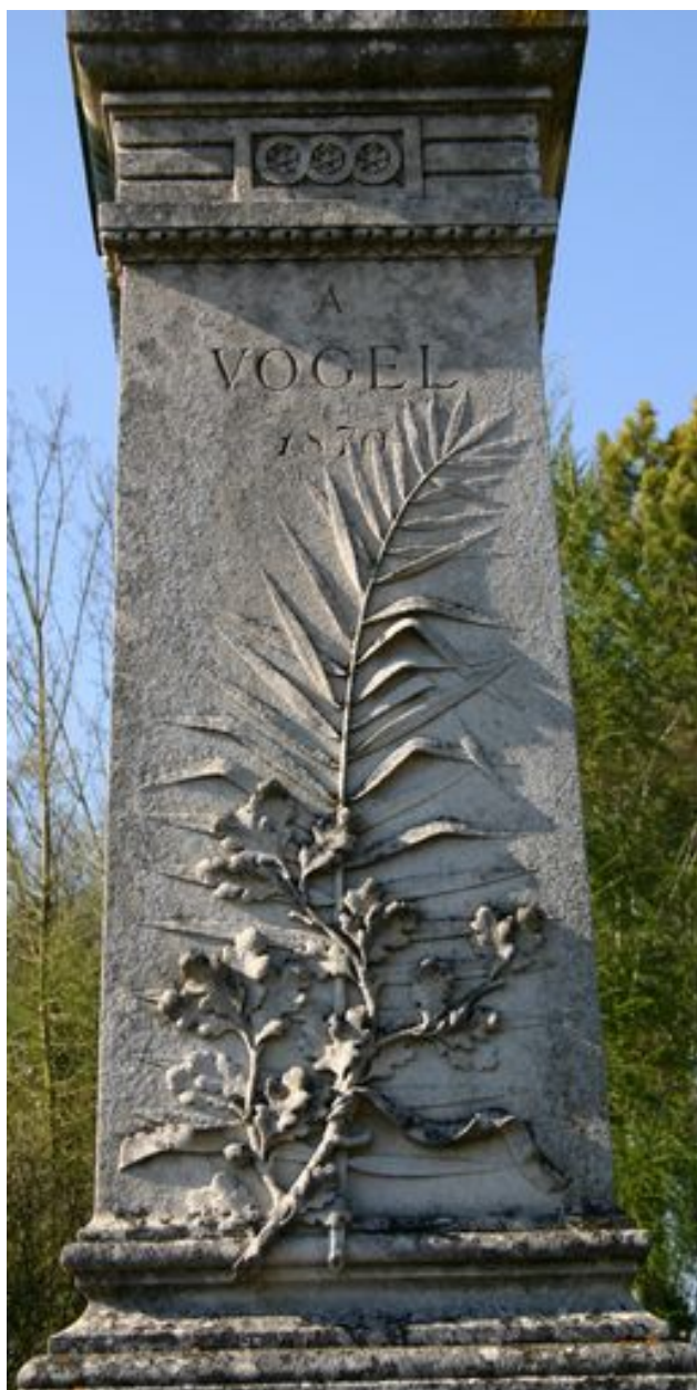
Monument sépulcral du commandant Vogel. Vue de détail du décor sculpté.