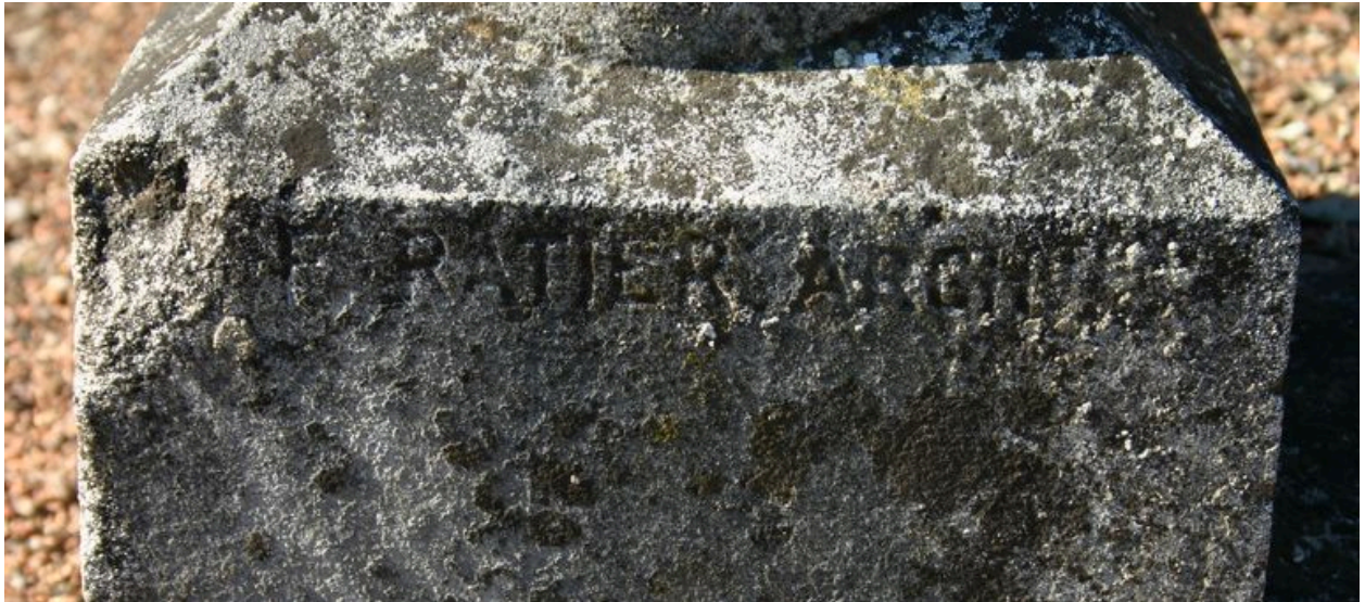
Monument sépulcral du commandant Vogel. Vue de détail sur la signature de l'architecte F. Ratier.