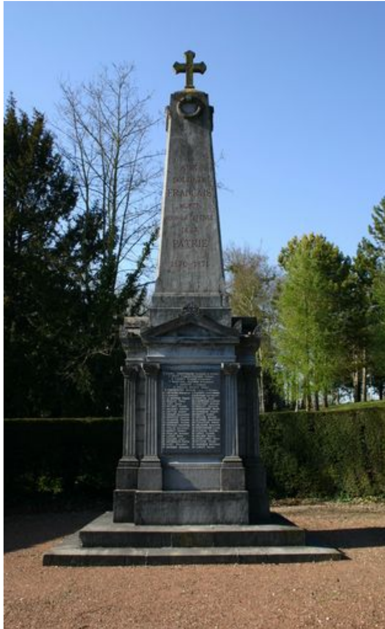
Le monument aux morts.