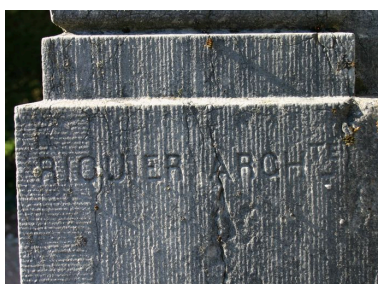
Monument au mort : vue de détail sur la signature de l'architecte Emile Riquier.