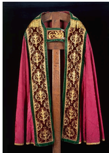
Vue de la troisième chape, de face.