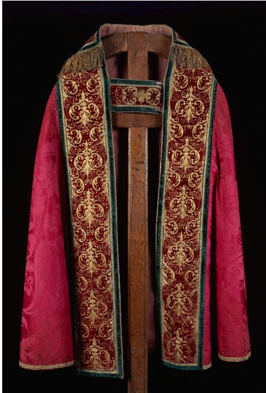
Vue de la deuxième chape, de face.