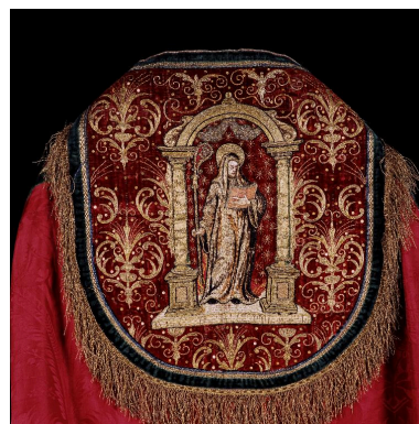
Détail du chaperon de la première chape : sainte Angadrême sous un portique.