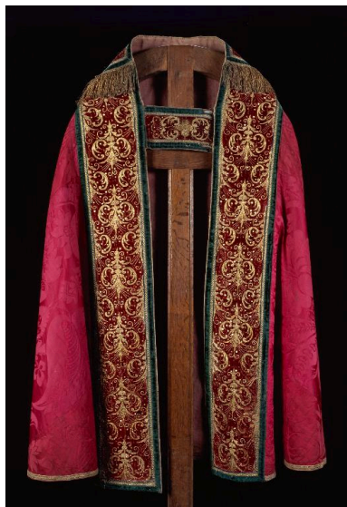
Vue de la deuxième chape, de face. IVR22_19956000953XA