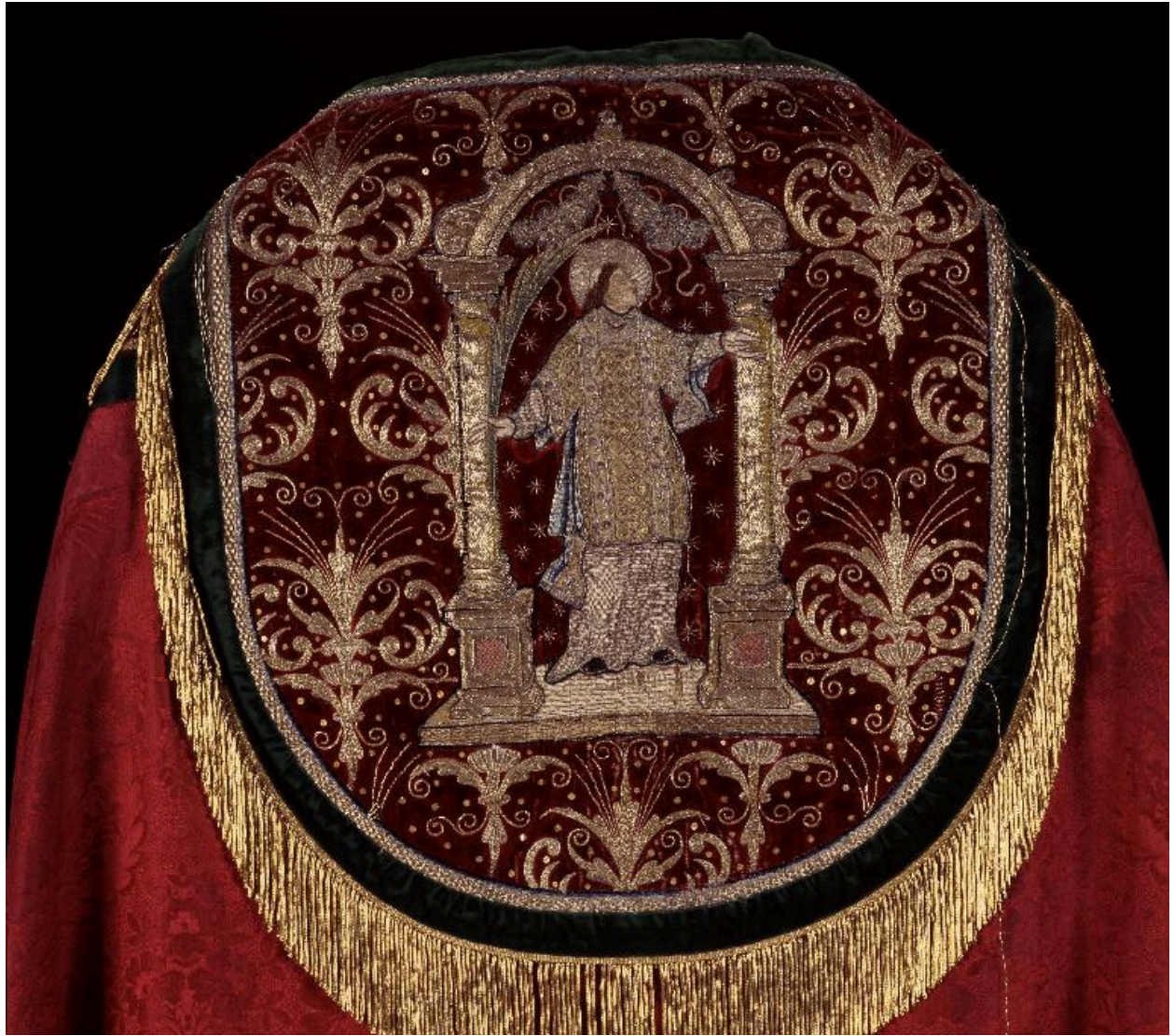
Détail du chaperon de la troisième chape : saint Etienne sous un portique.