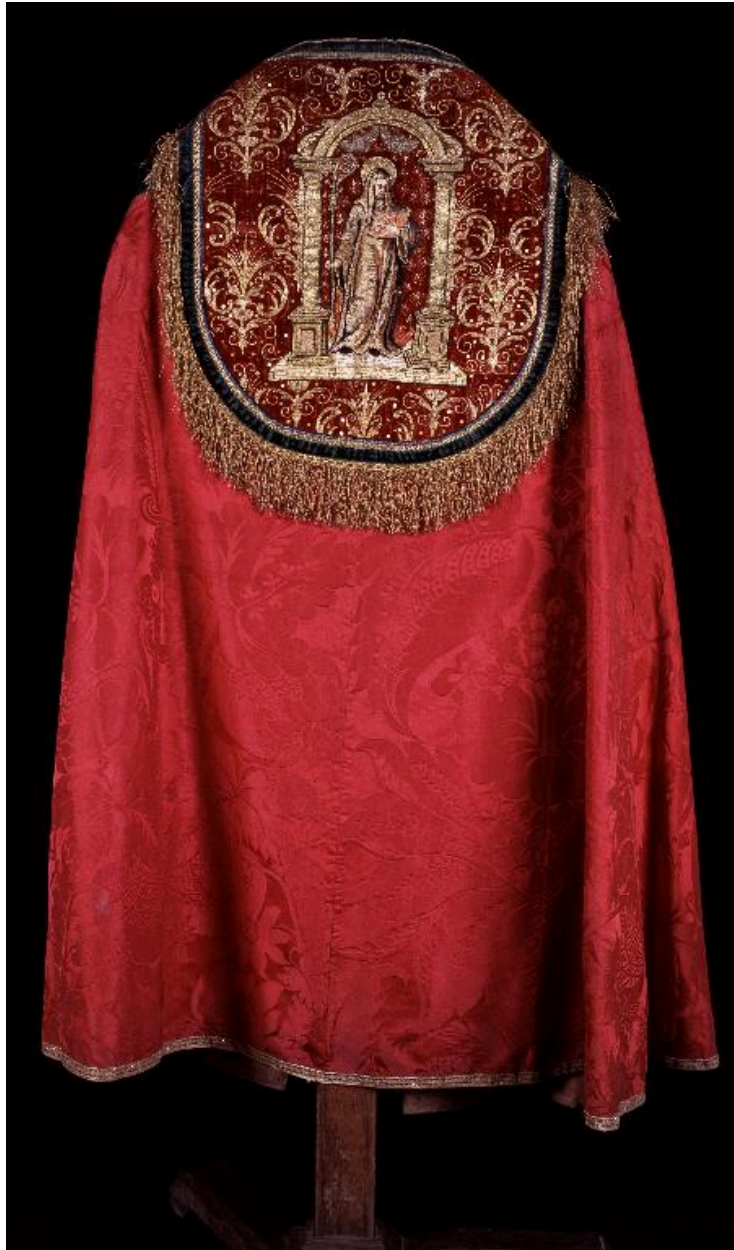
Vue de la première chape, de dos.