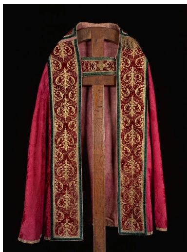
Vue de la première chape, de face.