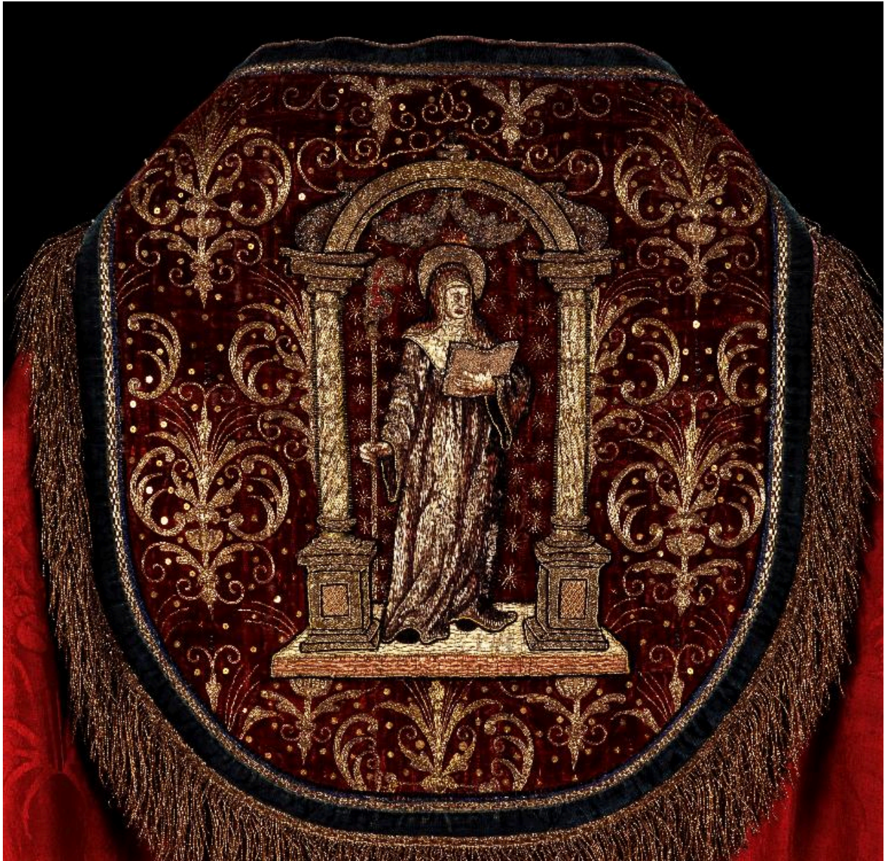
Détail du chaperon de la deuxième chape : sainte Angadrême sous un portique.