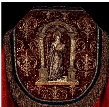
Détail du chaperon de la deuxième chape : sainte Angadrême sous un portique. IVR22_19956000955XA