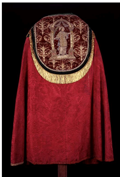
Vue de la troisième chape, de dos. IVR22_19956000971XA