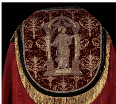
Détail du chaperon de la troisième chape : saint Etienne sous un portique.