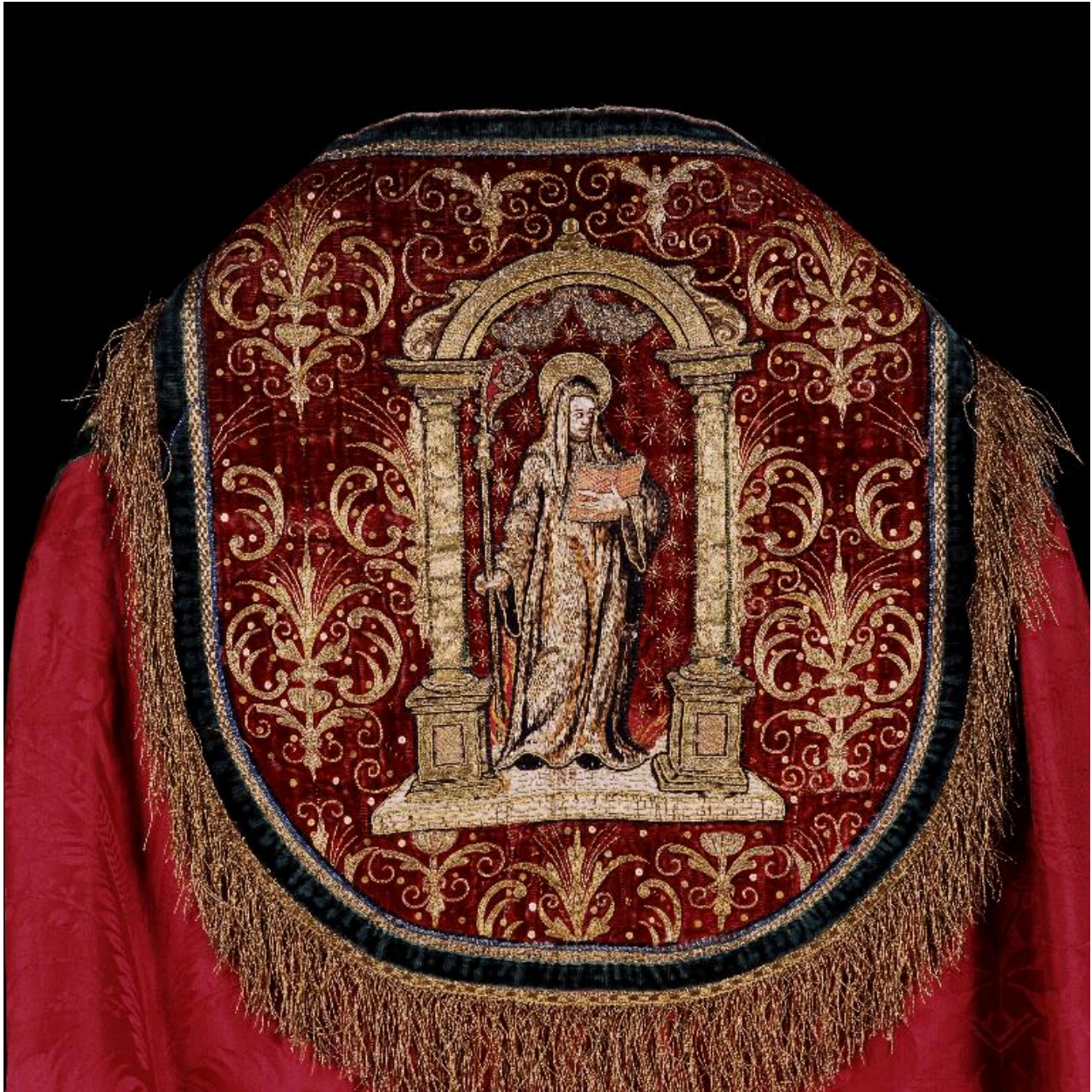
Détail du chaperon de la première chape : sainte Angadrême sous un portique.