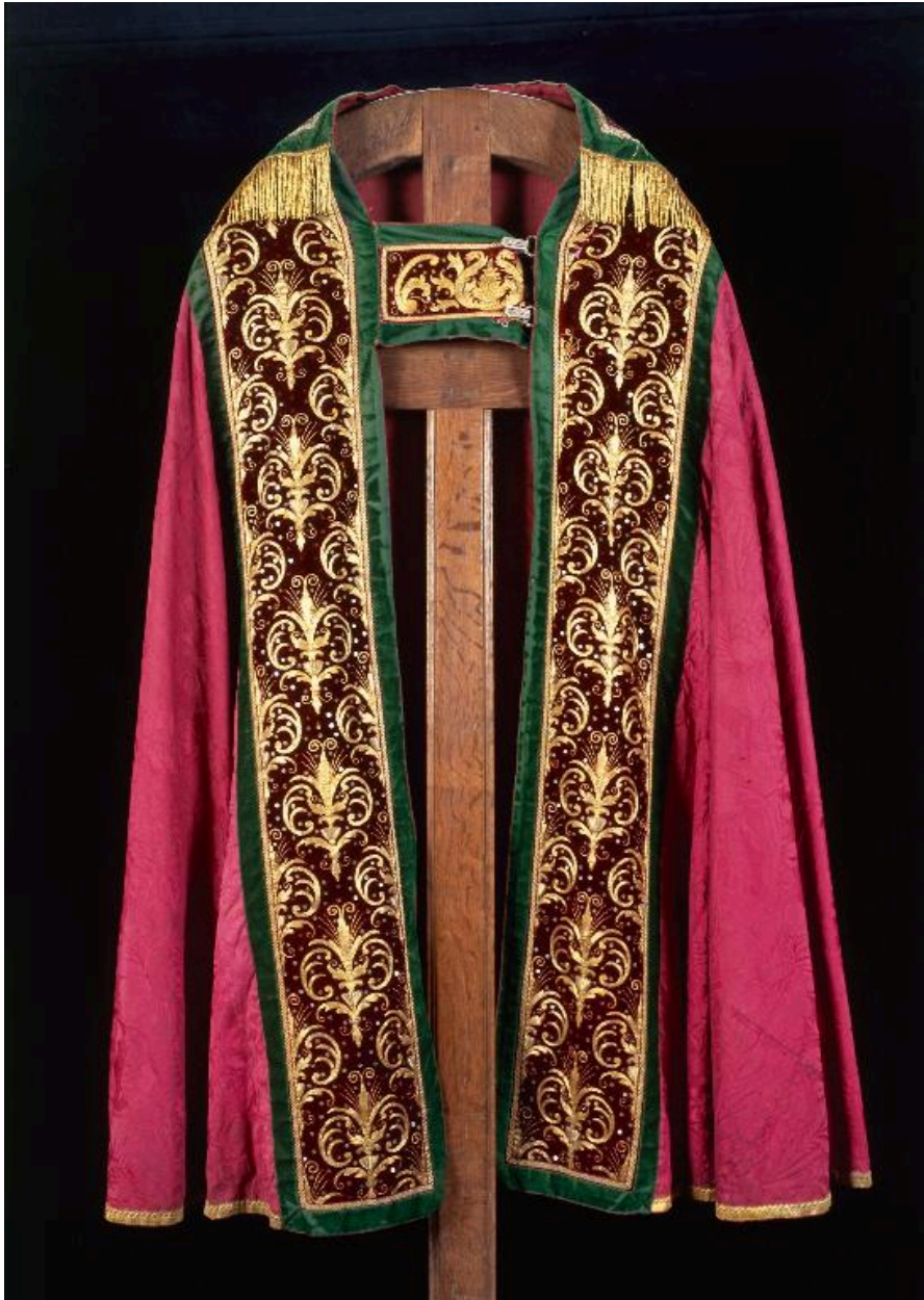
Vue de la troisième chape, de face.