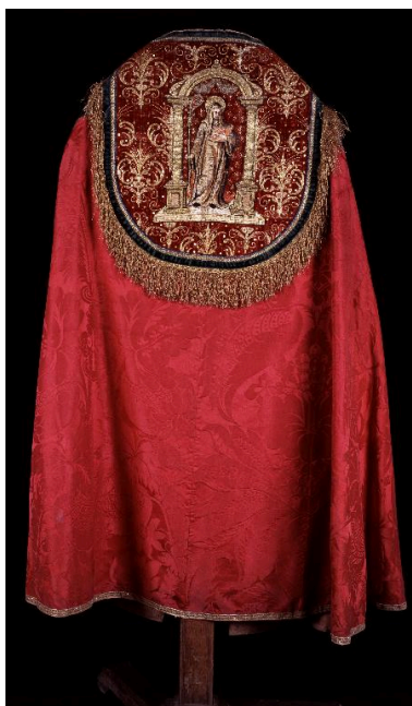
Vue de la première chape, de dos.