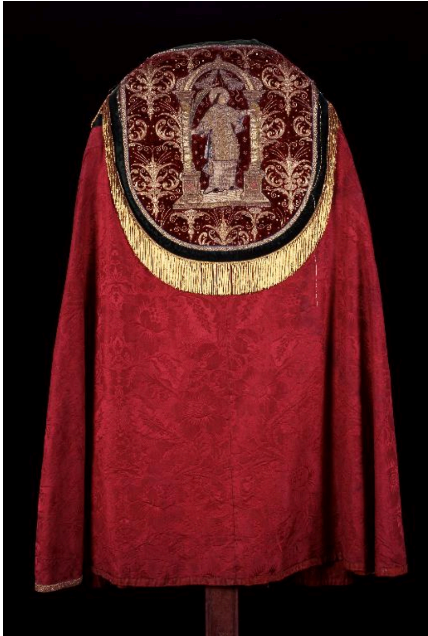
Vue de la troisième chape, de dos.