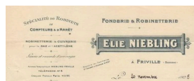
En-tête de facture de l'entreprise, 1925 (coll. part.). IVR22_20158006233NUCA

IVR32_20168005533NUCA