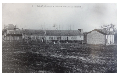
Vue de la robinetterie Niebling, début du 20e siècle (coll. part.).

Phot. Frédéric-Nicolas Kocourek (reproduction) IVR22_20158006232NUCA