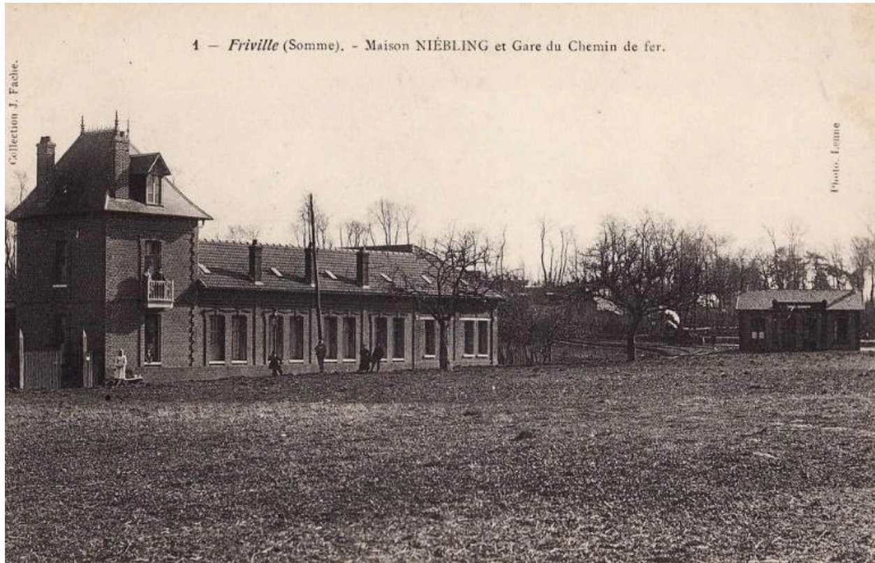
Robinetterie Niebling et ancienne gare de 1er réseau au début du 20e siècle.