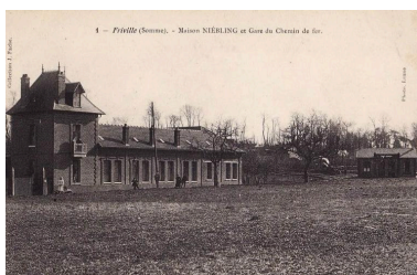
Robinetterie Niebling et ancienne gare de 1er réseau au début du 20e siècle (coll. part.).

Phot. Frédéric-Nicolas Kocourek (reproduction) IVR22_20158006232NUCA