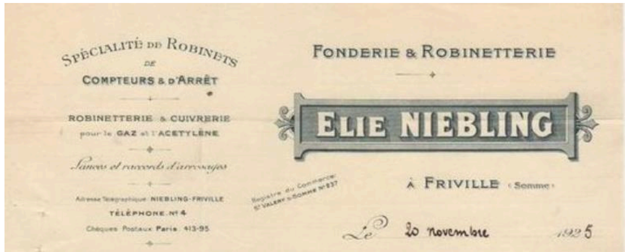
En-tête de facture de l'entreprise, 1925 (coll. part.).