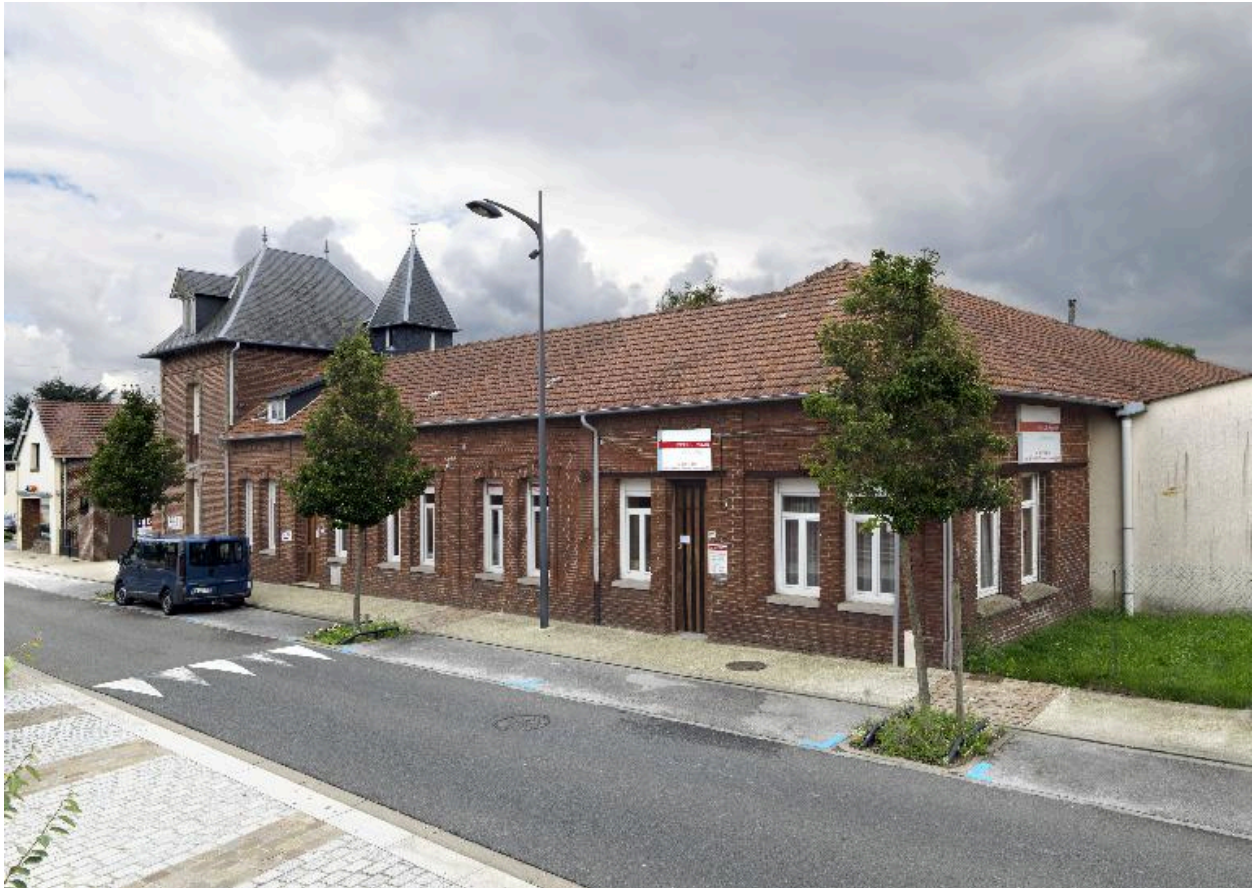
Vue de trois-quarts.