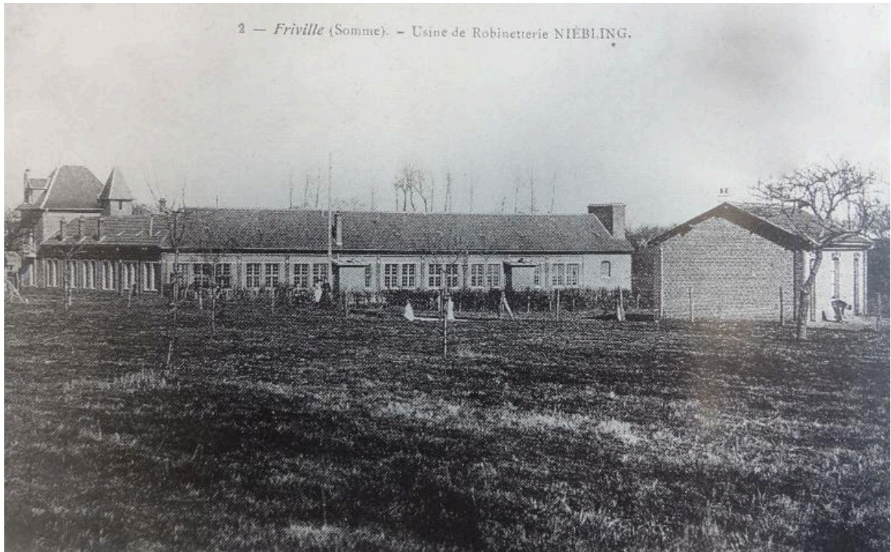
Vue de la robinetterie Niebling, début du 20e siècle (coll. part.).