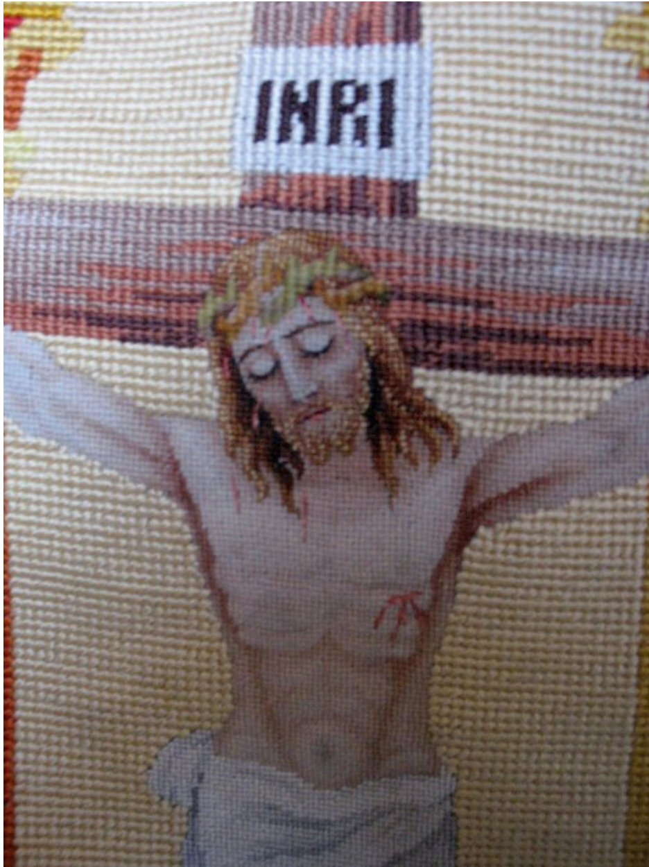
Chasuble : vue de détail, dos, Christ en croix, visage