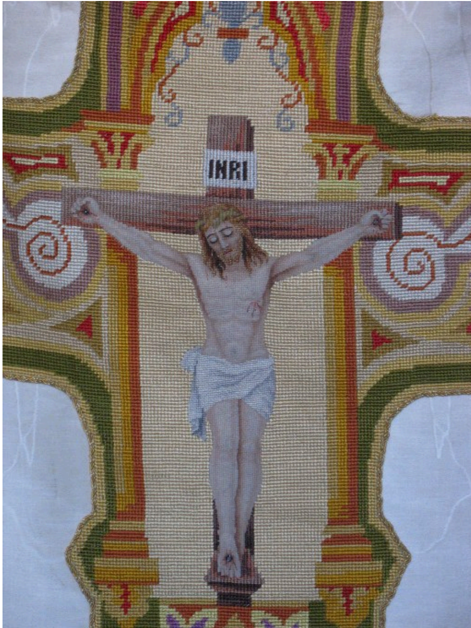
Chasuble : vue de détail, dos, Christ en croix