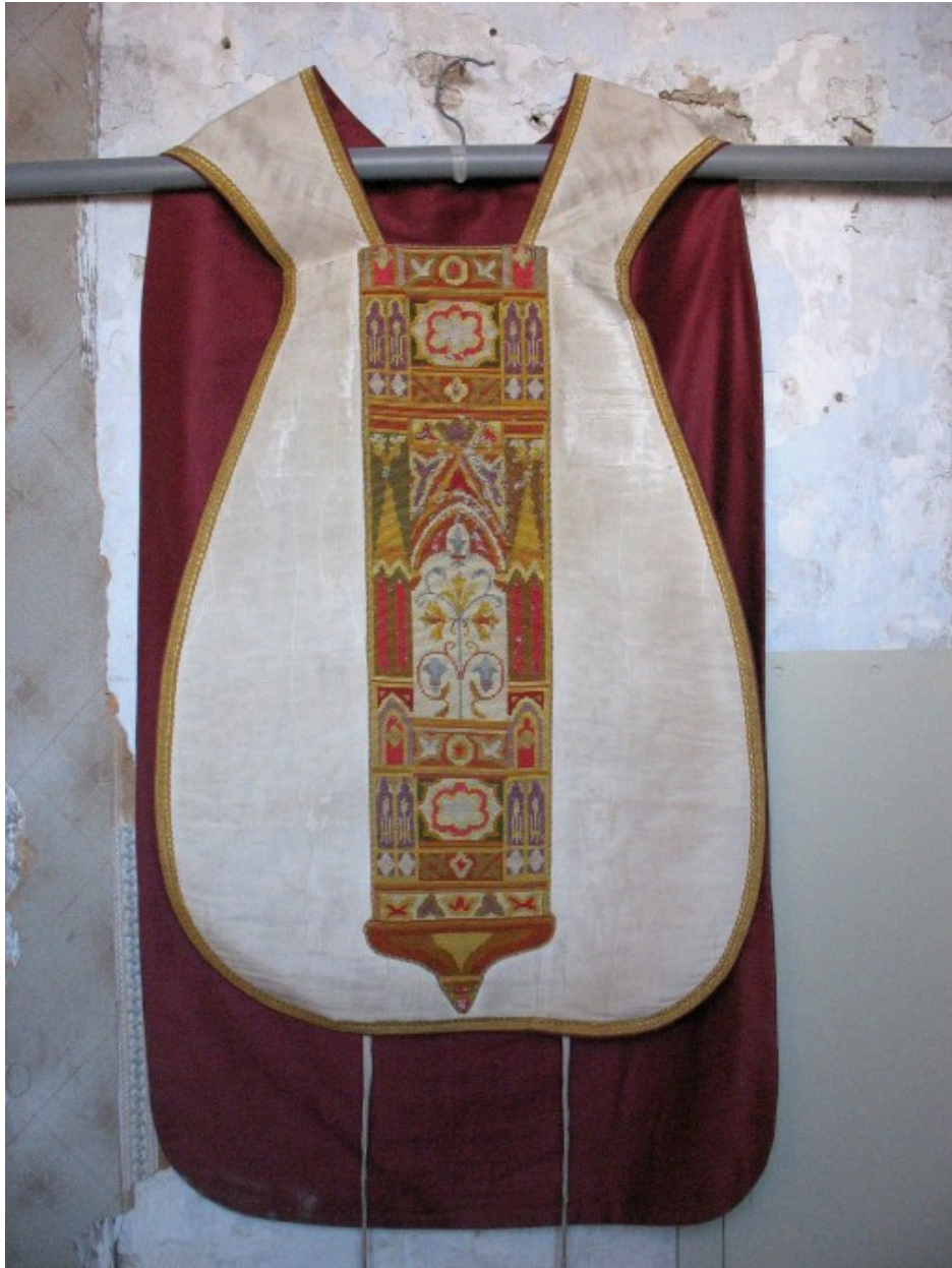
Chasuble : vue générale, devant