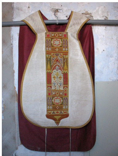
Chasuble : vue générale, devant