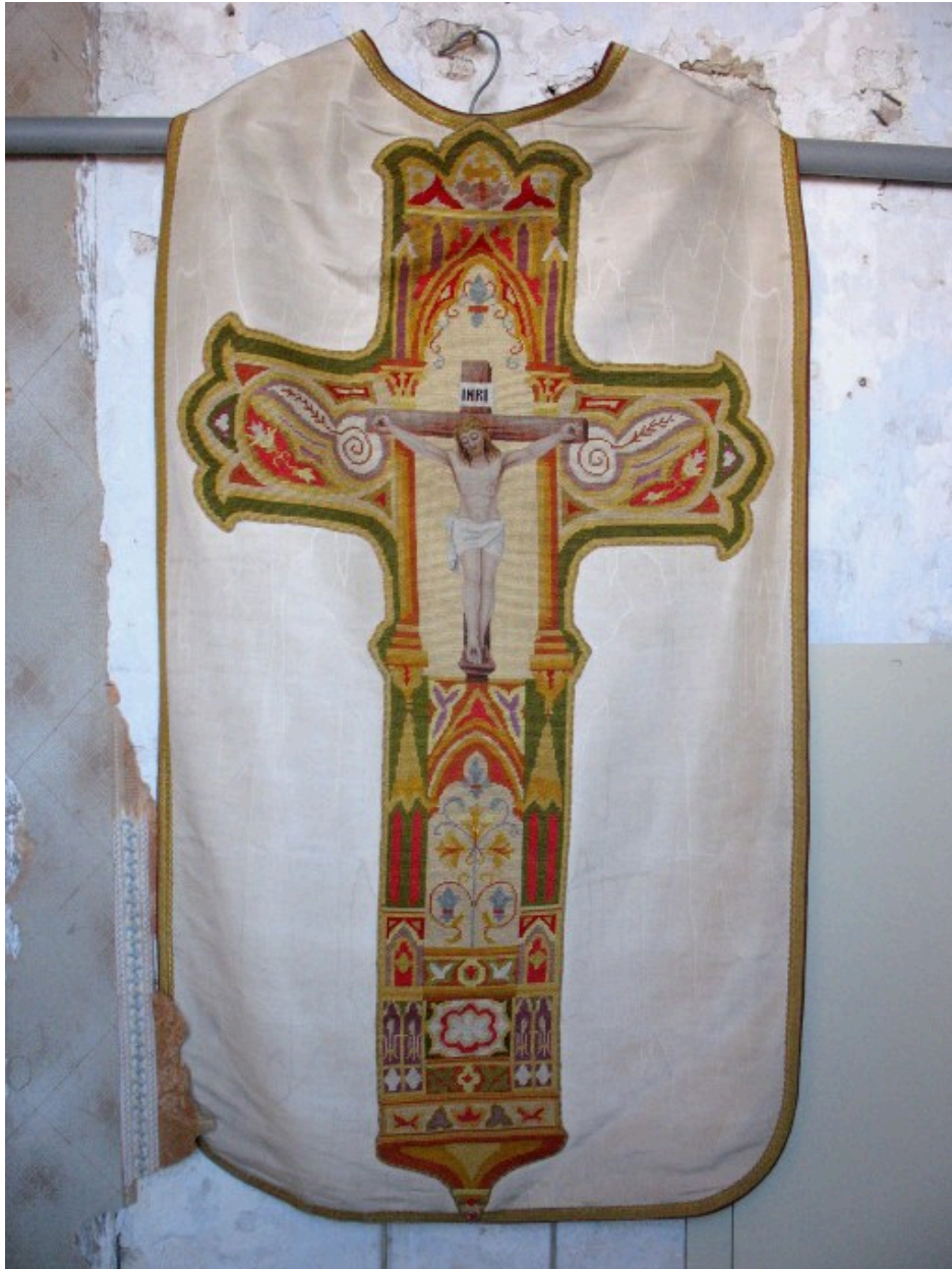
Chasuble : vue générale, dos