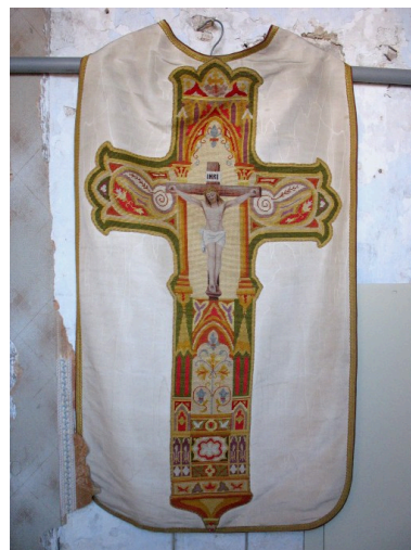
Chasuble : vue générale, dos IVR31_20106204173NUCA