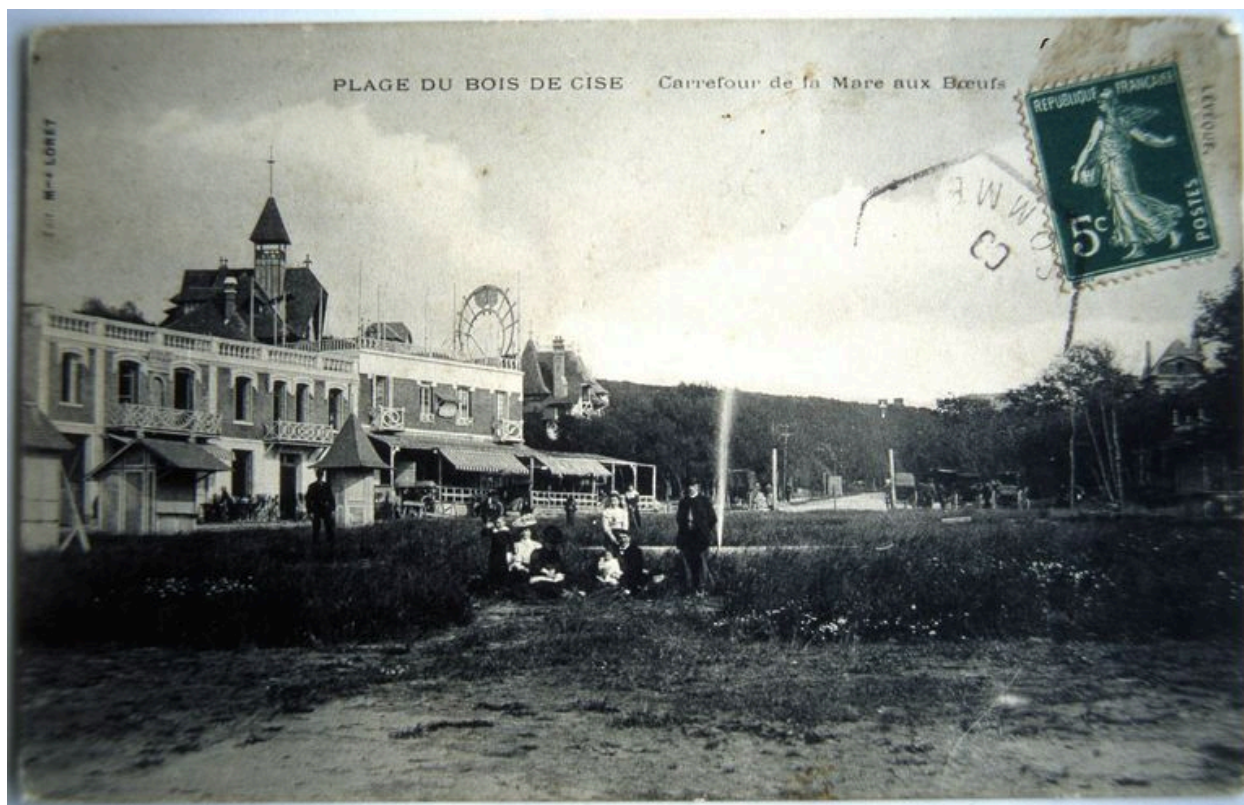
L'Américan Bar et le square Dussautoy, carte postale, 1er quart 20e siècle (coll. part.).