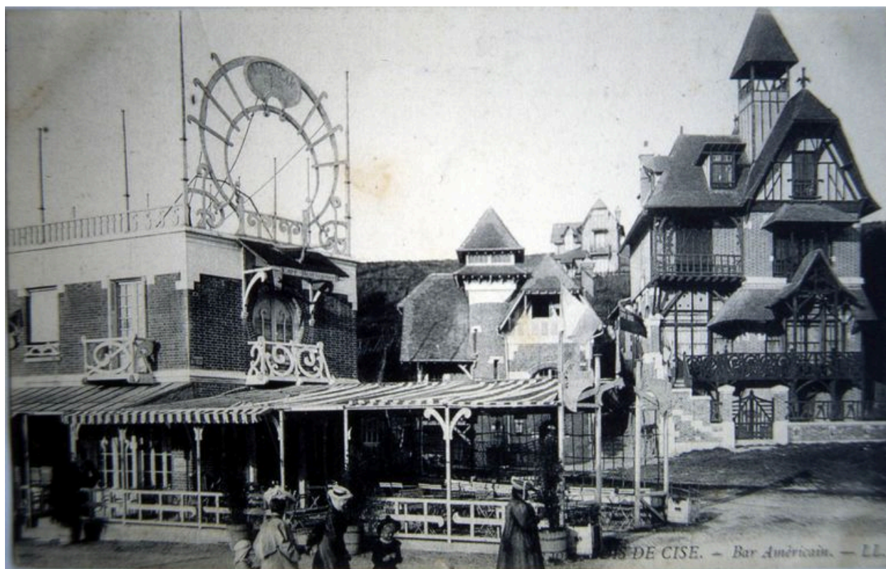
La terrasse de l'Américain Bar, carte postale, 1er quart 20e siècle.