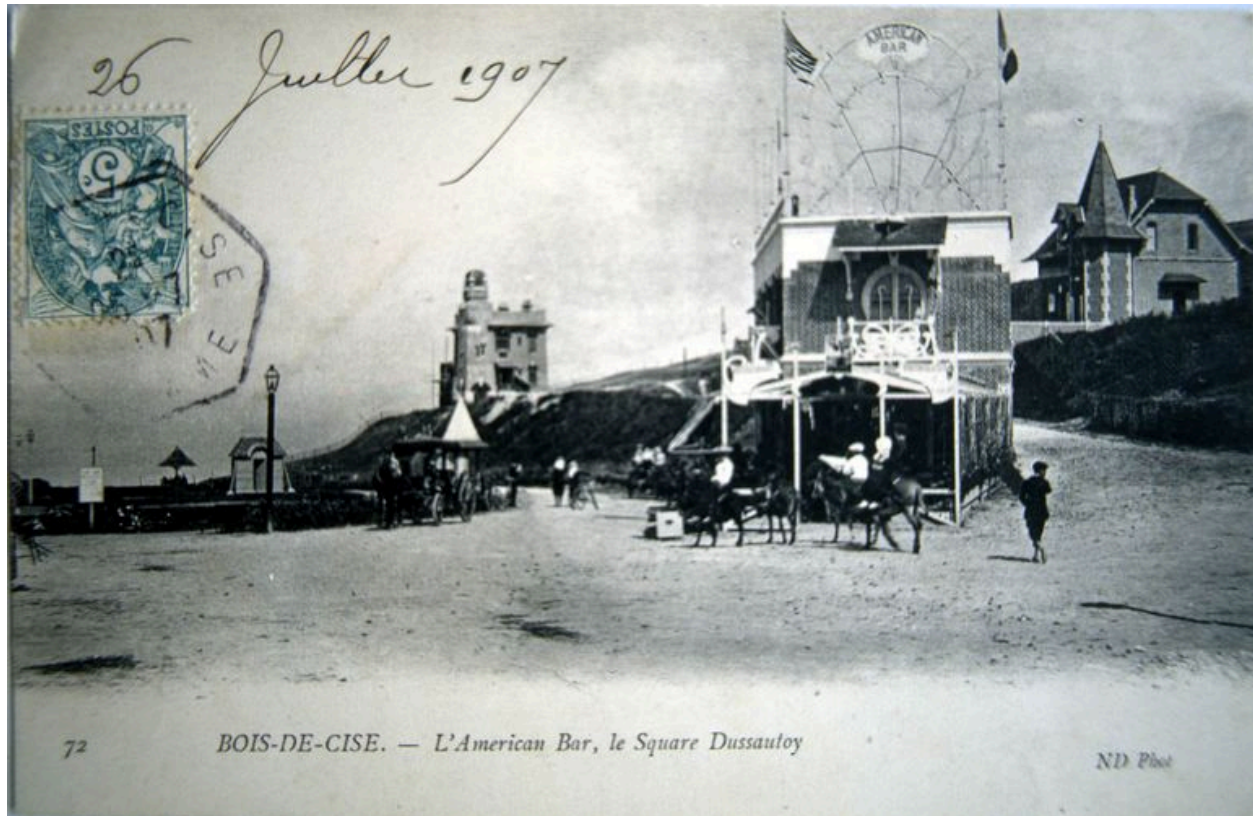
L'Américain Bar vu depuis l'avenue du Bois-de-Cise, carte postale, 1er quart 20e siècle (coll. part.).