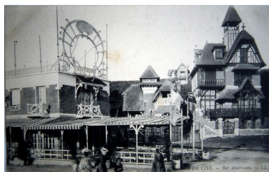
La terrasse de l'Américan Bar, carte postale, 1er quart 20e siècle (coll. part.).

IVR22_20058000557XAB