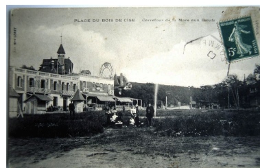
L'Américan Bar et le square Dussautoy, carte postale, 1er quart 20e siècle (coll. part.).

Phot. Monnehay-Vulliet Marie-Laure IVR22_20058000556XAB