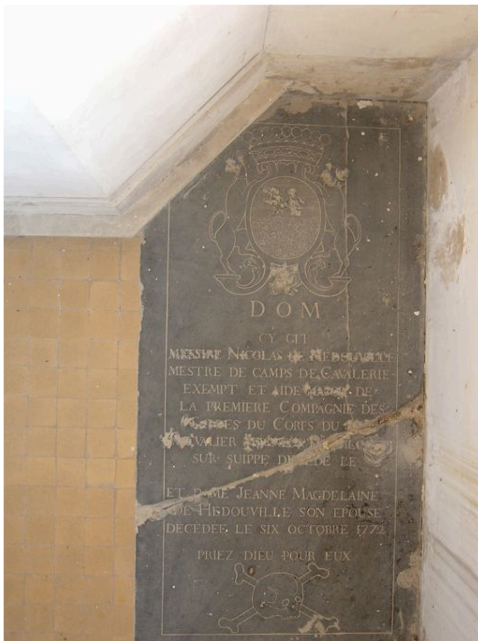
Plaque funéraire de Nicolas de Hédouville.