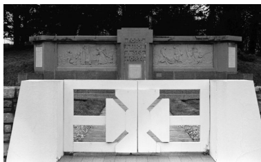
Vue de détail du portail. IVR22_19968000022Z