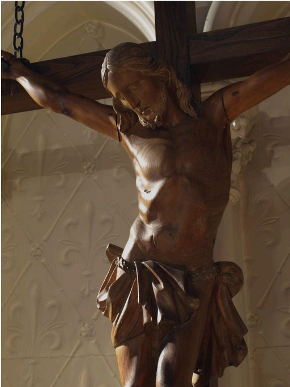
Vue de détail : partie supérieure du Christ