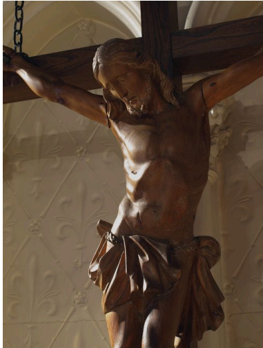
Vue de détail : partie supérieure du Christ IVR31_20106204773NUCA