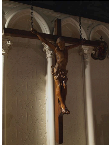
Vue générale IVR31_20106204771NUCA