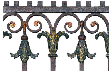
Détail de la grille.