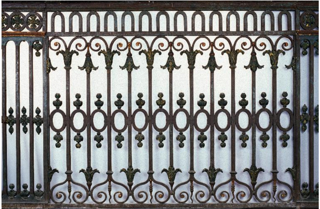
Vue de la grille de la chapelle Saint-Vincent.