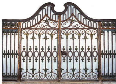
Vue de détail : la porte de la clôture. IVR22_19966004053ZA