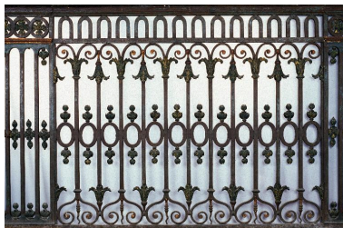
Vue de la grille de la chapelle Saint-Vincent.