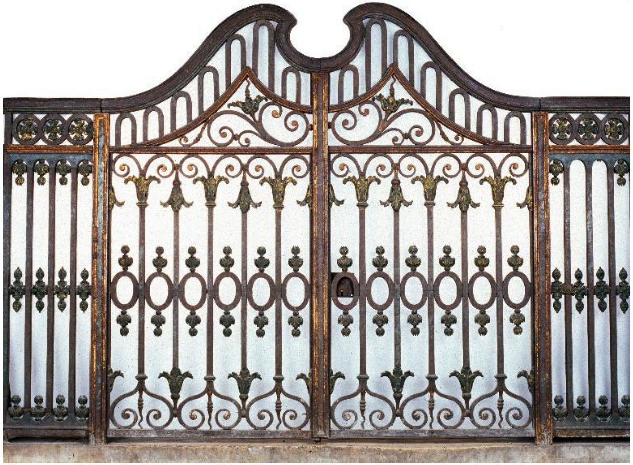
Vue de détail : la porte de la clôture.