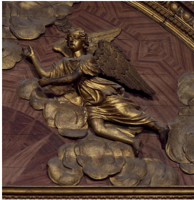
Détail du fronton : vue de l'ange de droite.