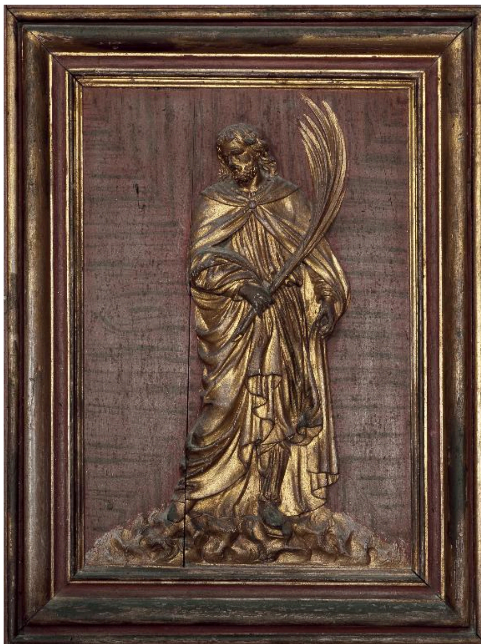
Détail des vantaux de l'armoire : panneau du registre médian représentant saint Rufin.