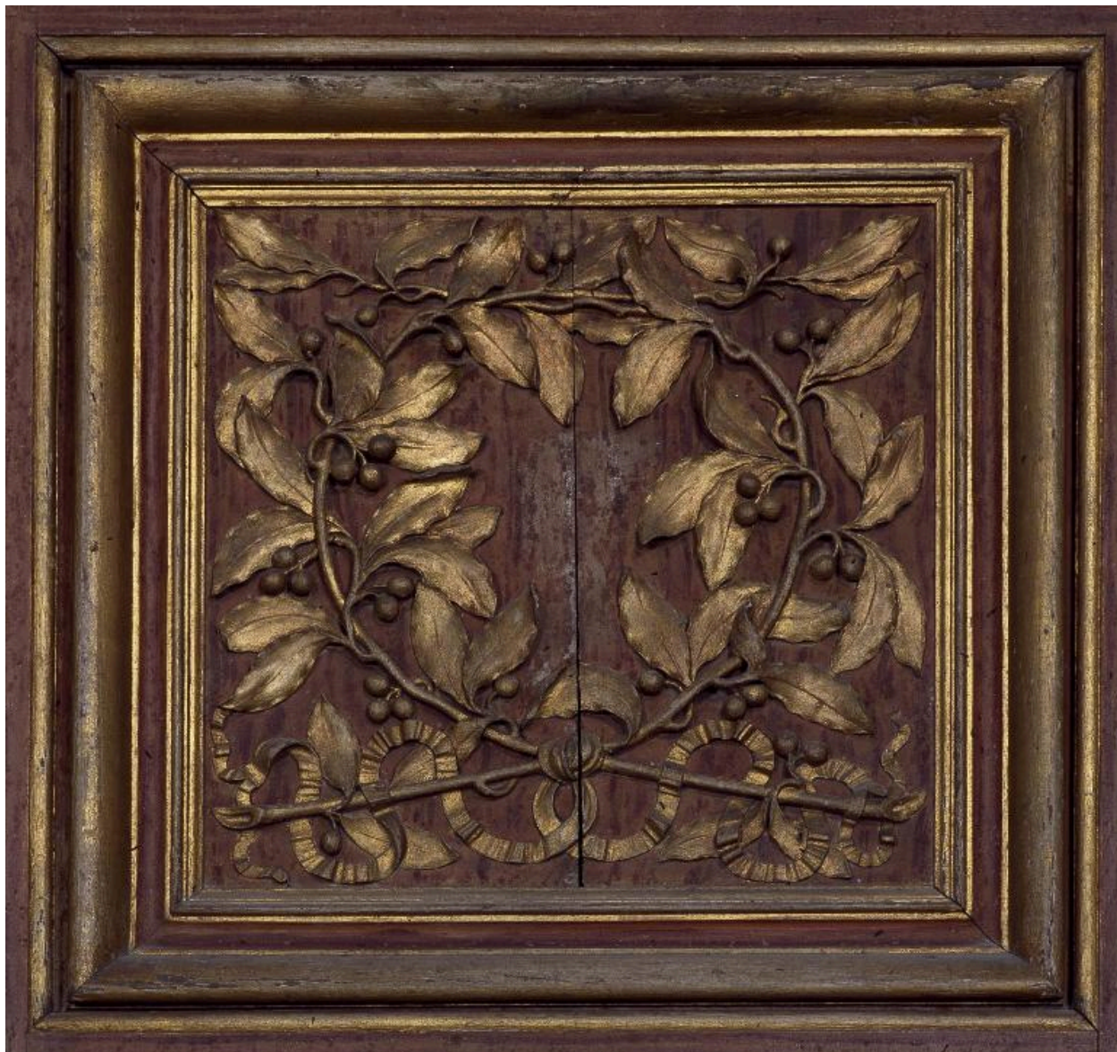
Détail des vantaux de l'armoire : panneau du registre supérieur représentant une couronne de laurier.