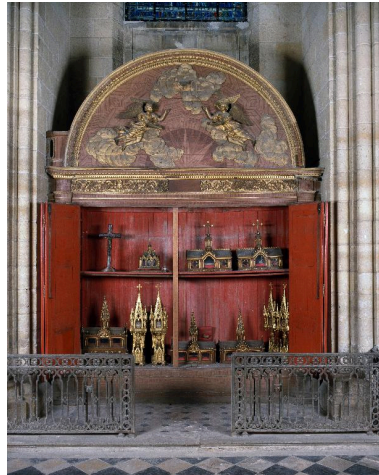
Vue de l'armoire ouverte. IVR22_20010202605XA

IVR22_19970200229XA