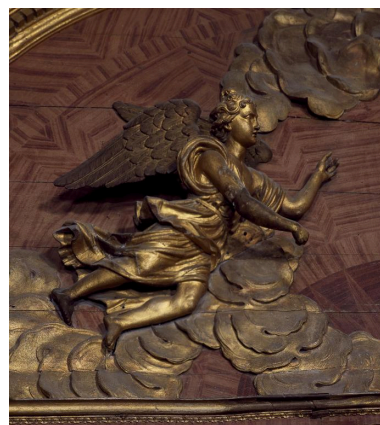
Détail du fronton : vue de l'ange de gauche.