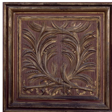
Détail des vantaux de l'armoire : panneau du registre inférieur représentant deux palmes nouées.