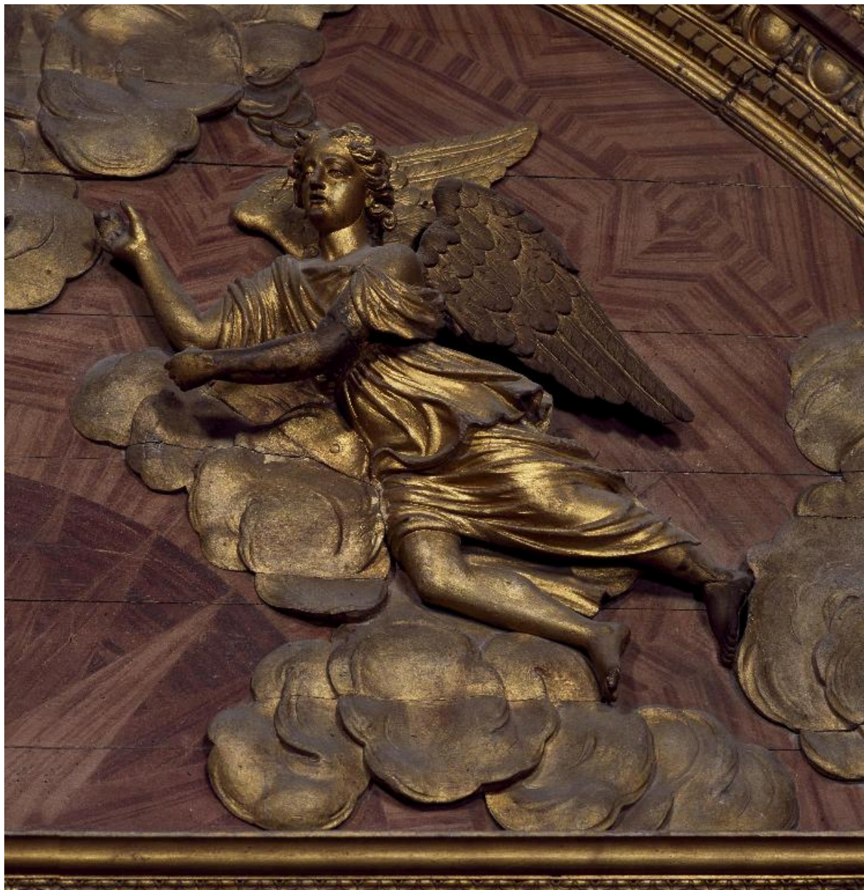
Détail du fronton : vue de l'ange de droite.