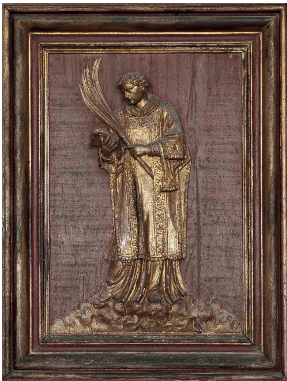
Détail des vantaux de l'armoire : panneau du registre médian représentant saint Protais.