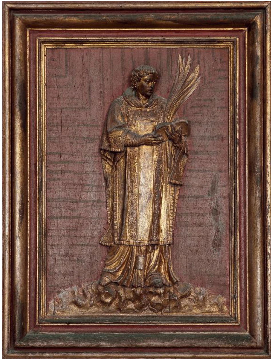
Détail des vantaux de l'armoire : panneau du registre médian représentant saint Gervais.