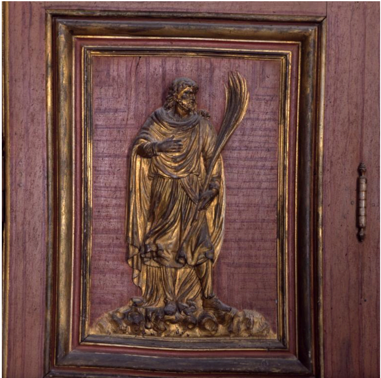
Détail des vantaux de l'armoire : panneau du registre médian représentant saint Valère.