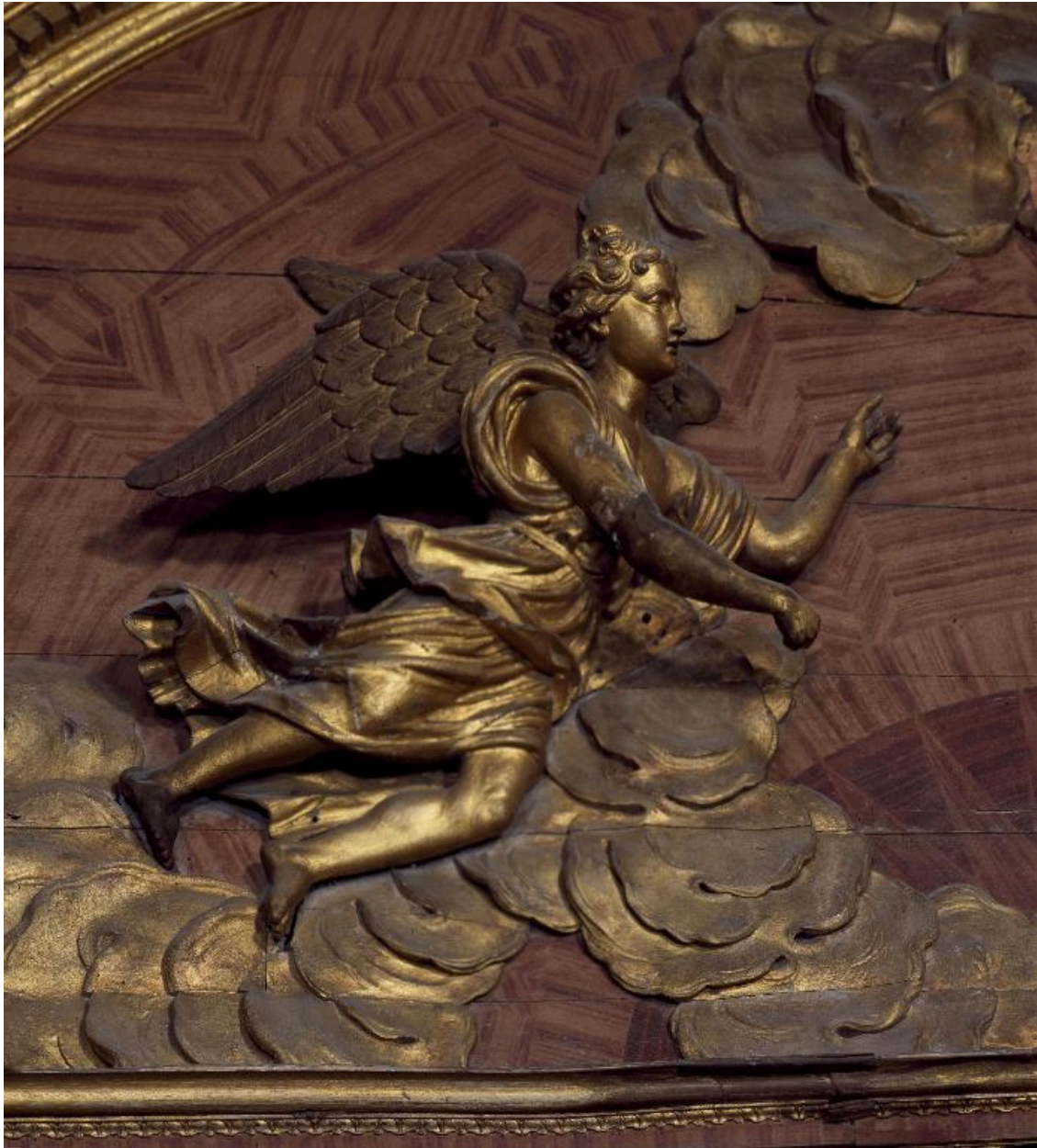
Détail du fronton : vue de l'ange de gauche.