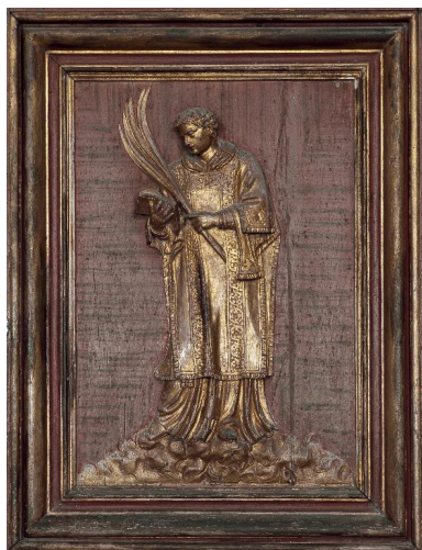
Détail des vantaux de l'armoire : panneau du registre médian représentant saint Protais.