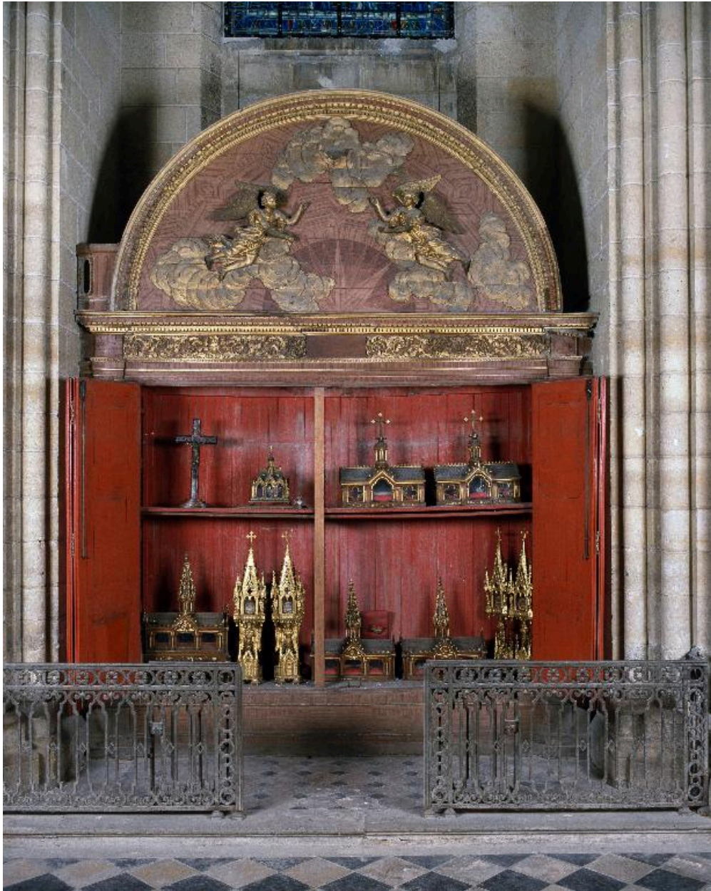
Vue de l'armoire ouverte.