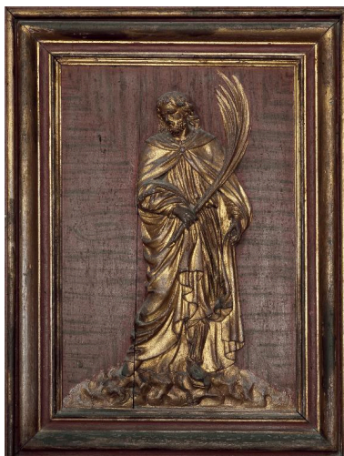
Détail des vantaux de l'armoire : panneau du registre médian représentant saint Rufin.