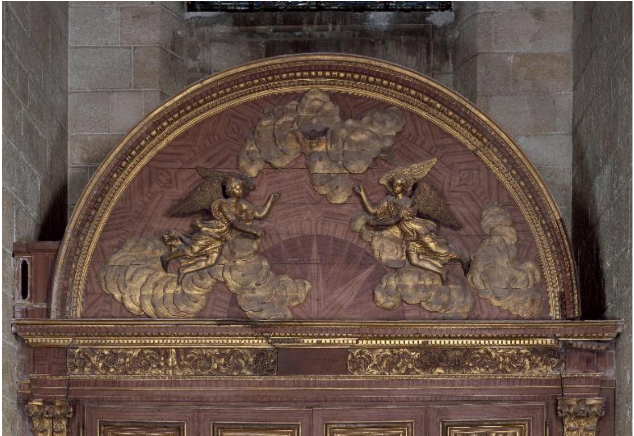
Vue du fronton de l'armoire.