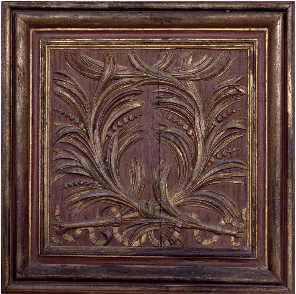
Détail des vantaux de l'armoire : panneau du registre inférieur représentant deux palmes nouées.