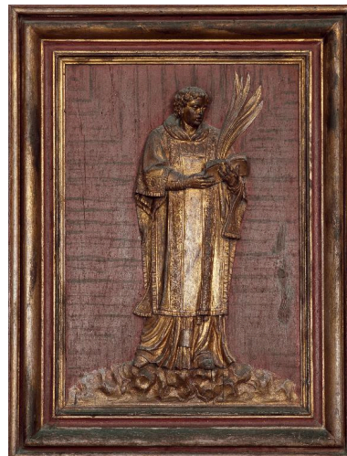
Détail des vantaux de l'armoire : panneau du registre médian représentant saint Gervais. IVR22_19970200227XA