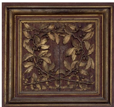
Détail des vantaux de l'armoire : panneau du registre supérieur représentant une couronne de laurier.