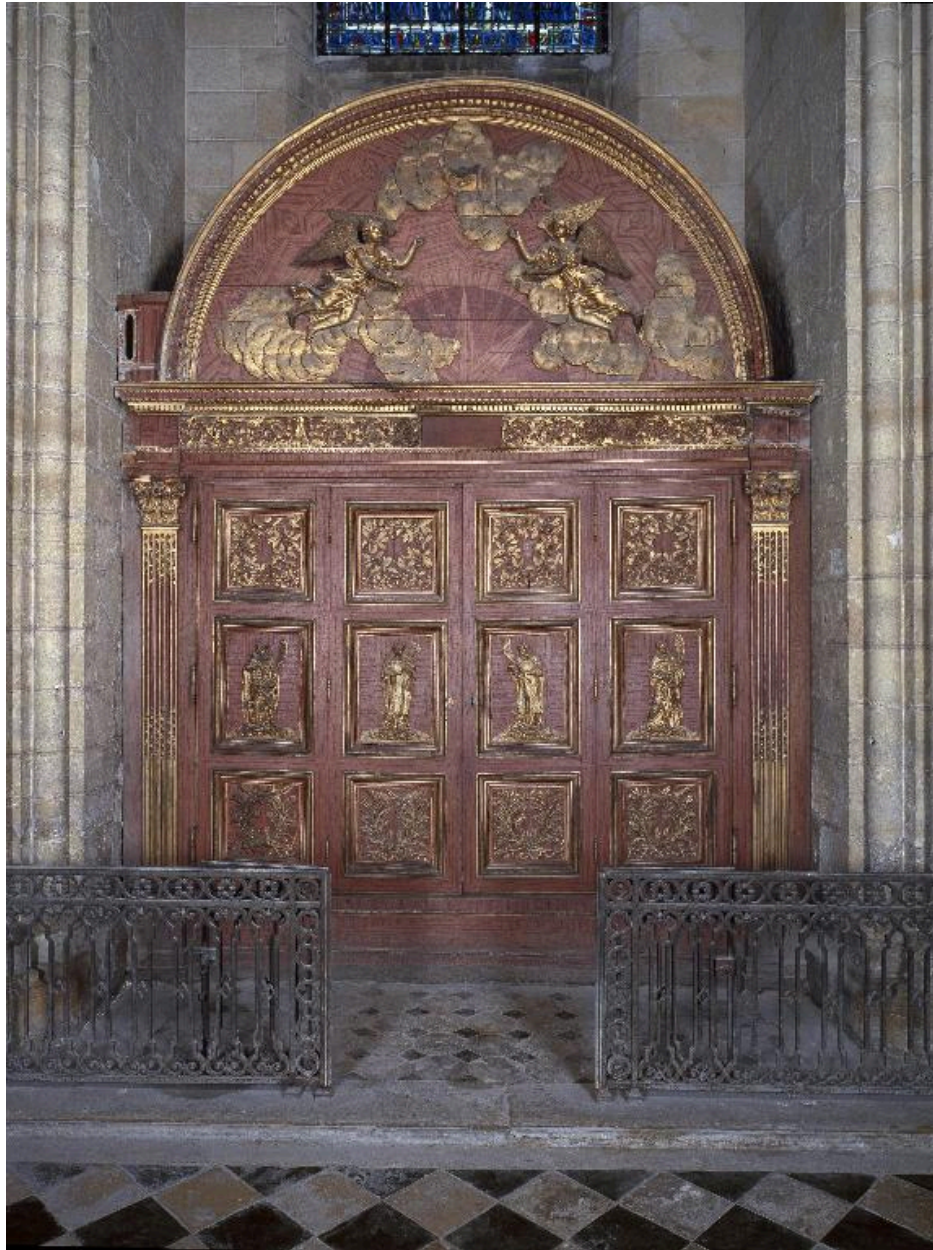
Vue générale de l'armoire.