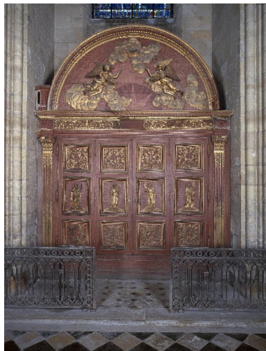
Vue générale de l'armoire.