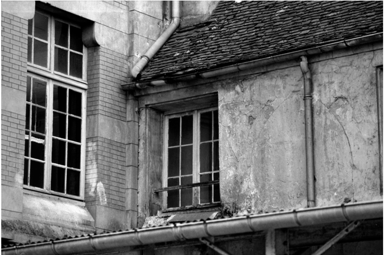
Détail du raccord entre le bâtiment neuf du XIXe siècle et de la chapelle.