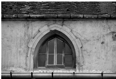
Détail d'une baie de la chapelle.