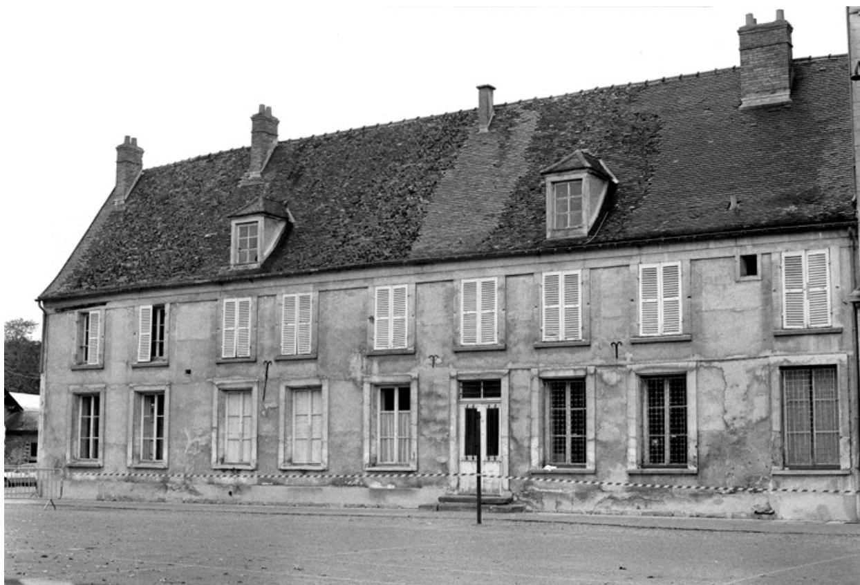
Elévation est et vue des bâtiments conventuels.