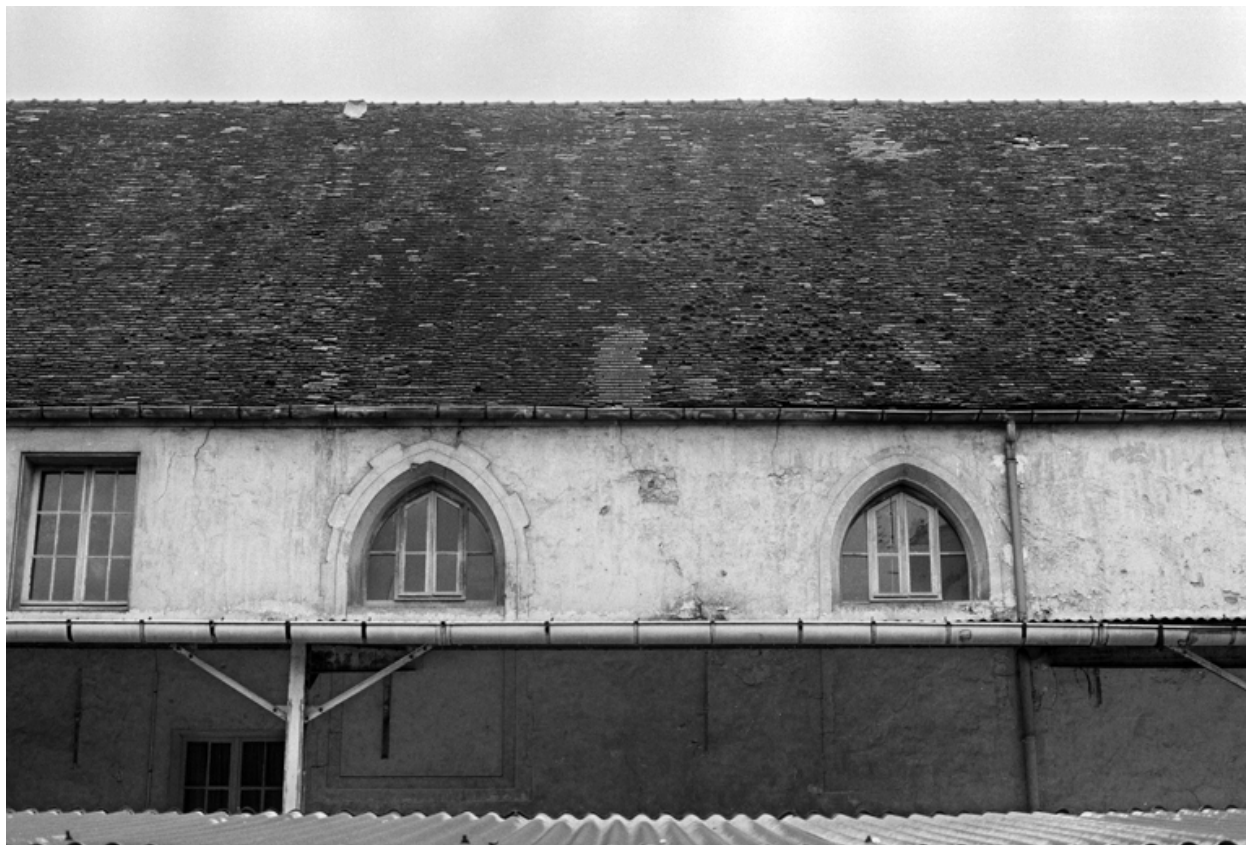
Elévation nord de la chapelle.