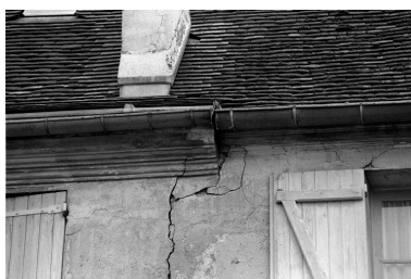
Détail de la corniche de la façade sud et vue des bâtiments conventuels.