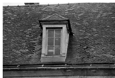
Détail d'une lucarne.