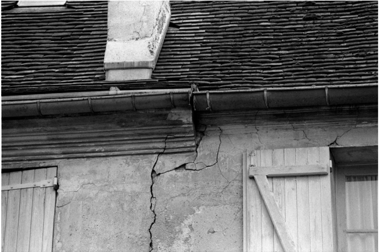
Détail de la corniche de la façade sud et vue des bâtiments conventuels.