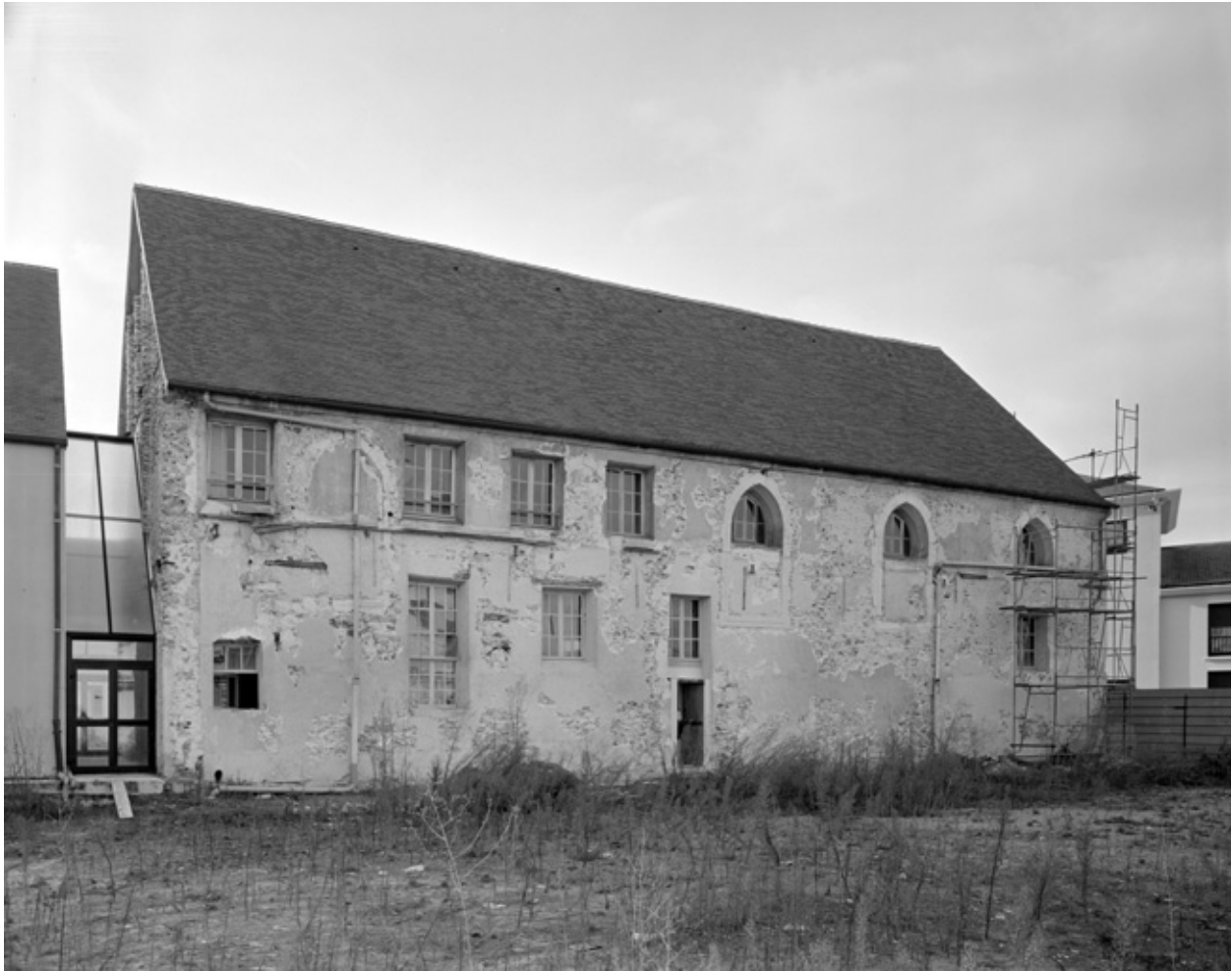
La face orientale de l'ancienne chapelle, en cours de travaux.