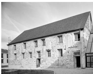
La face occidentale de l'ancienne chapelle, en cours de travaux. IVR22_19930201914V

IVR22_19880202095VB