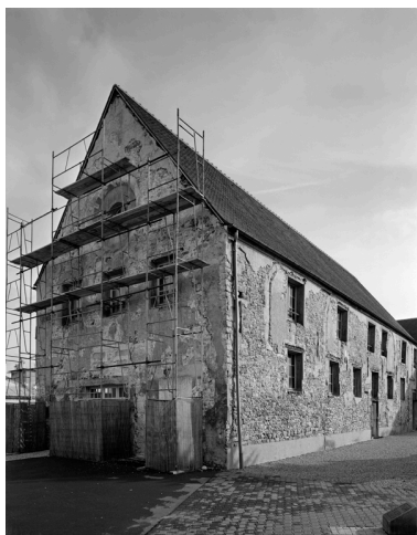
Le pignon de l'ancienne chapelle, en cours de travaux.