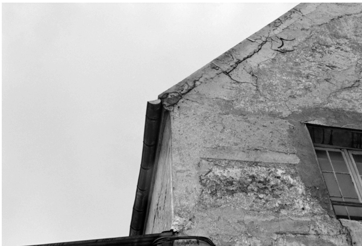
Vue de la chapelle et détail de la façade ouest.