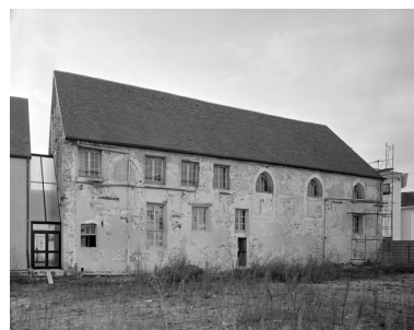
La face orientale de l'ancienne chapelle, en cours de travaux. IVR22_19930201915V