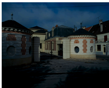
Les pavillons d'entrée, restaurés en 1994.