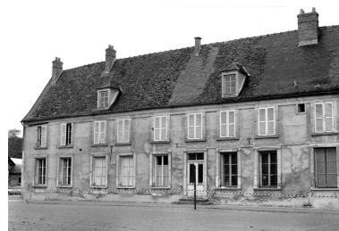
Élévation est et vue des bâtiments conventuels. IVR22_19880201798Z