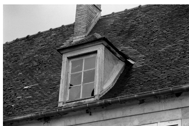
Détail de lucarnes. IVR22_19880201800Z