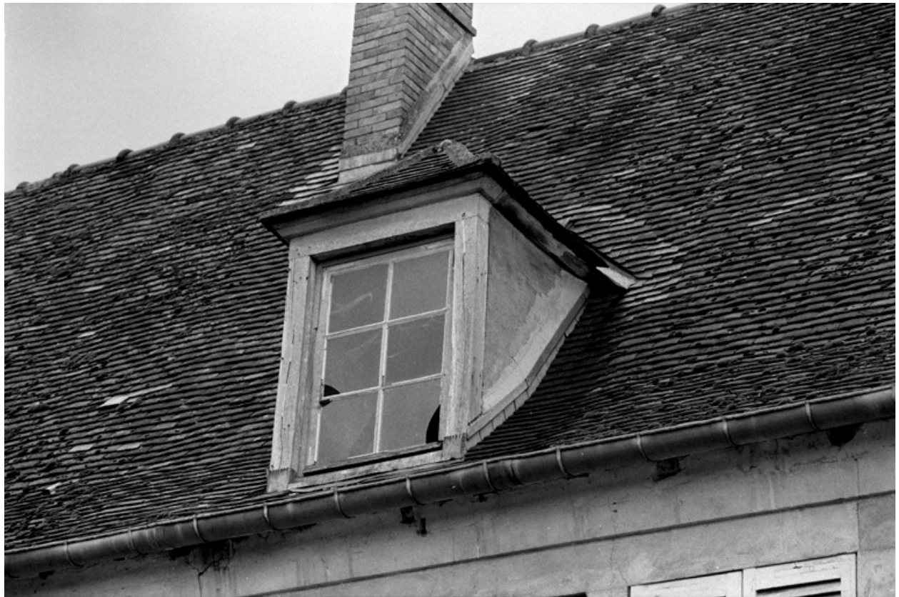
Détail de lucarnes.