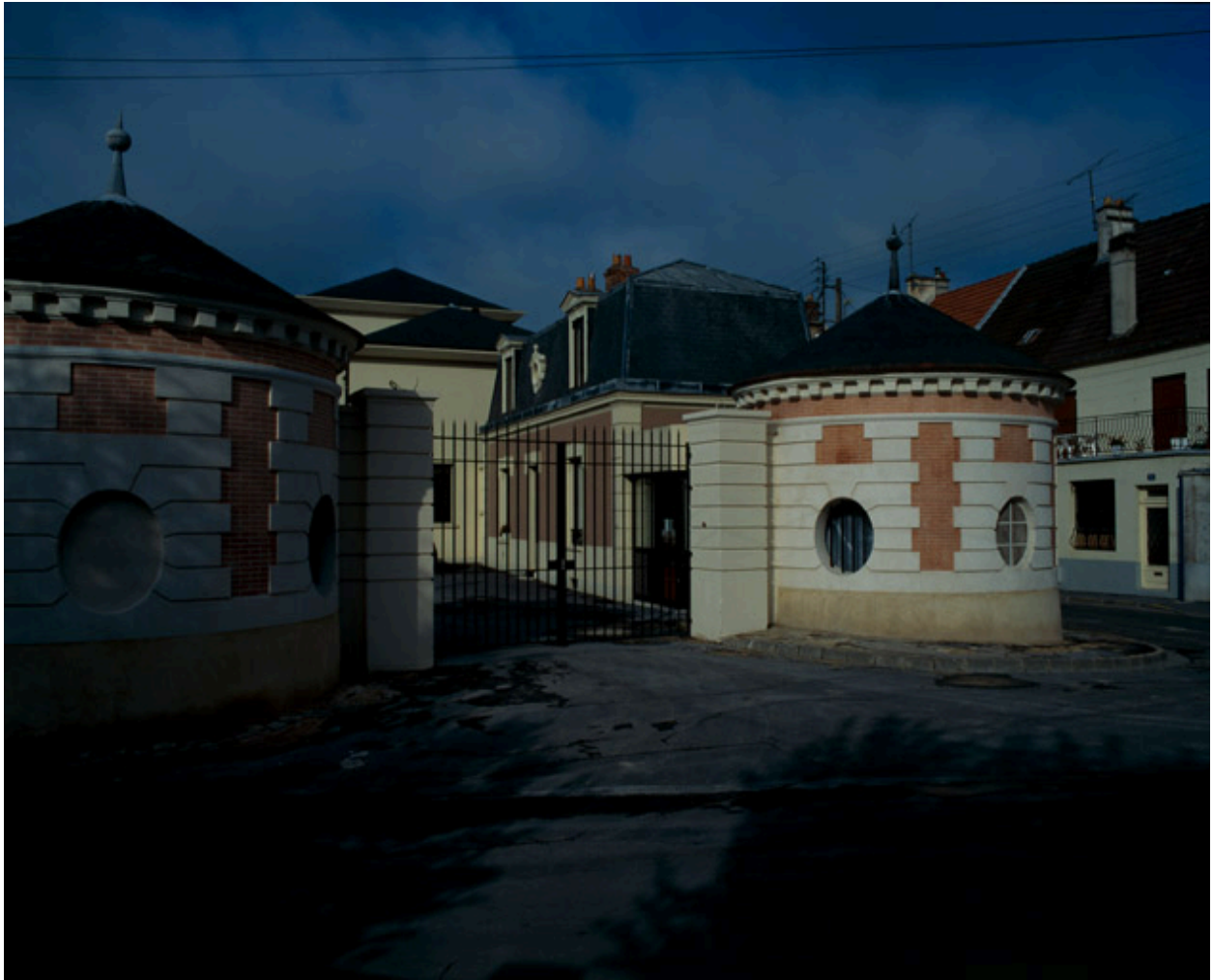
Les pavillons d'entrée, restaurés en 1994.