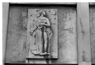
Bas-relief de D. Gelin, 1962.