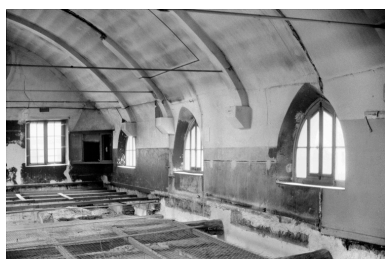
Vue de la chapelle : charpente.