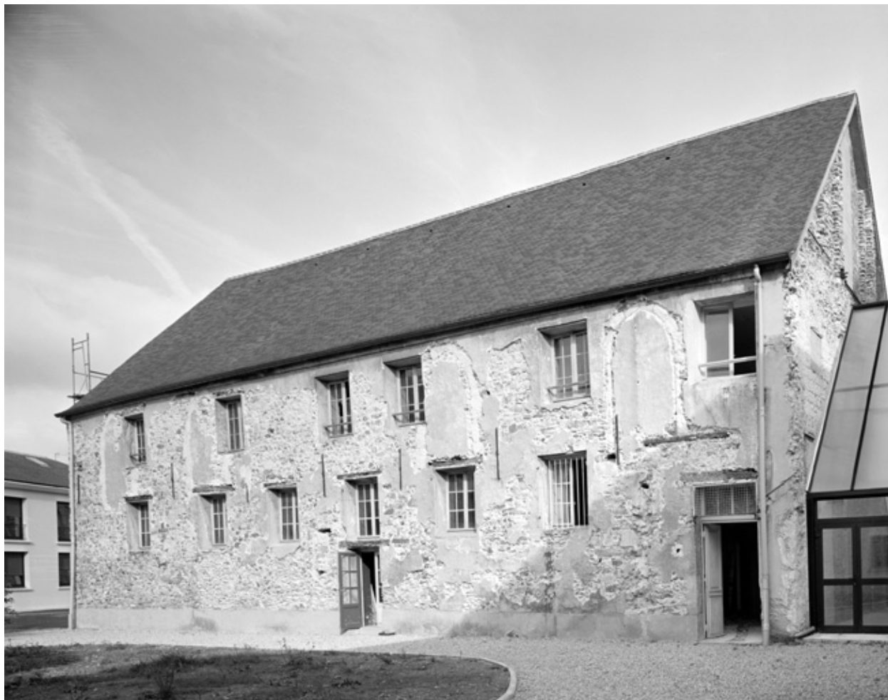
La face occidentale de l'ancienne chapelle, en cours de travaux.