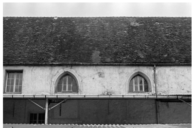
Elévation nord de la chapelle.