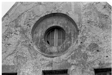
Détail de l'oculus et vue de la façade ouest de la chapelle.