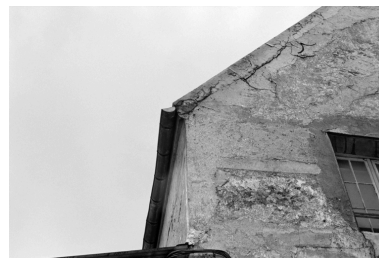
Vue de la chapelle et détail de la façade ouest.