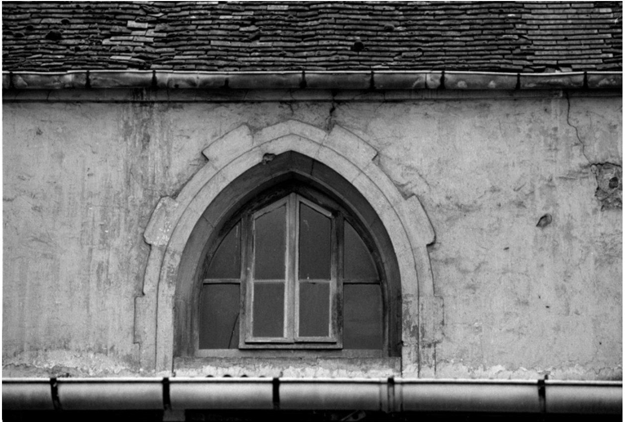
Détail d'une baie de la chapelle.