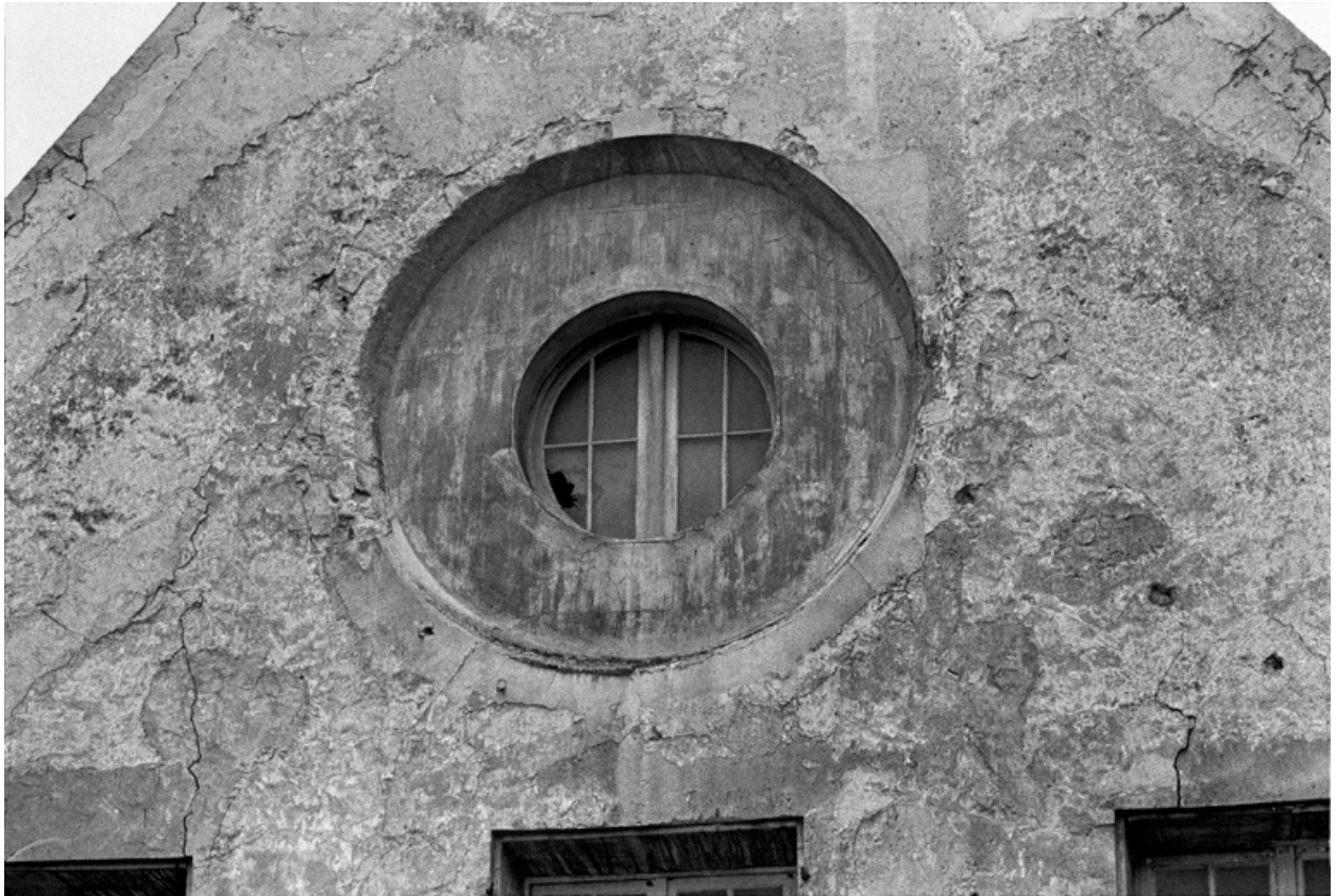
Détail de l'oculus et vue de la façade ouest de la chapelle.