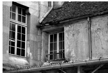
Détail du raccord entre le bâtiment neuf du XIXe siècle et de la chapelle.