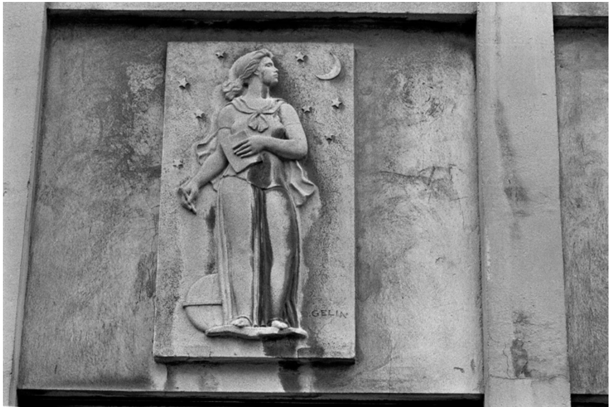
Bas-relief de D. Gelin, 1962.