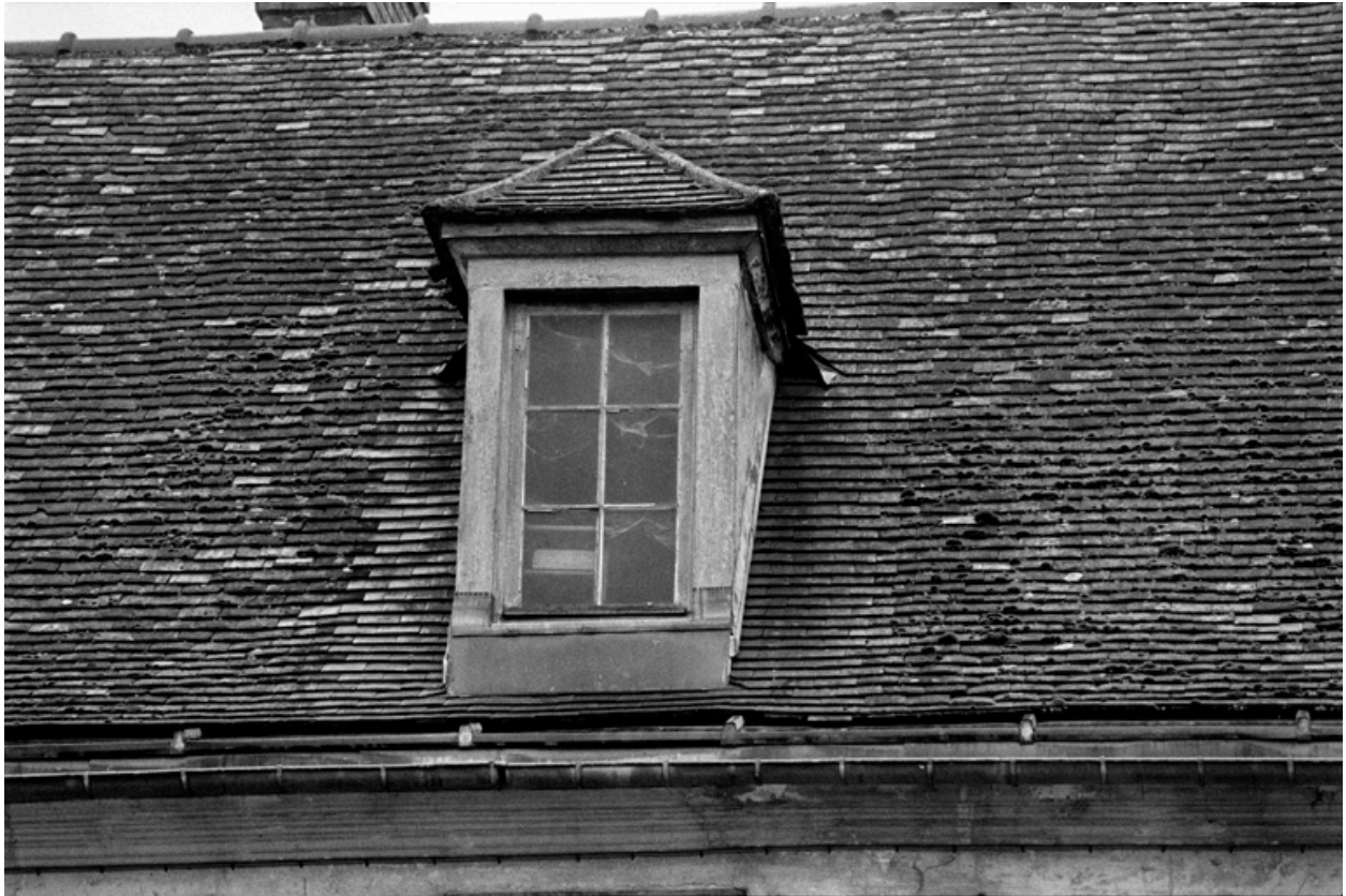
Détail d'une lucarne.