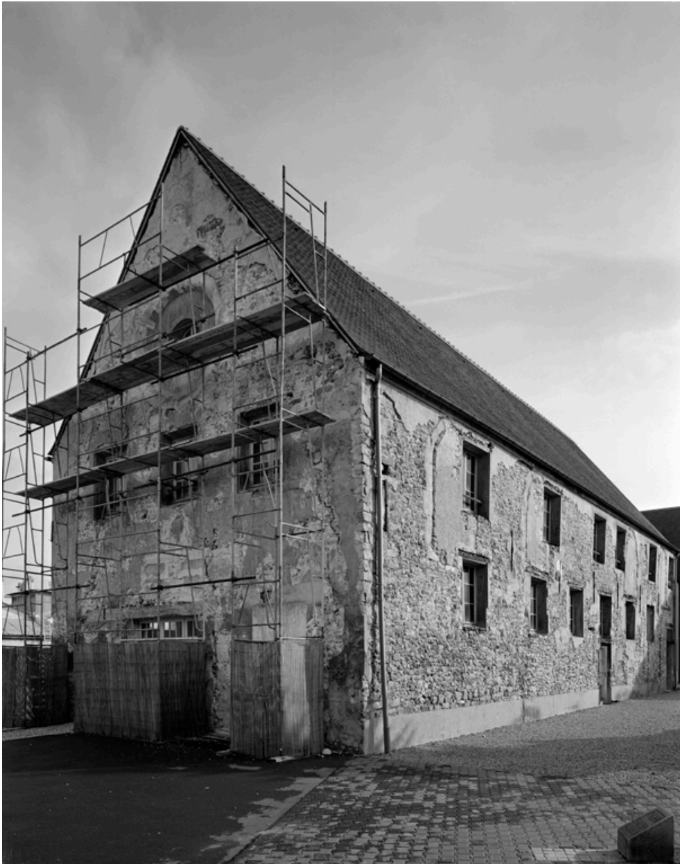
Le pignon de l'ancienne chapelle, en cours de travaux.