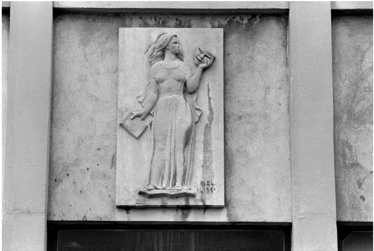
Bas-relief de D. Gelin, 1962.