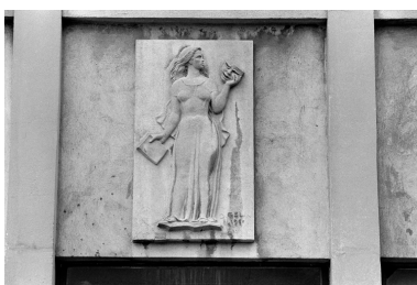
Bas-relief de D. Gelin, 1962.