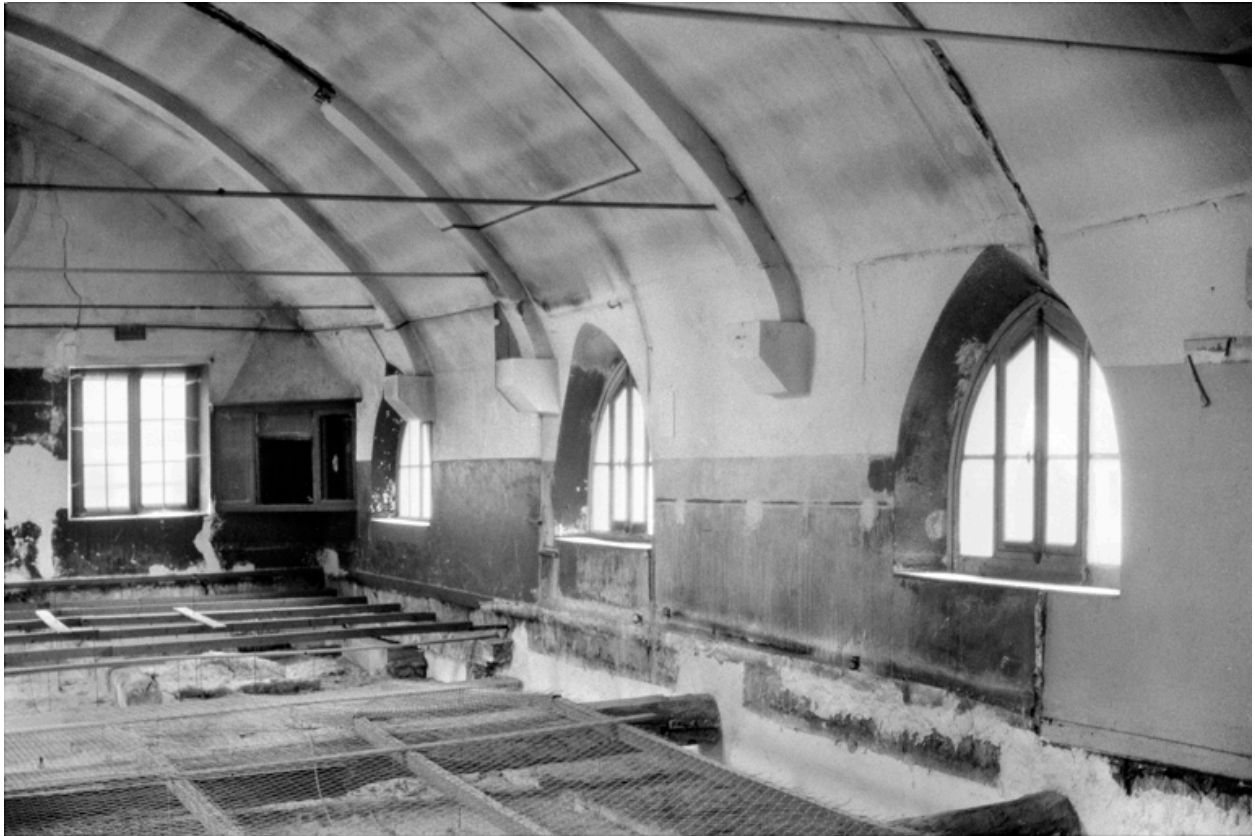
Vue de la chapelle : charpente.