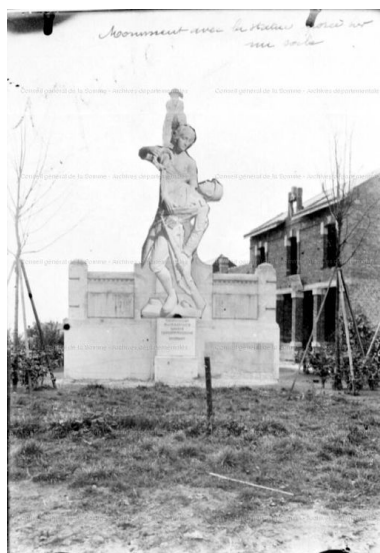
Montage représentant le groupe sculpté sur le monument, 1926 (AD Somme).