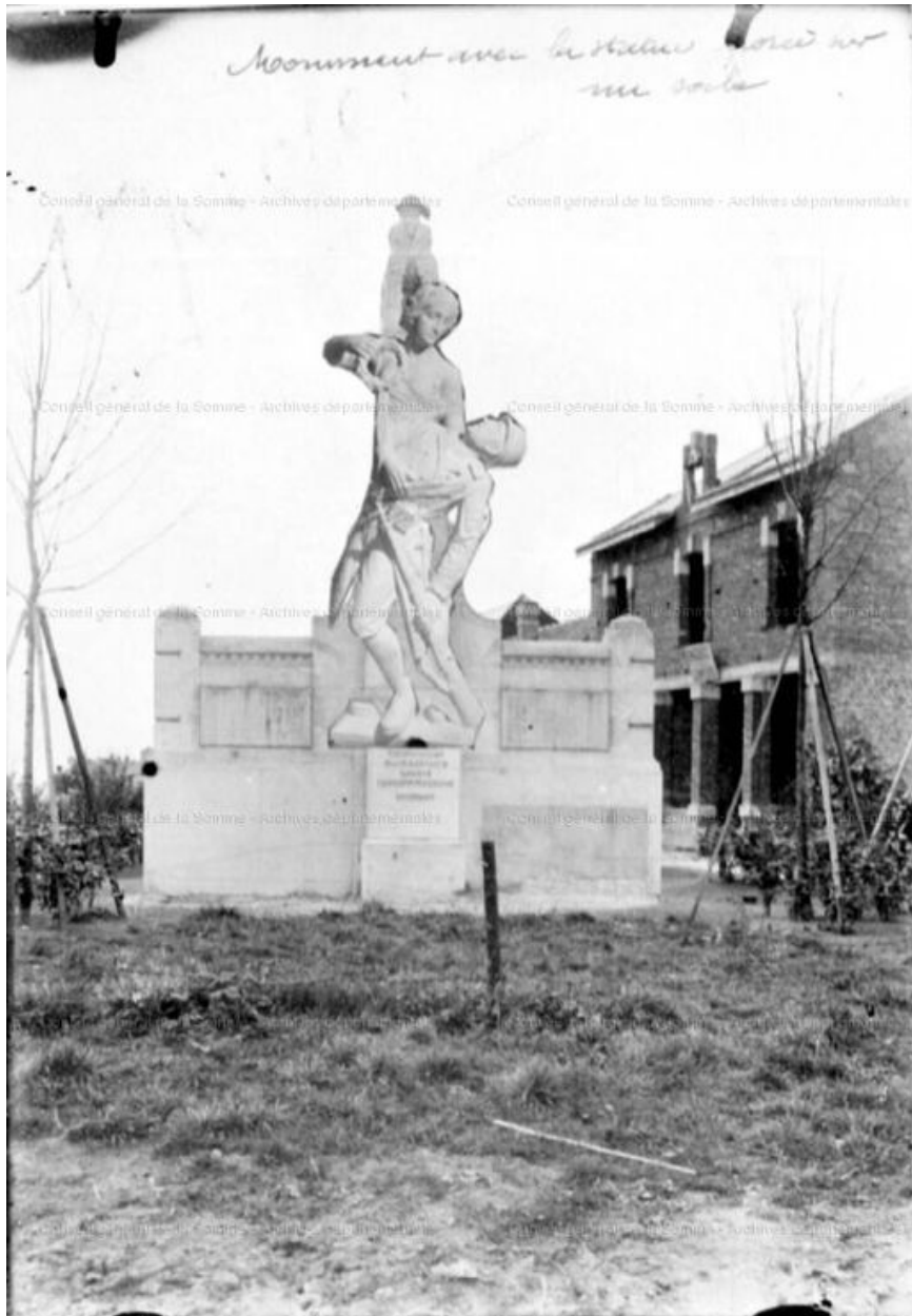
Montage représentant le groupe sculpté sur le monument, 1926.