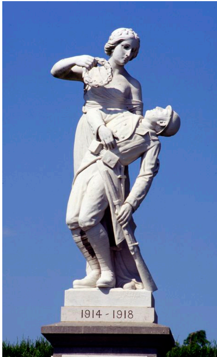
Détail de la statue.