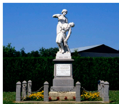
Vue générale. IVR22_19948000585ZA