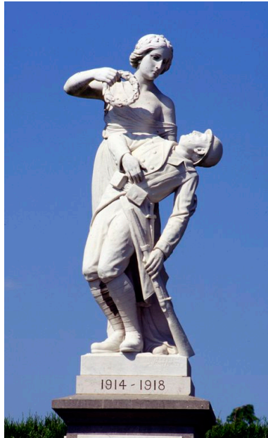
Détail de la statue.