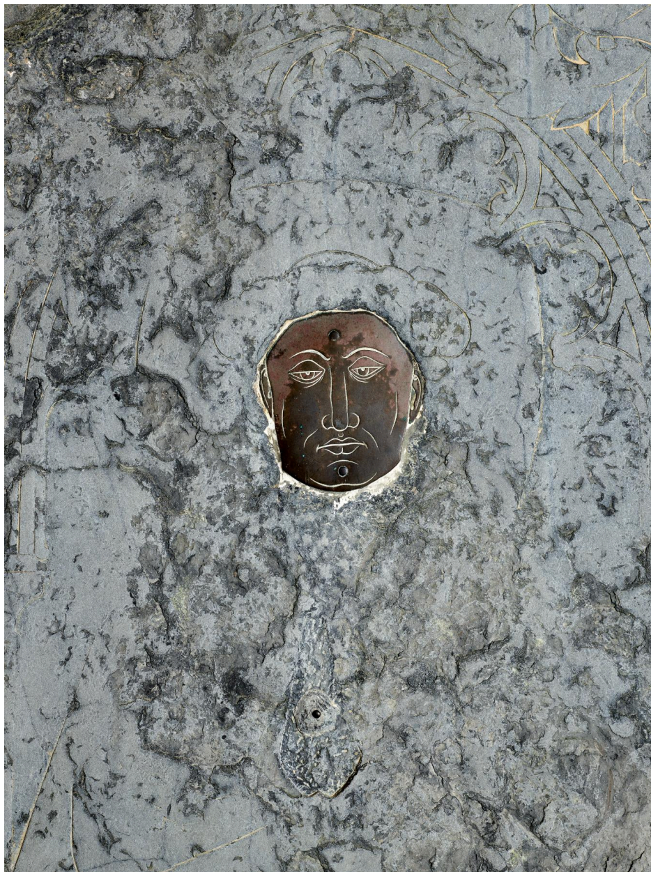
Vue de détail du visage en cuivre.