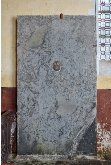
Vue générale. IVR32_20236200205NUCA