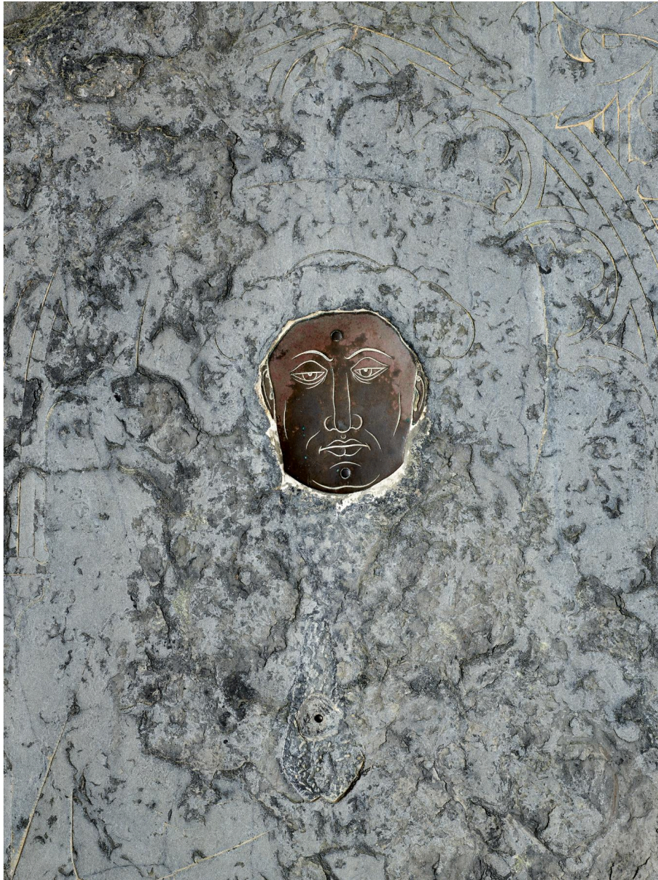
Vue de détail du visage en cuivre.