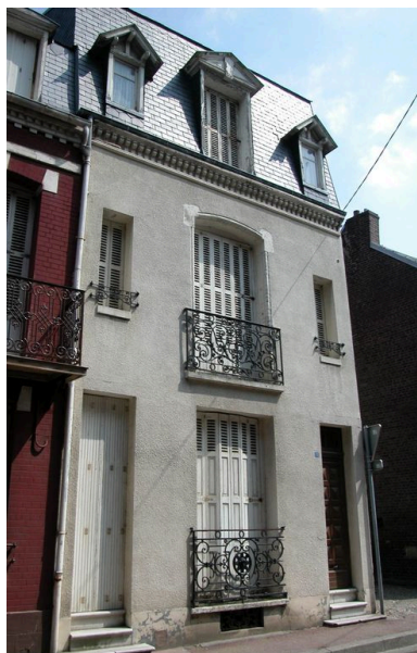
Vue d'ensemble. IVR22_20048001558NUCA