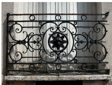
Détail de la ferronnerie du rez-de-chaussée.