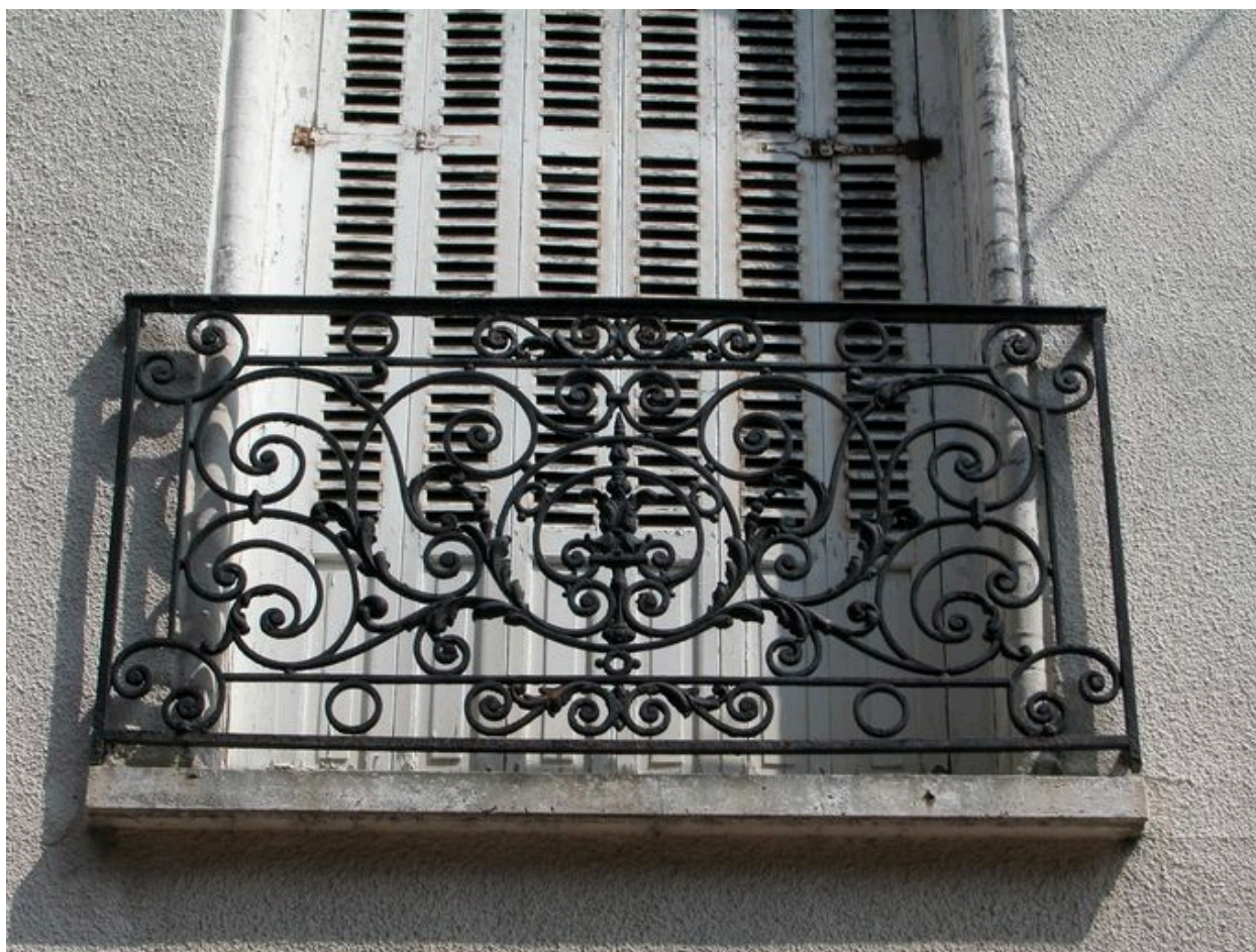
Détail de la ferronnerie du premier étage.