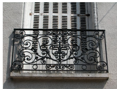
Détail de la ferronnerie du premier étage. IVR22_20048001560NUCA