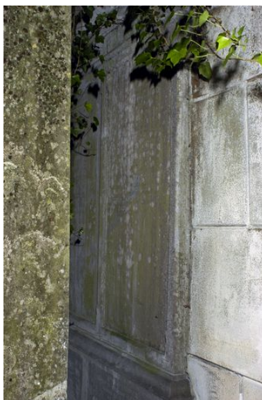
Vue de la stèle derrière le tombeau.