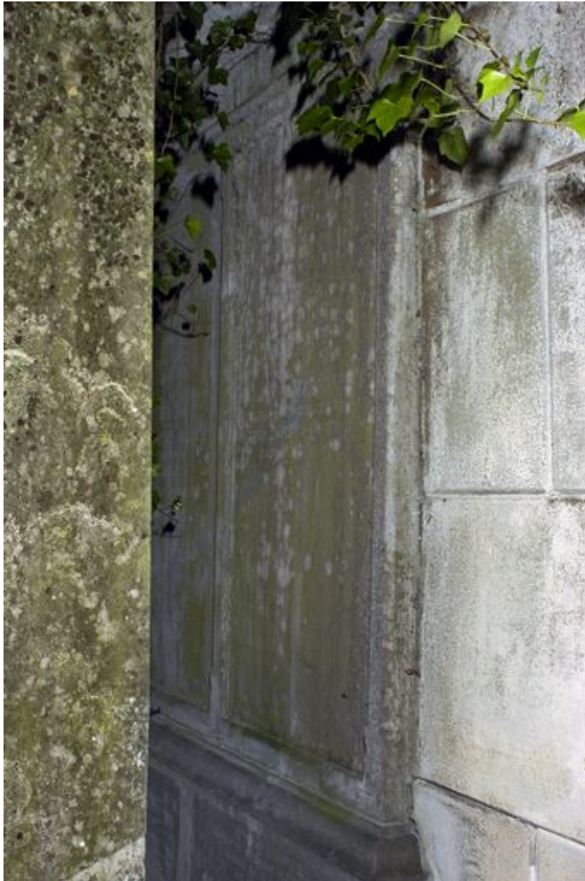
Vue de la stèle derrière le tombeau.