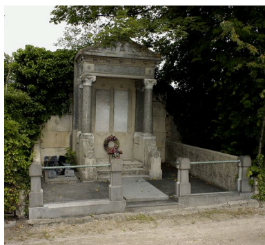
Vue générale. IVR22_20058001103NUCA