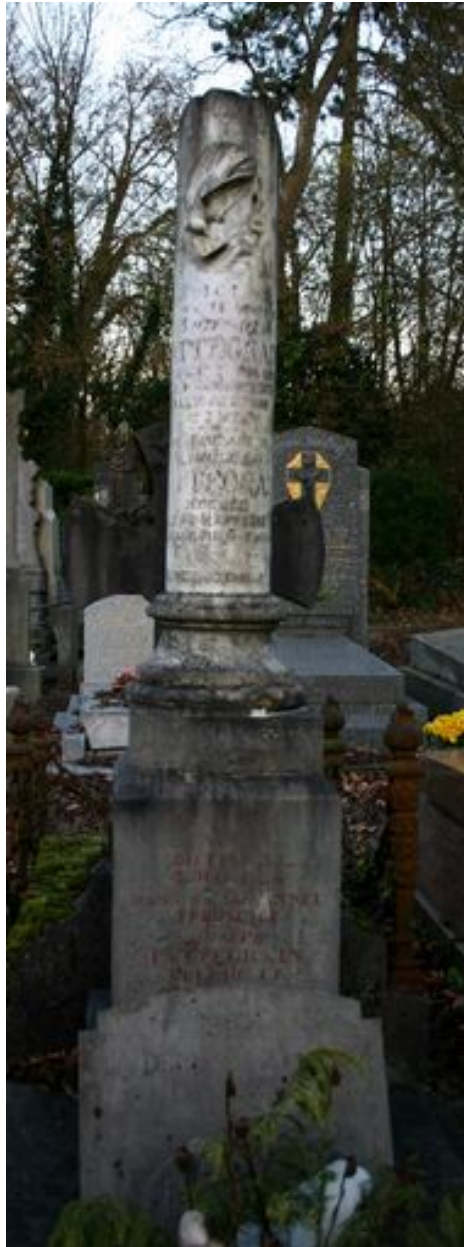
Colonne funéraire brisée.