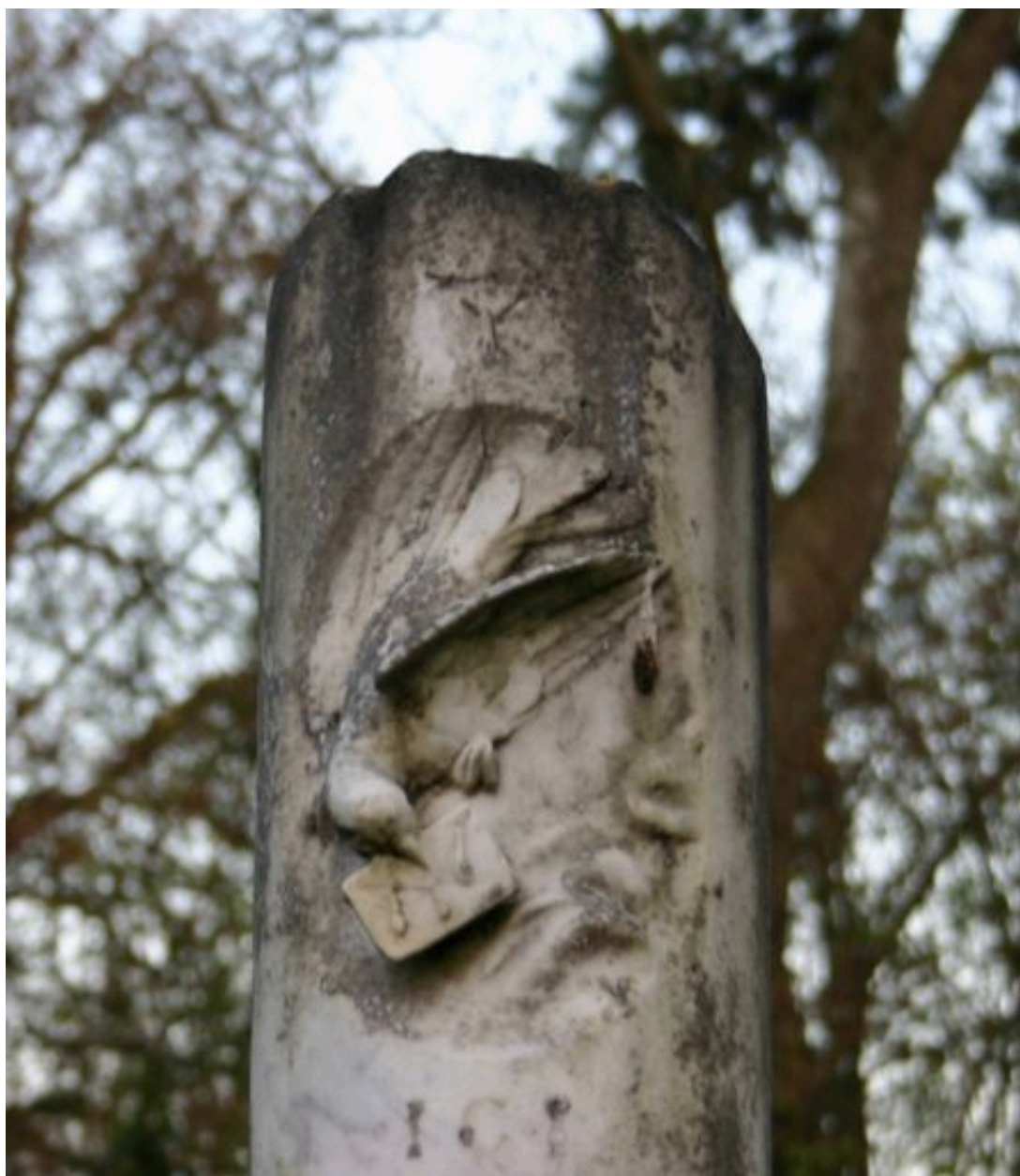
Détail du décor sculpté, représentant une colombe tenant dans son bec une enveloppe.