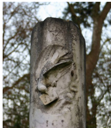
Détail du décor sculpté, représentant une colombe tenant dans son bec une enveloppe.