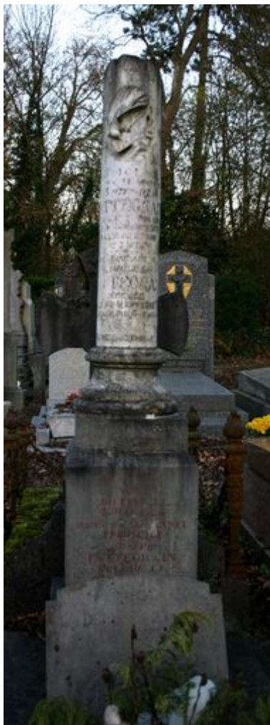
Colonne funéraire brisée.