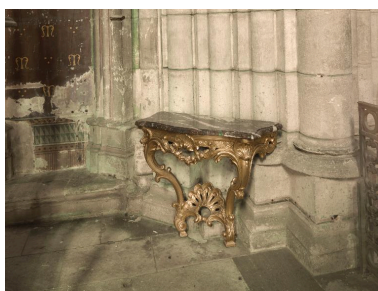
Vue générale de la crédence droite (est), après restauration. IVR22_20130200040NUC2A