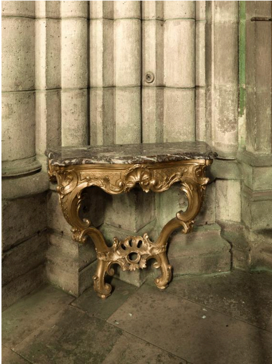
Vue générale de la crédence gauche (ouest), après restauration.