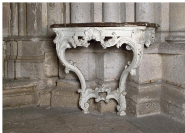
Vue générale de la crédence droite (est), avant restauration.