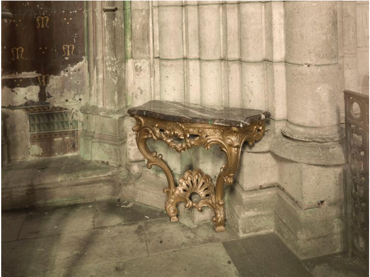
Vue générale de la crédence droite (est), après restauration.