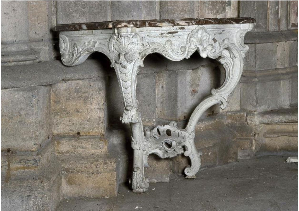
Vue générale de la crédence gauche (ouest), avant restauration.