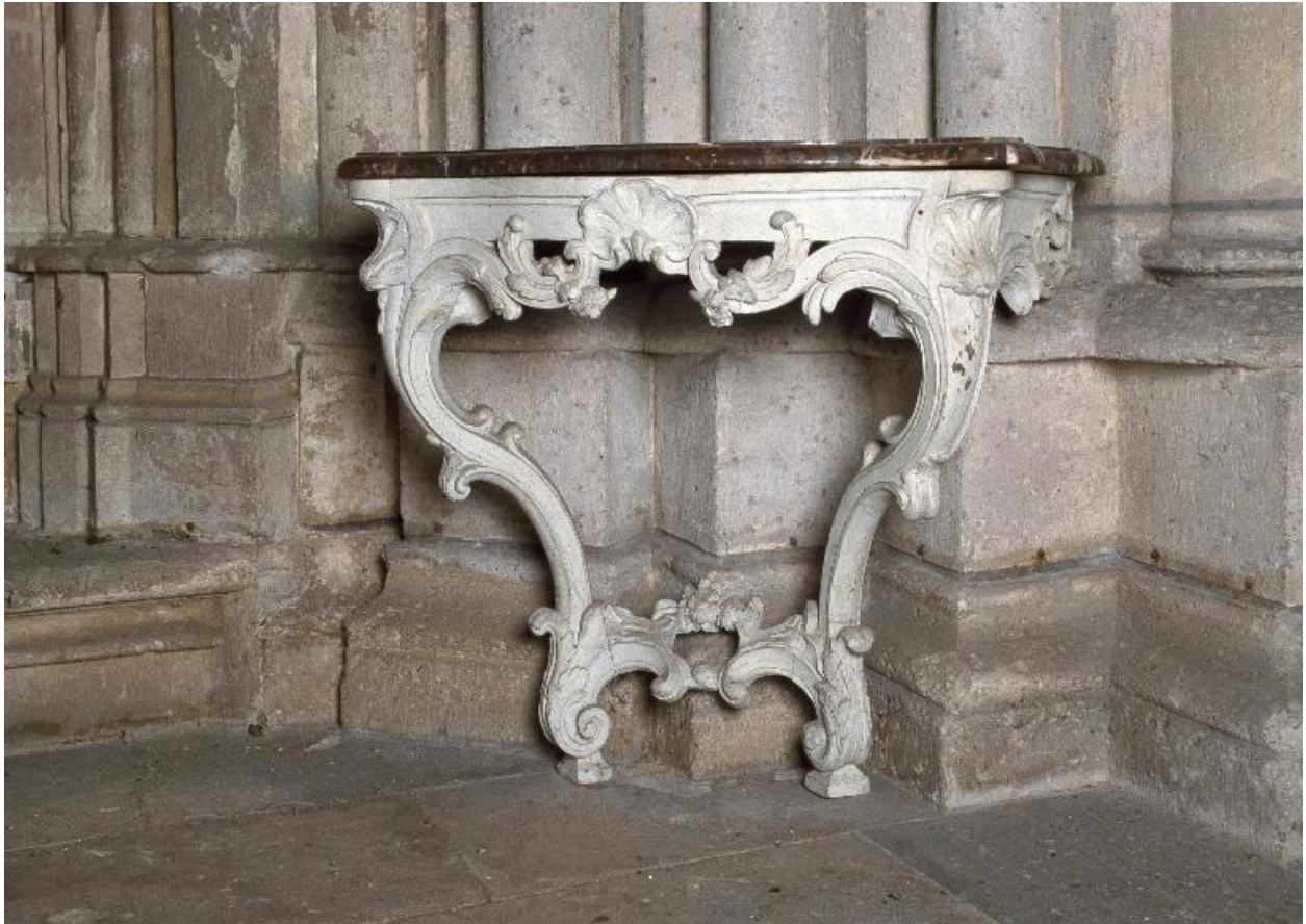
Vue générale de la crédence droite (est), avant restauration.