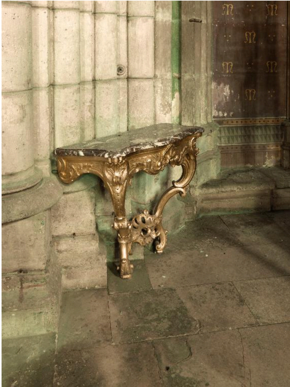
Vue générale de la crédence gauche (ouest), après restauration.