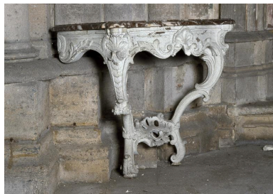
Vue générale de la crédence gauche (ouest), avant restauration. IVR22_20010202300ZA