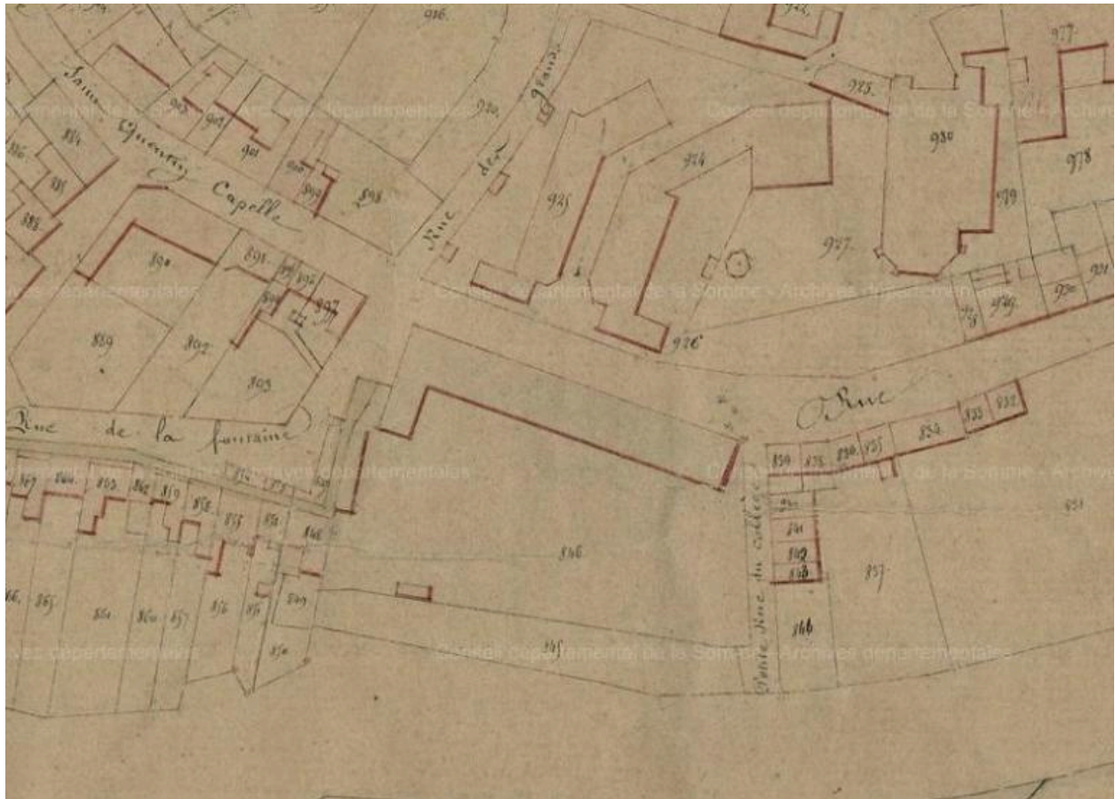
Extrait du cadastre napoléonien