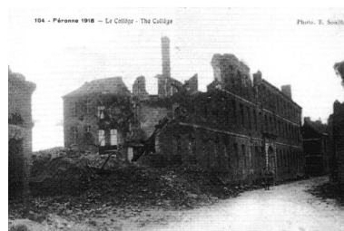
Le Collège en ruines, en 1918 (AD Somme ; 8 Fi 1774). IVR22_20158005699NUCA