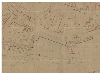
Extrait du cadastre napoléonien (AD Somme ; 3P 2065/4) IVR32_20178005213NUCA