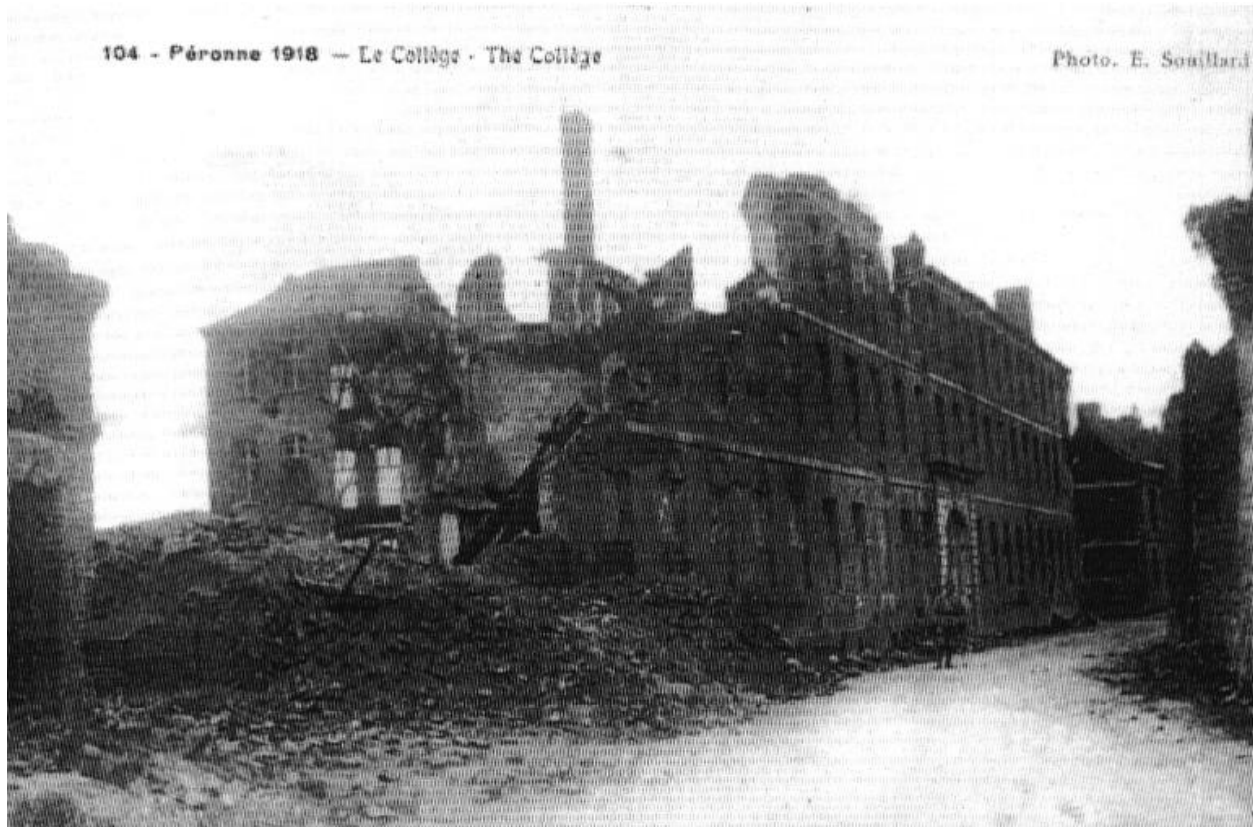
Le Collège en ruines, en 1918 (8 Fi 1774).