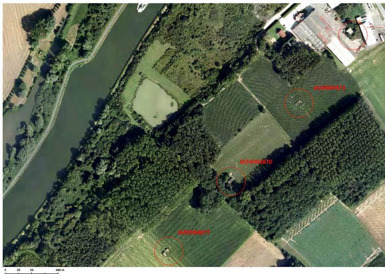
Position de l'édifice (au centre) sur une orthophotographie de 2009