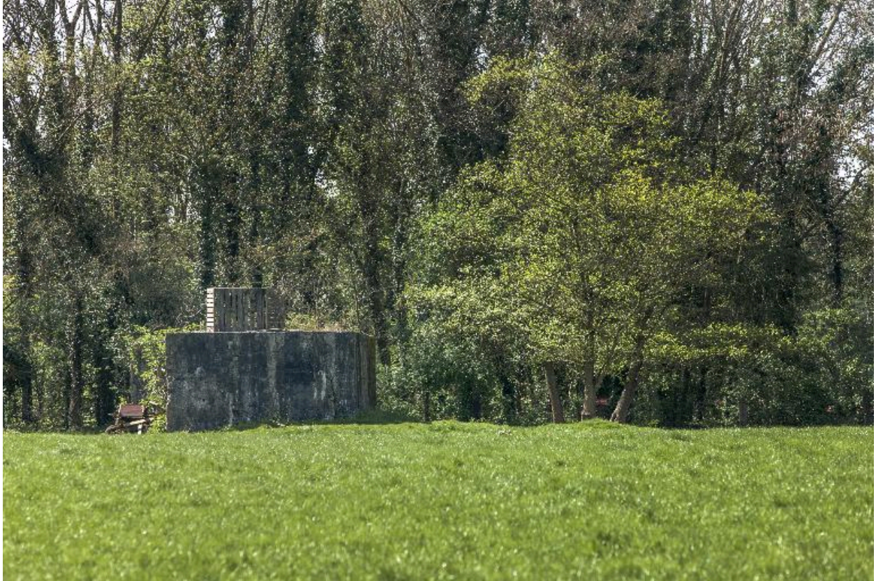
Vue de trois-quarts vers le sud-ouest.