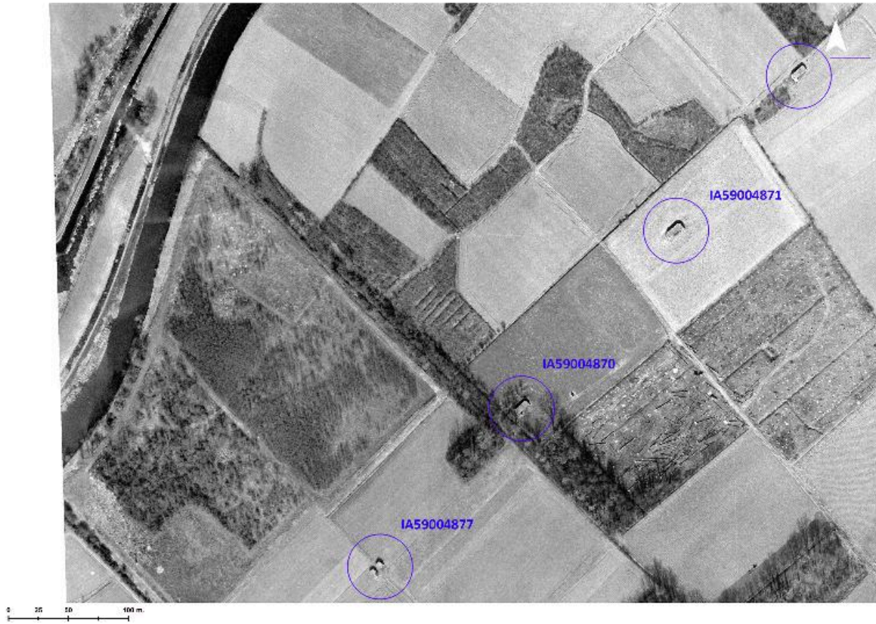
Position de l'édifice (au centre) sur photographie aérienne du 13 mars 1965