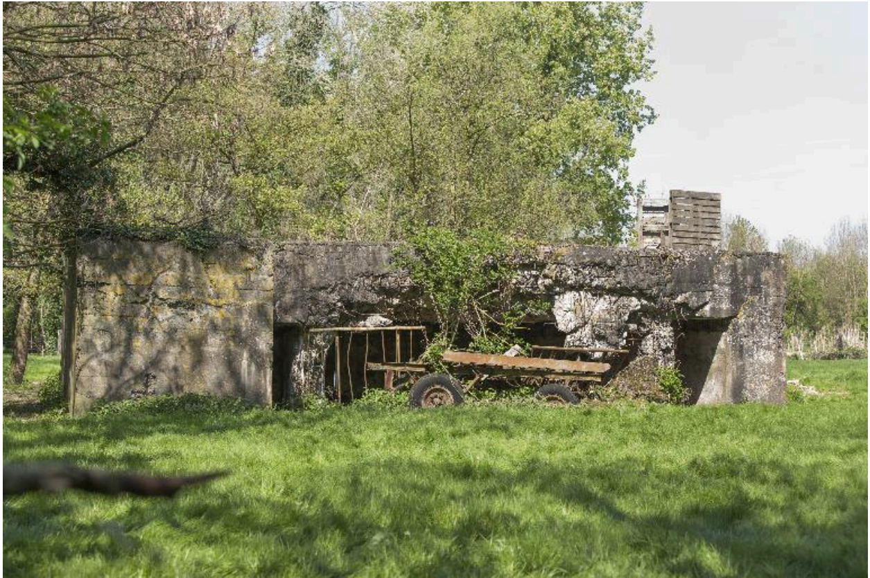
Vue vers le nord