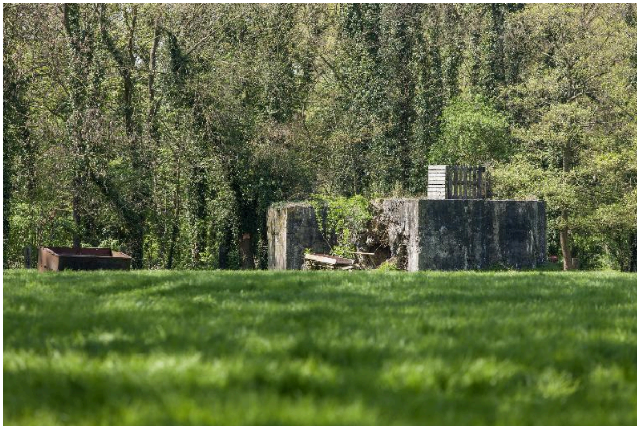
Vue de trois-quarts vers l'ouest.