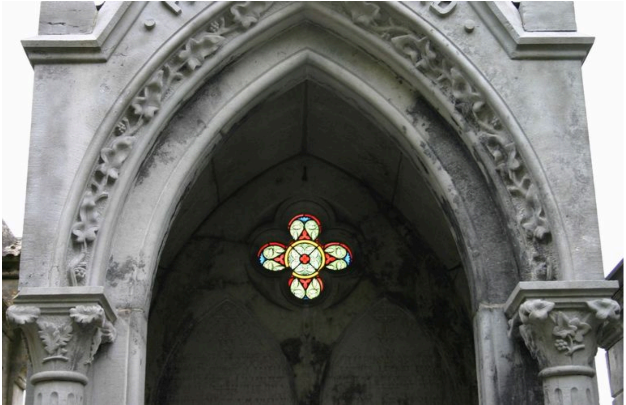
Détail du vitrail quadrilobé.