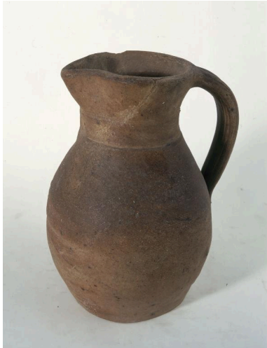
Vue d'ensemble. IVR22_19966001626XA