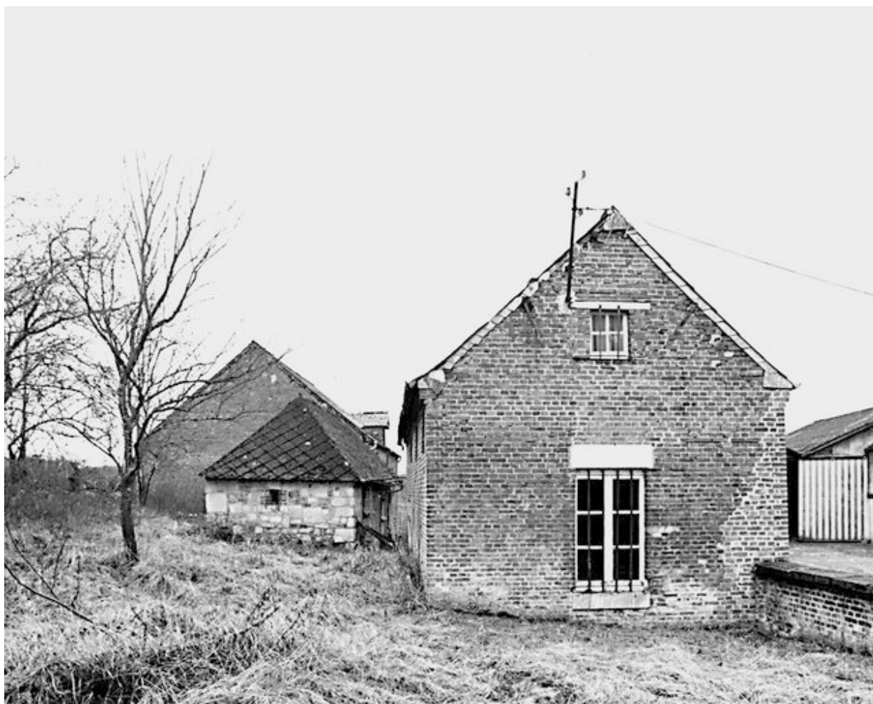
Logement agricole, petite dépendance et étable à l'arrière-plan.