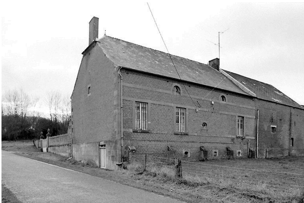
Elévation postérieure du logis.