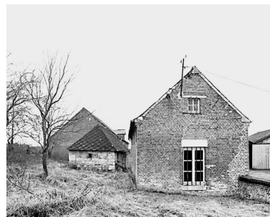
Logement agricole, petite dépendance et étable à l'arrière-plan. IVR22_19970202386Z