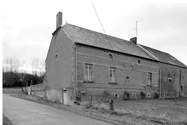
Élévation postérieure du logis.