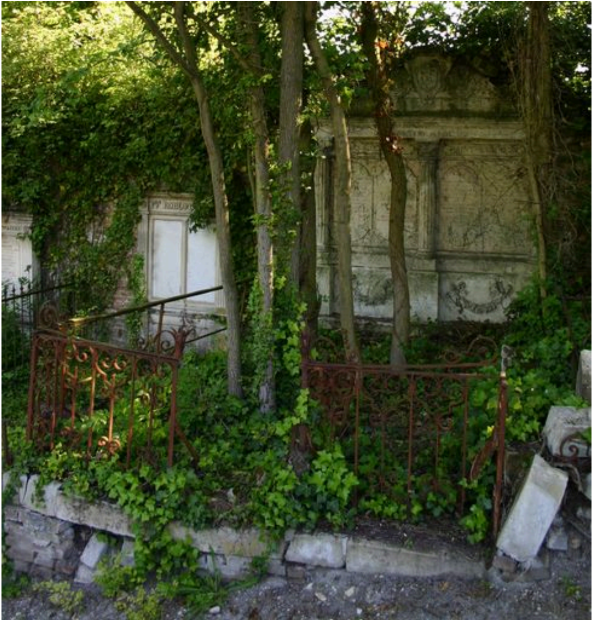
Vue générale de côté.