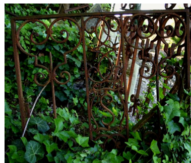
Portillon en fer forgé avec le monogramme S de la famille Saint.