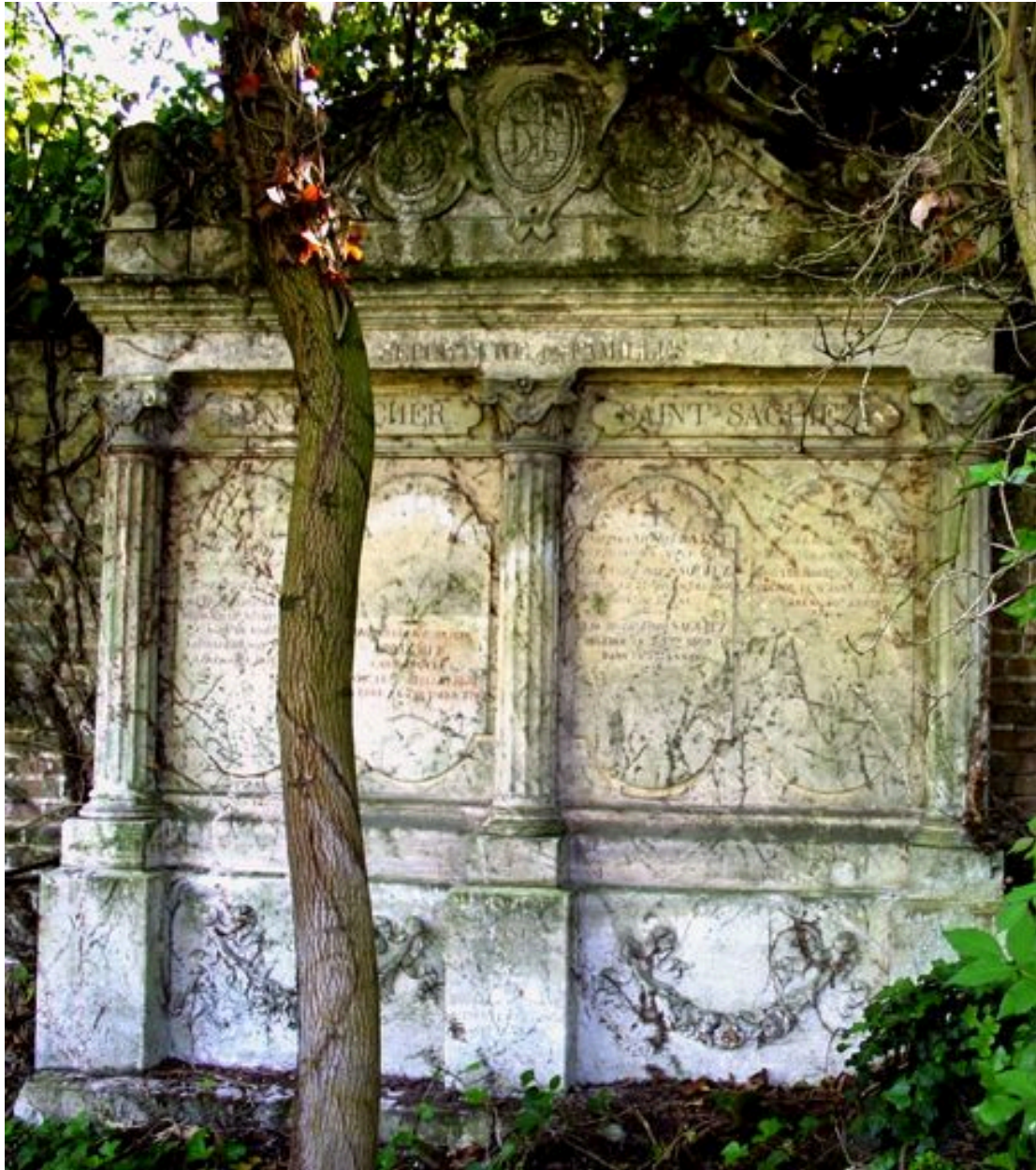
Stèle à entablement et fronton à volutes.