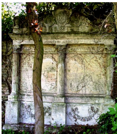
Stèle à entablement et fronton à volutes.