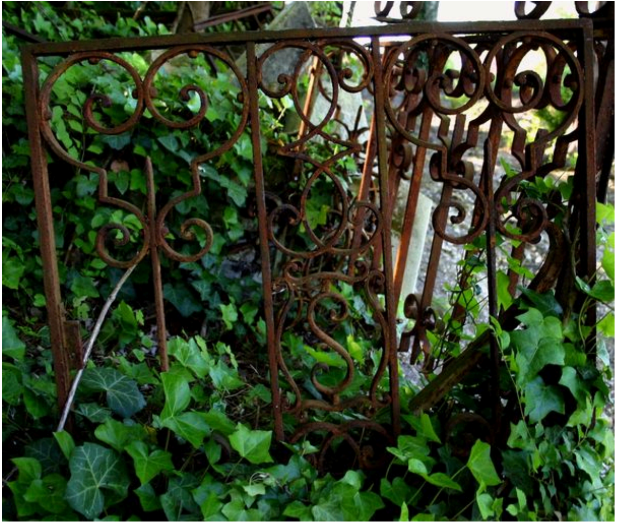
Portillon en fer forgé avec le monogramme S de la famille Saint.