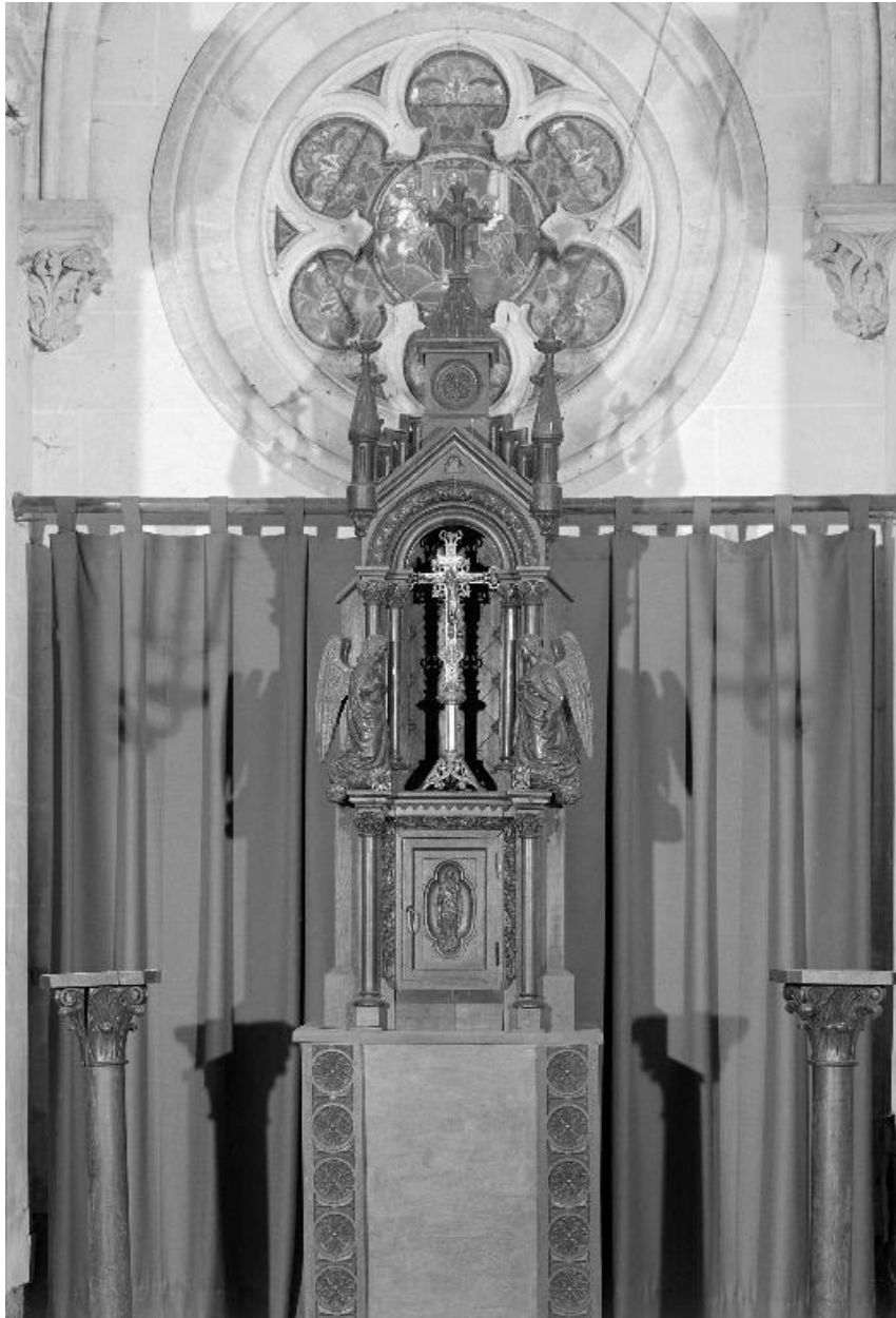
Tabernacle avec son dais d'exposition.