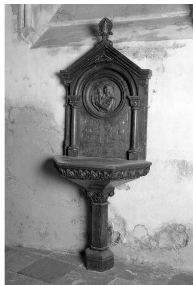
Crédence. IVR22_19988000064X