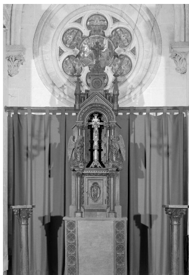
Tabernacle avec son dais d'exposition.