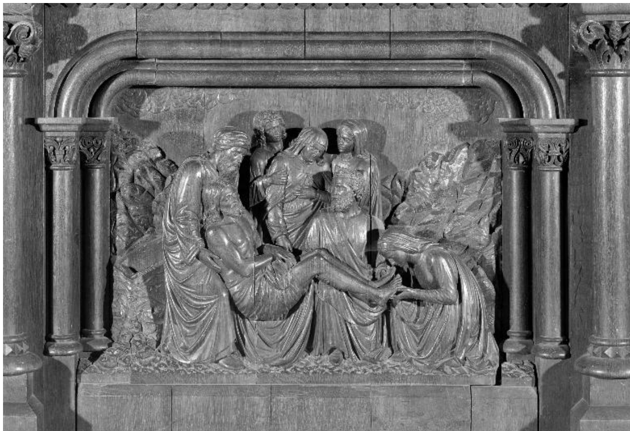
Détail du maître-autel : Mise au tombeau.