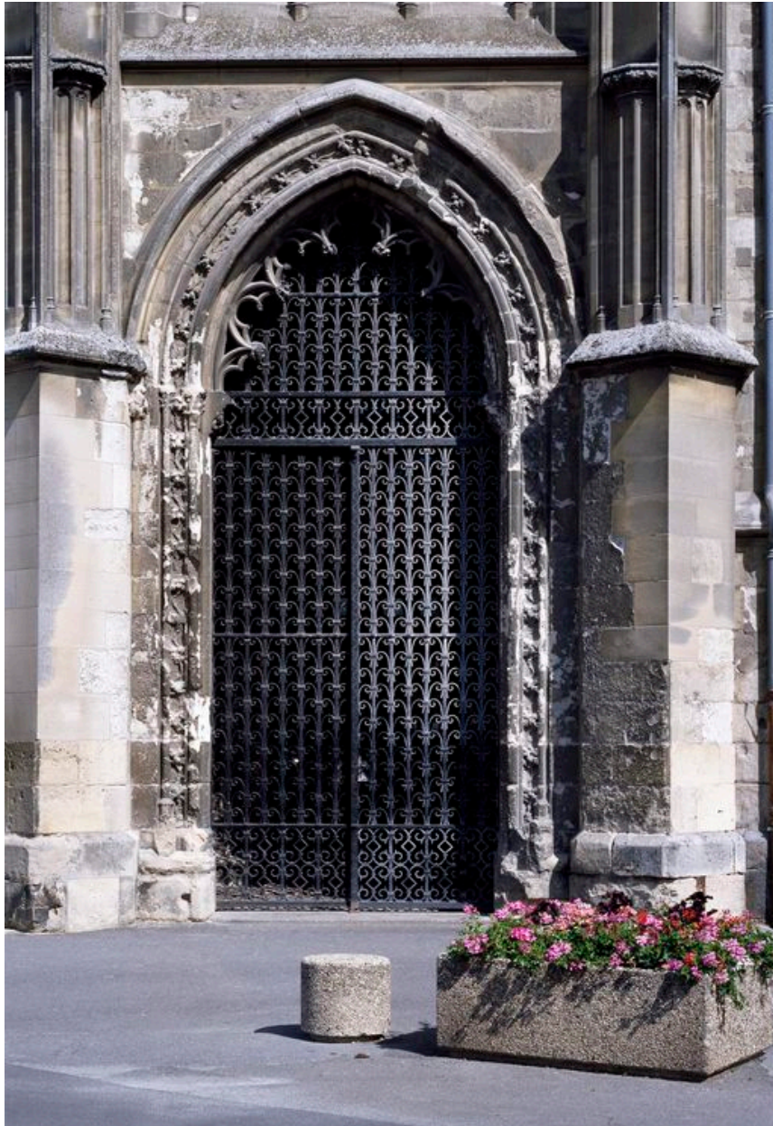
Vue générale du portail.