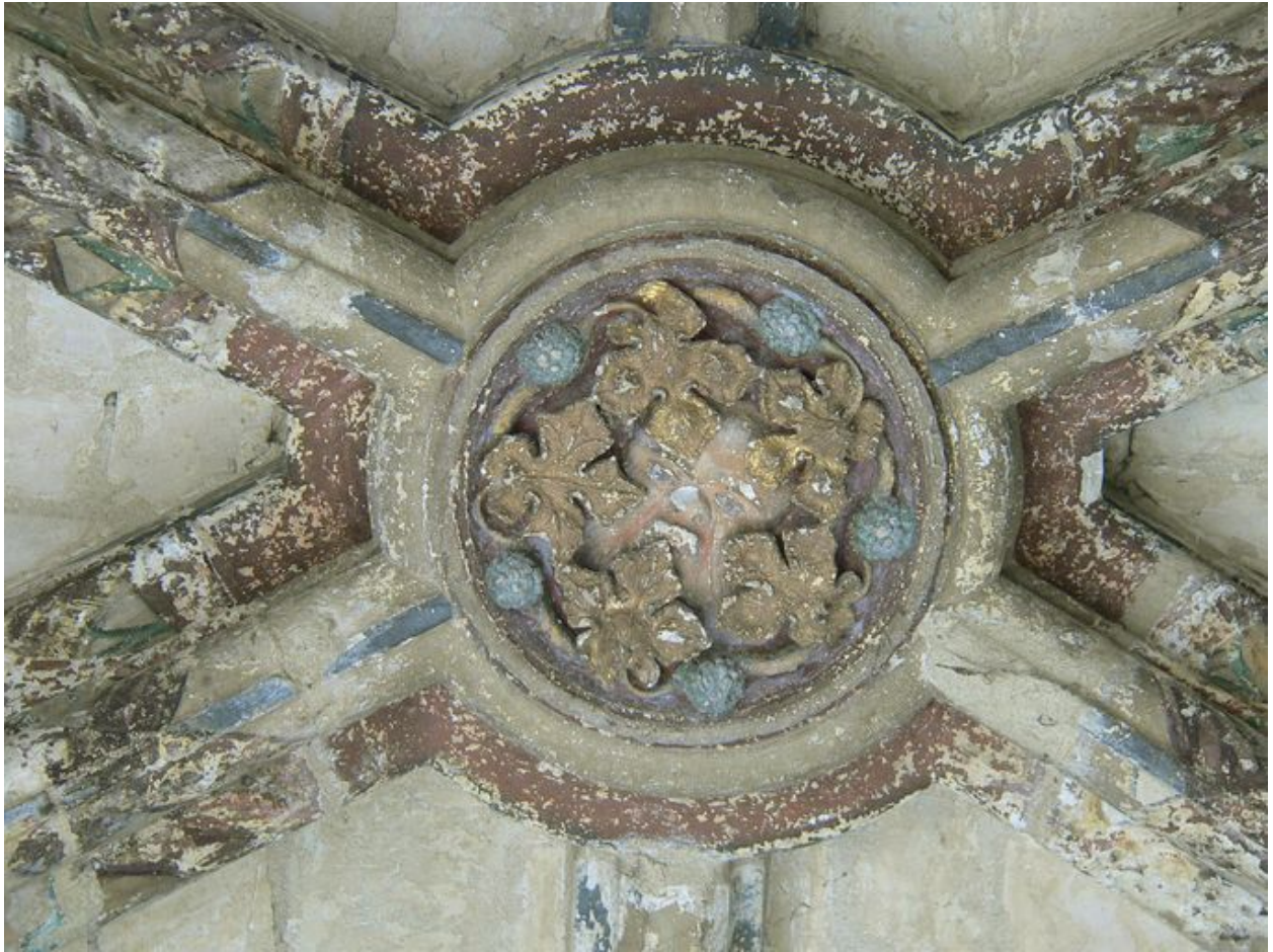
Vue de la clef de voûte du porche.