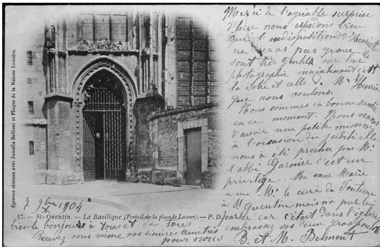
Carte postale représentant le portail Saint-Quentin vers 1900.