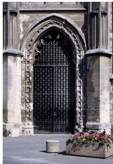
Vue générale du portail.