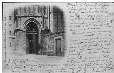
Carte postale représentant le portail Saint-Quentin vers 1900.