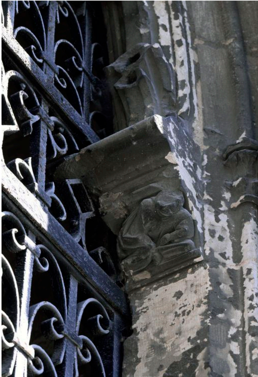
Vue d'un corbeau figuré.