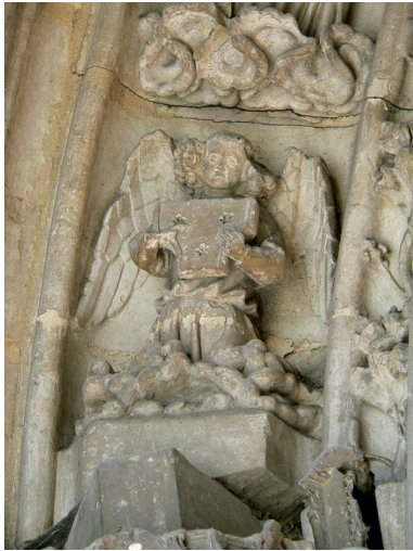
Vue d'un ange jouant du psaltérior. IVR22_20110201070NUCA