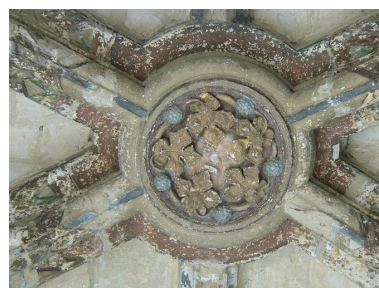
Vue de la clef de voûte du porche. IVR22_20110201116NUCA