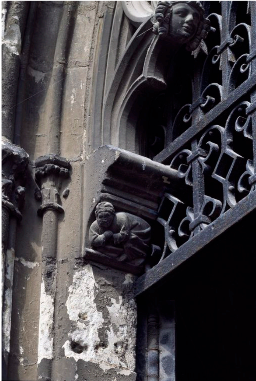
Vue d'un corbeau figuré.