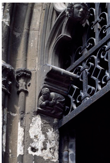
Vue d'un corbeau figuré.