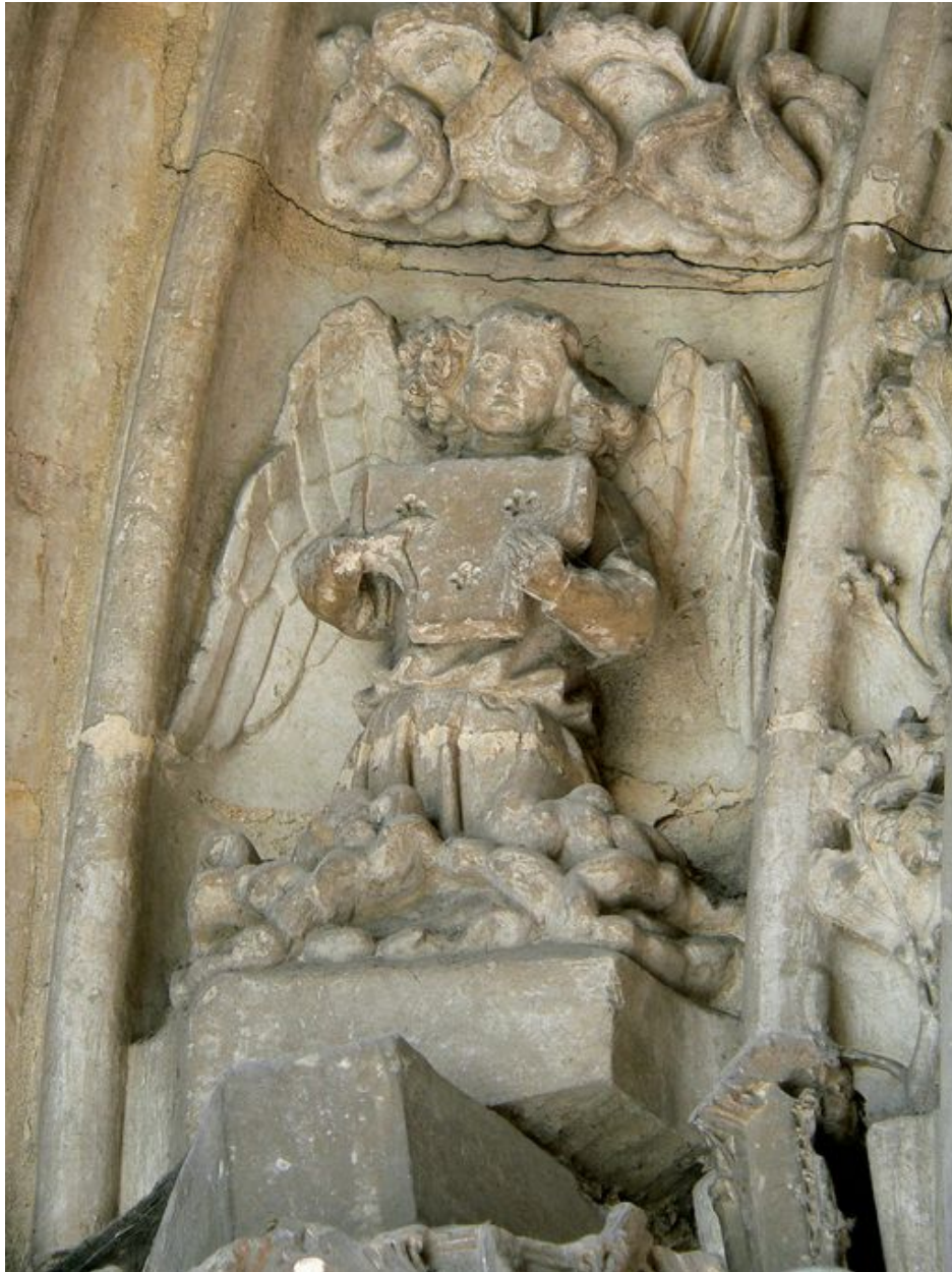
Vue d'un ange jouant du psaltérion.