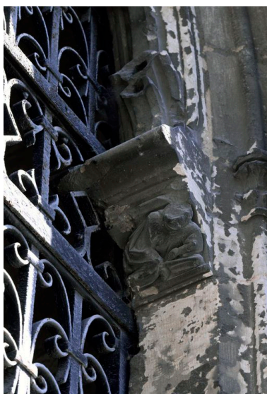
Vue d'un corbeau figuré. IVR22_20110200035XA